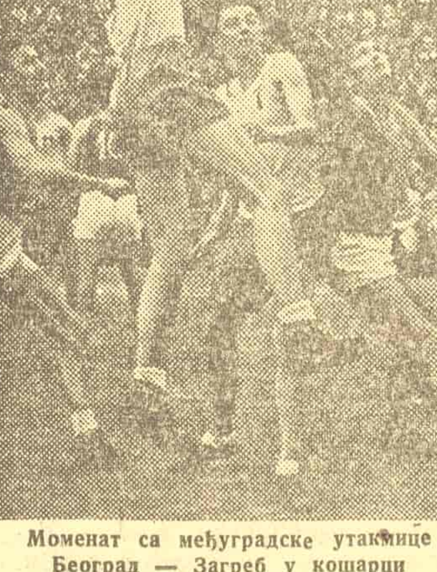
Момент са међуградске утакмице Београд — Загреб у кошарки