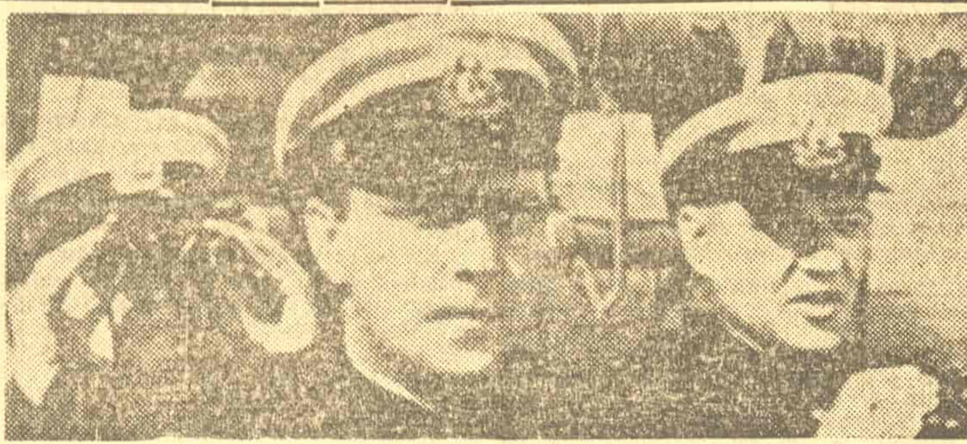
Сцена из филма „Четврти перископ“