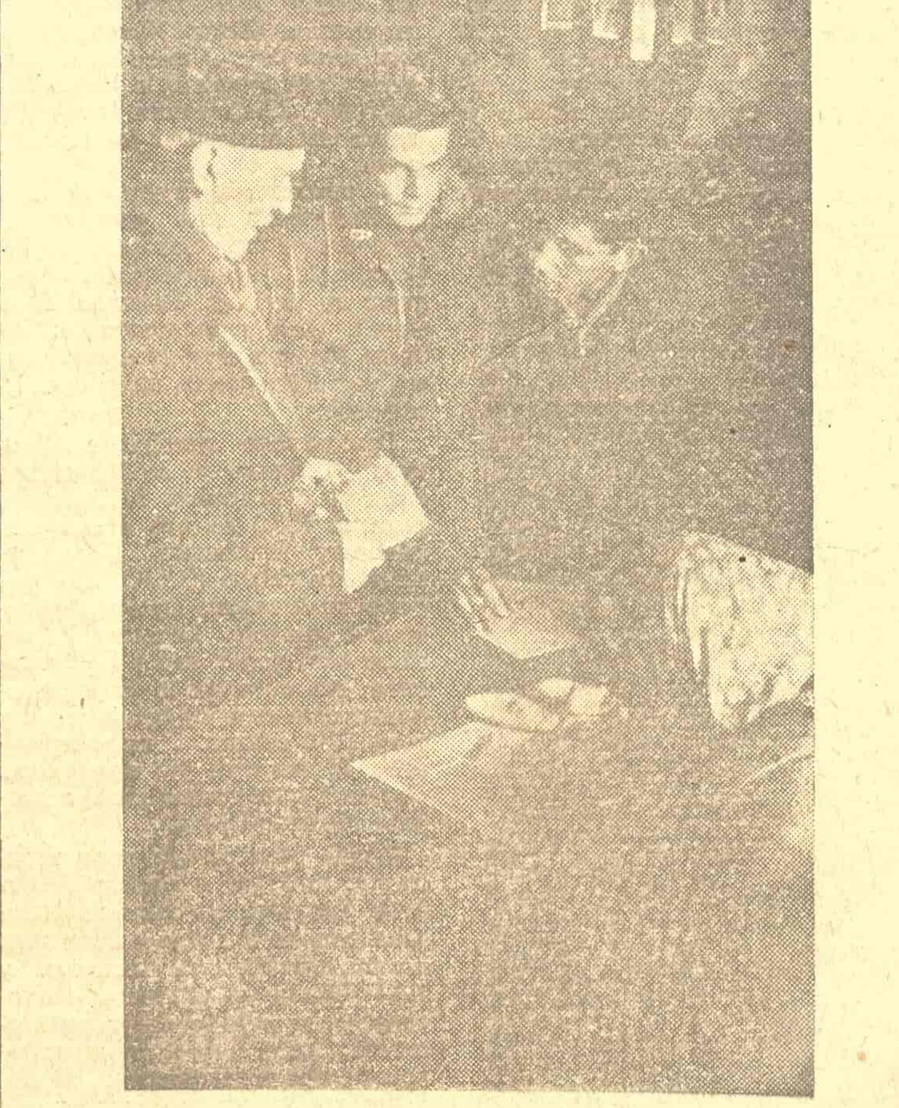
Гласање у Другој основној — најбољој организацији Шестог рејона

зборовима у 1948 години није било потпуно. На зборовима у марту прошле године од укупно 457 рејонских и 200 градских одборника било је присутно 339 одборника, у августу 291, а у децембру 457. Одборници понекад немају ближек контакт са својим бирачима, што у извесној