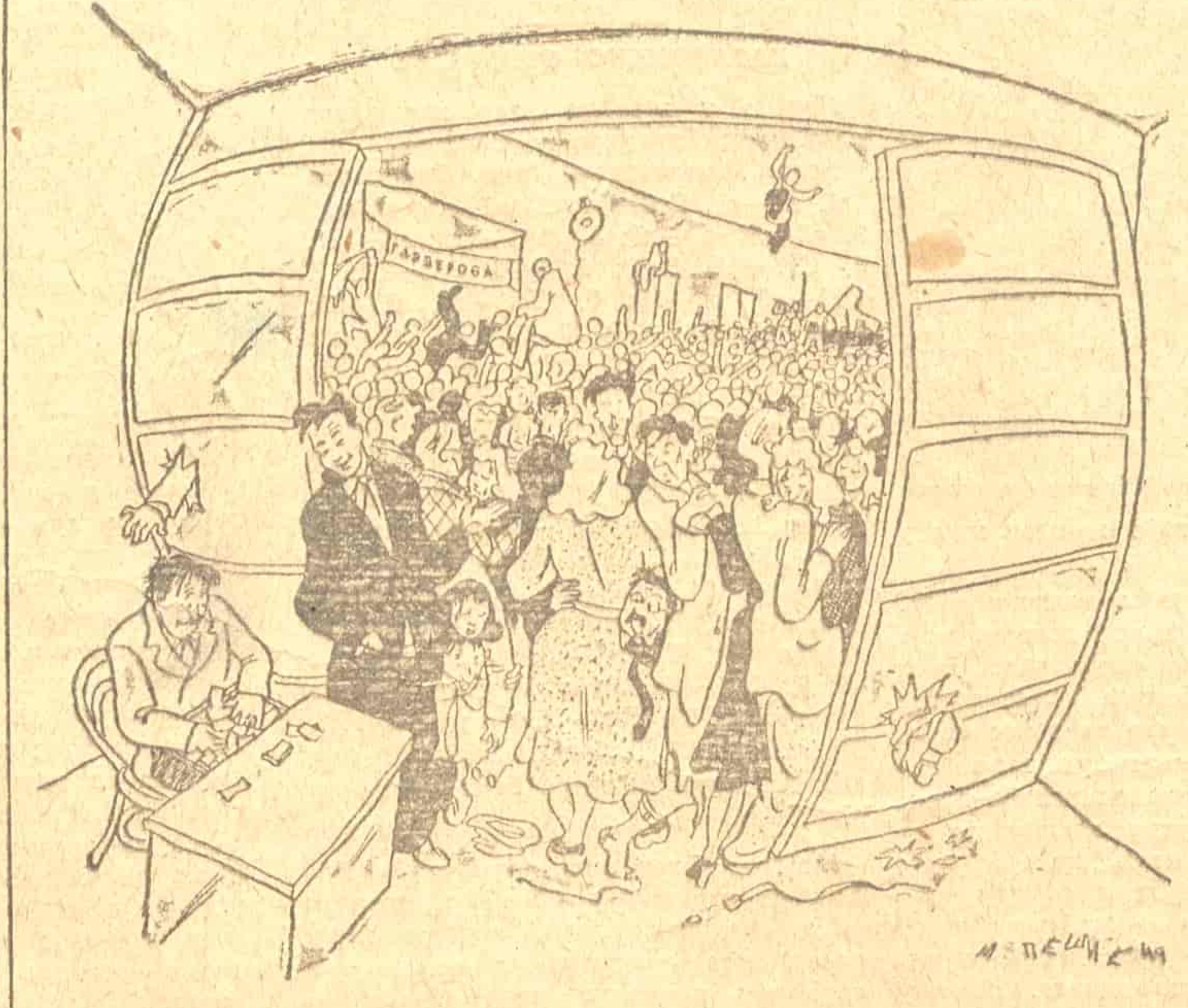
— Штета што људи не могу као муве да иду по плафону, — повећали би приход за 1000/0!