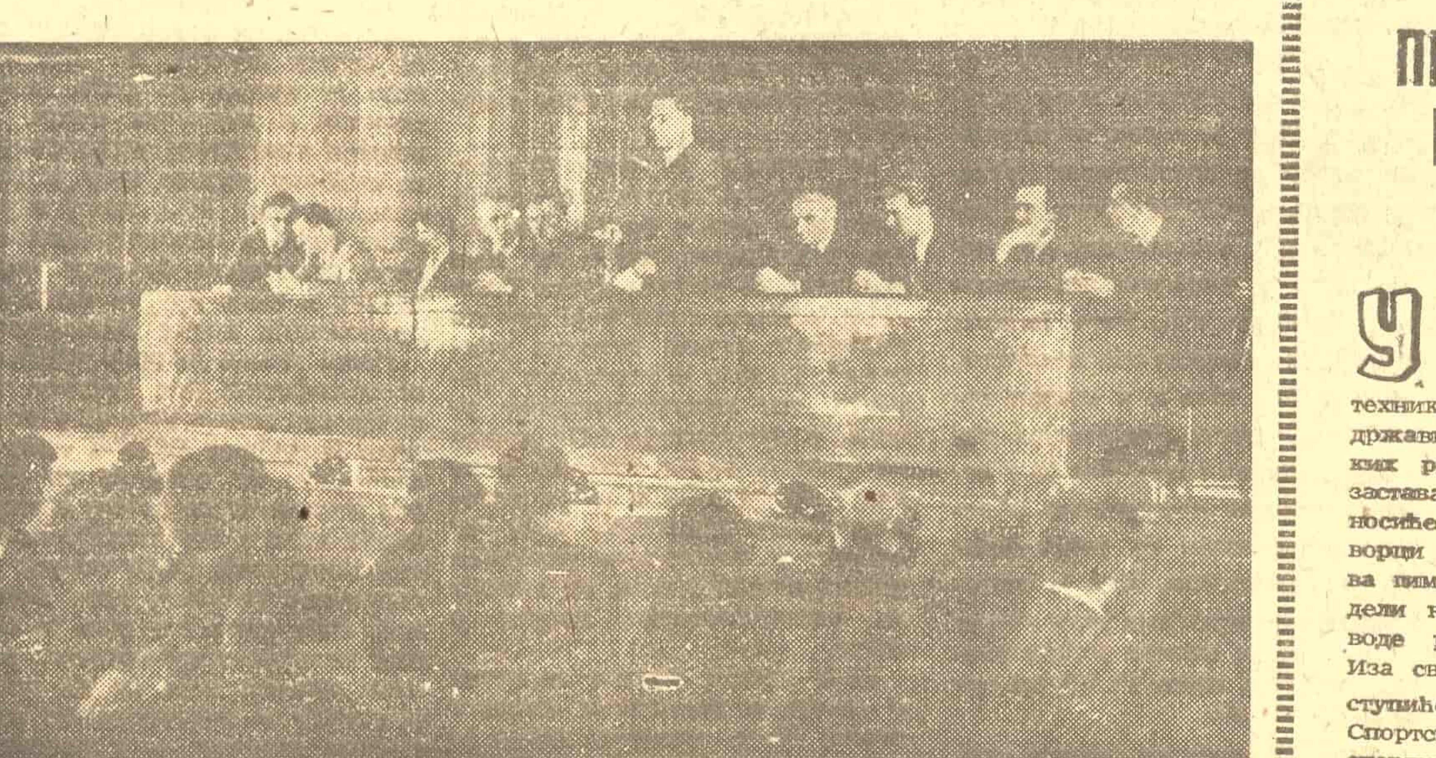
На Коларчевом универзитету у Београду одржан је 16 априла митинг поводом одласка наше делегације у Париз која ће заступати нашу земљу на Светском конгресу присталица мира.

На митингу су говорили претставници Савеза књижевника Југославије, Савеза удружења новинара Југославије, Савеза синдиката Југославије, Савеза бораца Народно-ослободилачког рата, Савеза ратних војних инвалида, Црвеног крста и других.