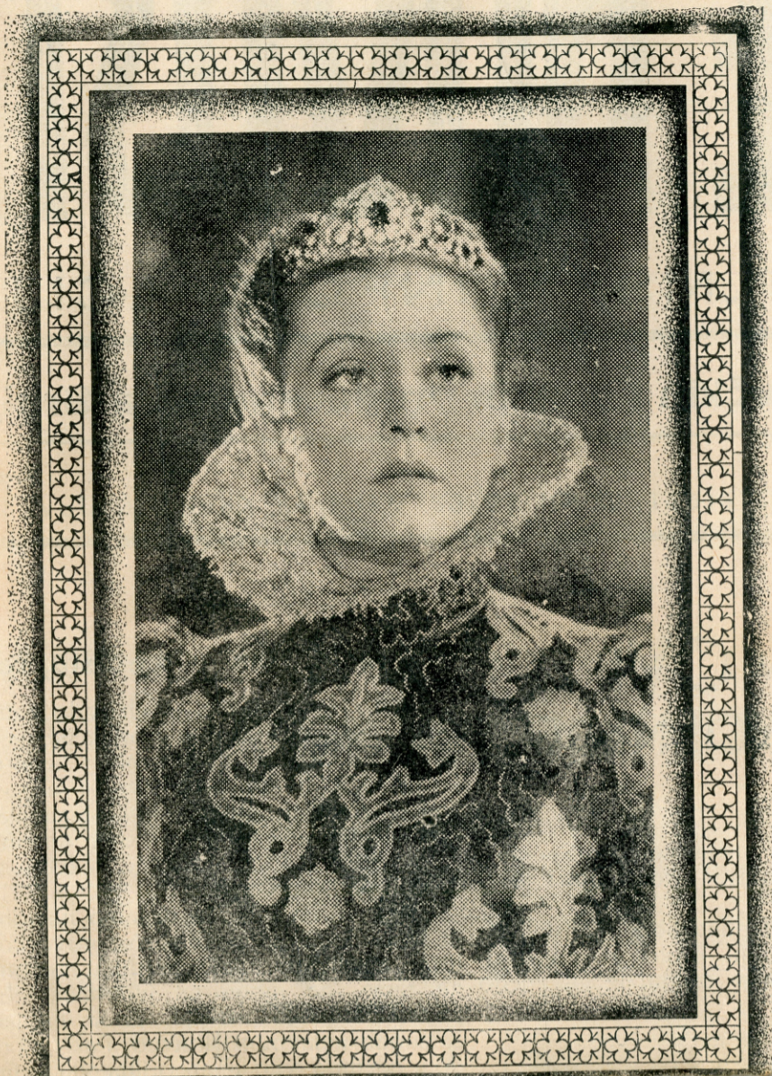
Zarah Leander kao Marija Stuart

Na Marijinu licu, za koje se tvrdi da je bilo najlepše u ono vreme, blistaše pod velom ranog udovištva vedrina bezbrižnosti, koju će naskoro da zameni tuga i briga. Podigavši veo pogledala je kardinalu u oči i odgovorila: »želim da budem jača, moćna i velika kraljica!«