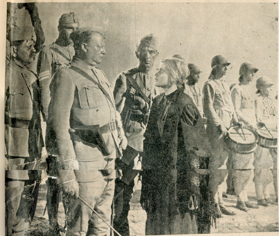
Englezi biju zarobljene žene