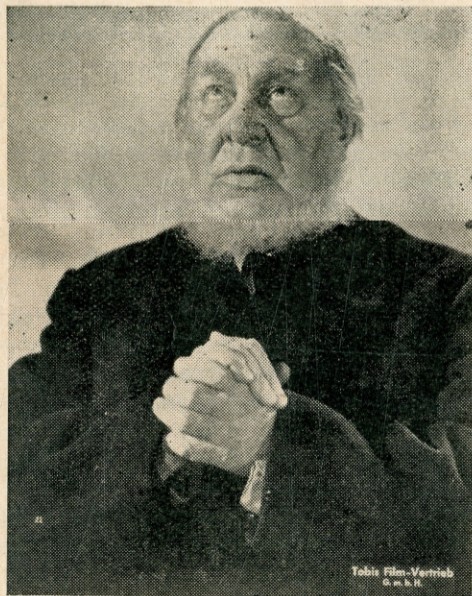
Ohm Krüger očajava pred propast Bura

Paul Krüger, mudri predsednik Transvala, znao je godinama, da se približava rat sa Engleskom. Znao je, da engleski vlastodršci traže samo izgovor, da opljačkaju rudnike zlata i polja dijamanta njegove zemlje.