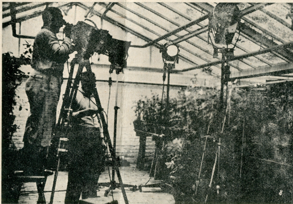
Snimanje kulturnog filma o biljkama u „Ufinom“ ateljeu

nerazumljivosti kulturnog filma; moglo se snimiti toliko reči, koliko je bilo nužno, da se film razume, ali onda je učinjena druga greška: snimalo se predavanja sa raznih područja nauke uz prilog slika — i tako je film opet bio dosadan. Tek neki put naišao bi po neki film kao iznimka, koji nije bio suhoparan, te koji je preiskazivao, da će doći i vreme umetničkog kulturnog filma. Tada je bilo zaista malo takvih filmova, koji bi mogli da povuku i osvoje masu, ali bivalo ih je sve više i više. Poslednjih godina mnogi kulturni film bio je zabavan i interesantan. Da-