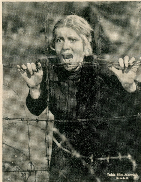
Žena predsednika Krügera u logora

ljudima, te svaku stopu osvojene zemlje platiše svojom krvlju. Preko reke Vala nadjoše Buri novu svoju otadžbinu i nazvaše je Transval. Do Transvala obrazovaše se još jedna burska republika — Oranje Tu su u miru živeli od tridesetih sve do osamdesetih godina prošloga veka, dok se oči celoga sveta iznenada upreše na tu dotada nepoznatu zemlju na kraju afričkog kontinenta. Na području Bura nadjeno je zlato! Neizmerno mnogo