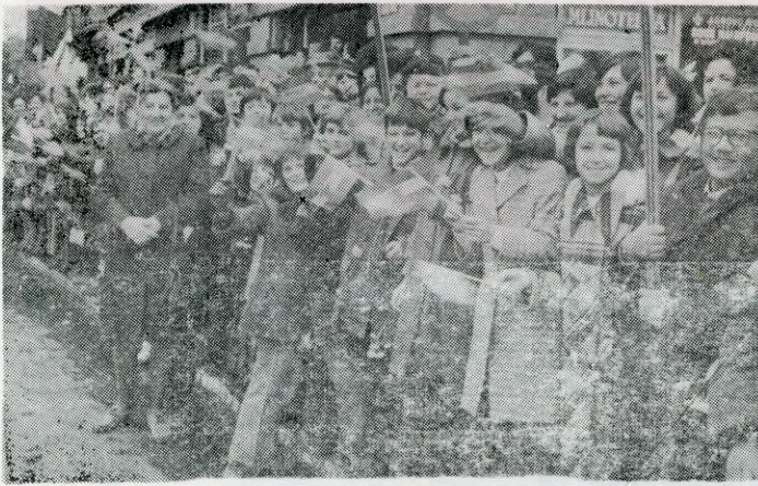
У очекивању председника Тита