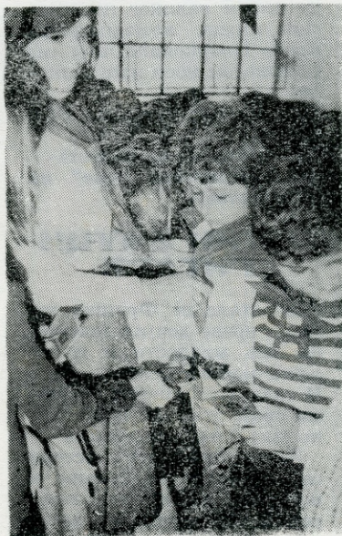
Везивање пионирске мараме