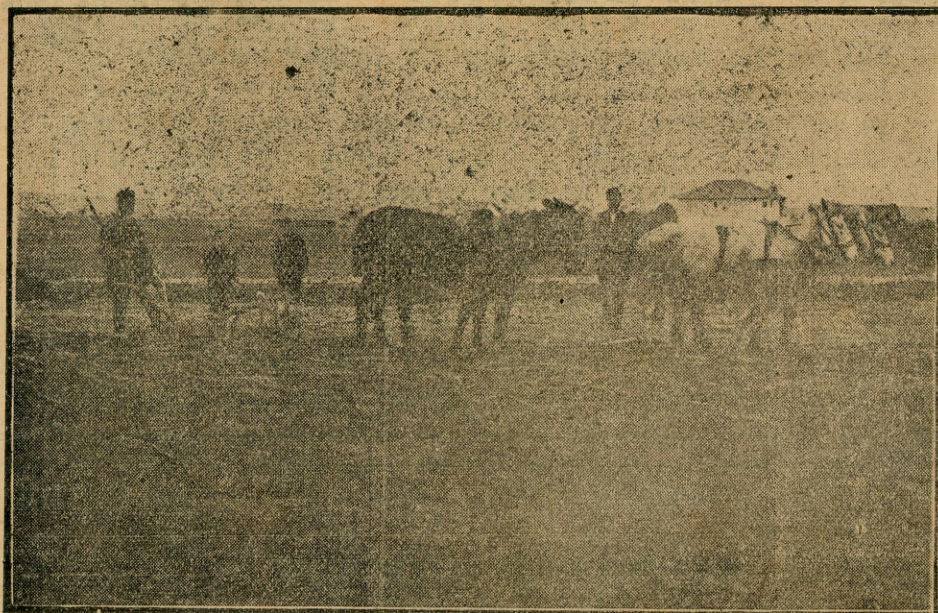
Први насељеници у Неродимљу прерабају Косовску ледину