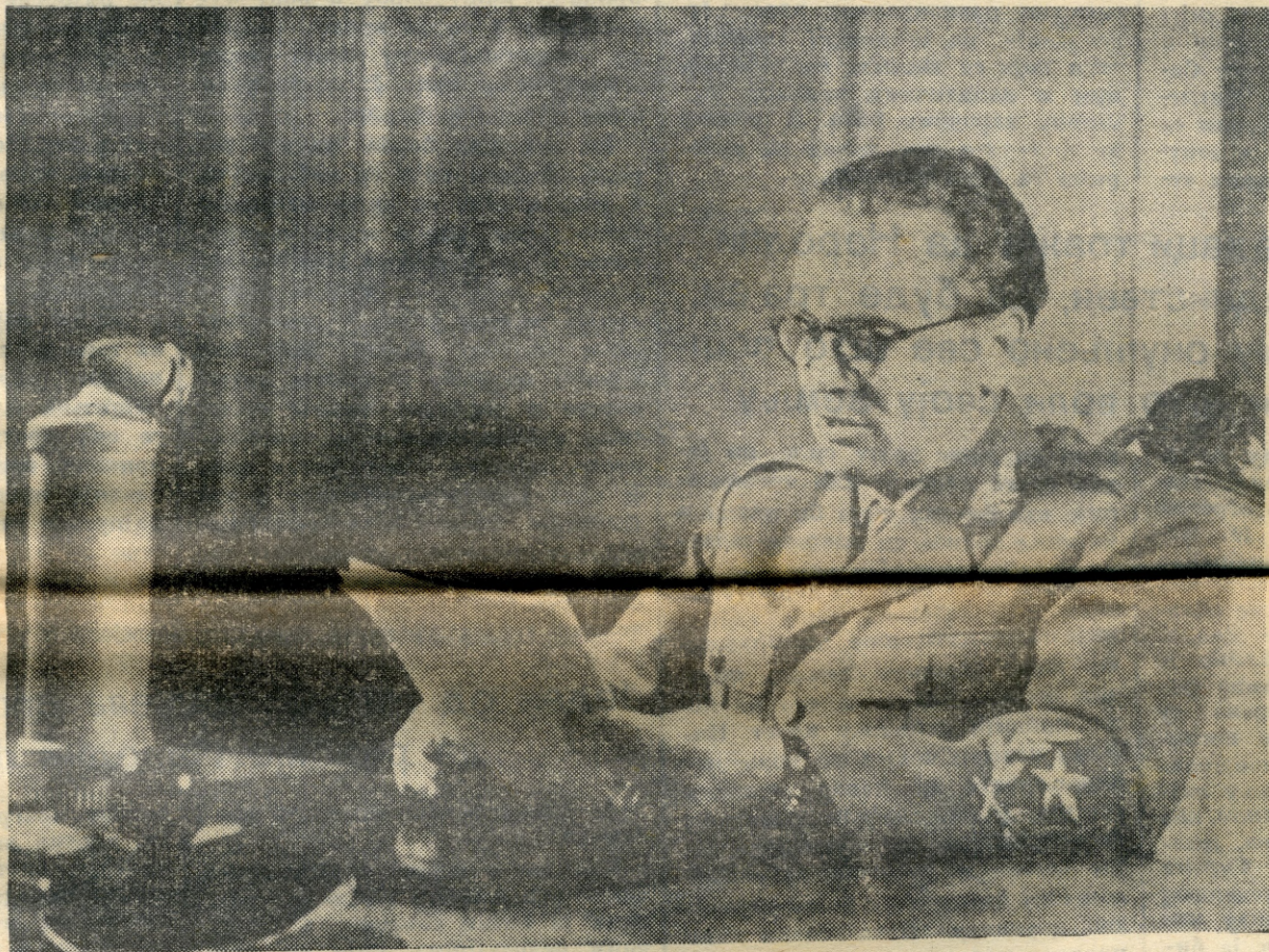
Маршал Тито пред микрофоном за време свог јучерашњег говора

Народно-ослободилачки фронт Југославије мора да се спреми за ове изборе са свом озбиљношћу, коју му диктира данашње стање