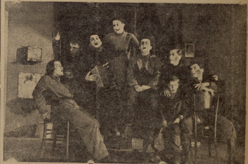
Која беше представена на тржествената академија во Народниот театар по случај 65 години от роденит ден на великиот Сталин.