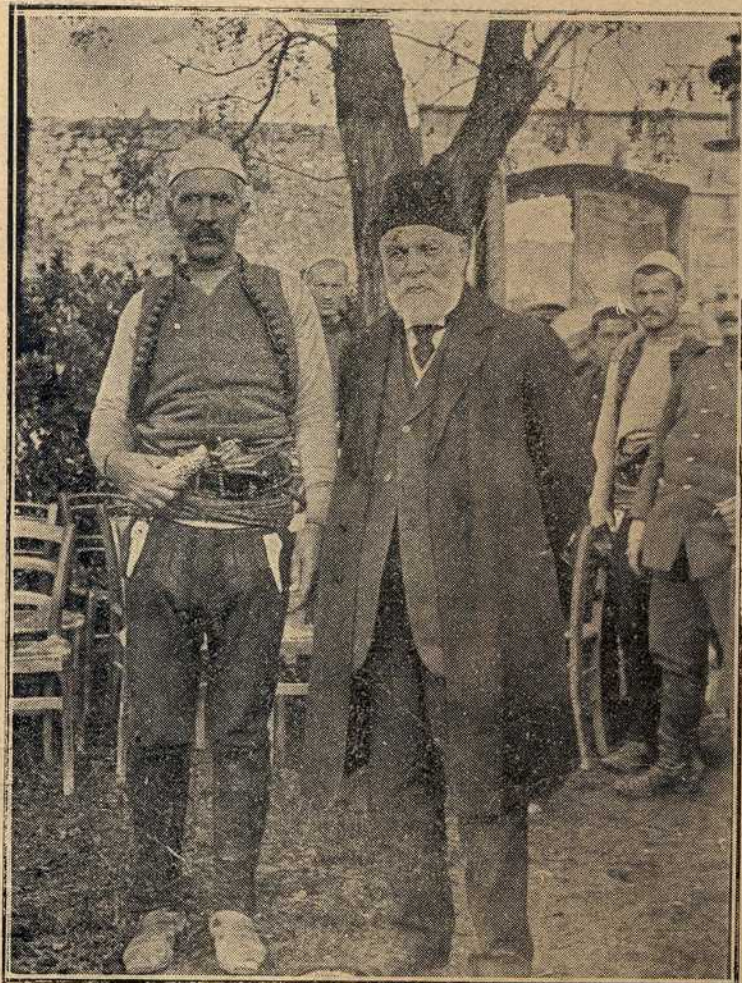
Иса Вољетинац и Исмаил Кемал-Беј