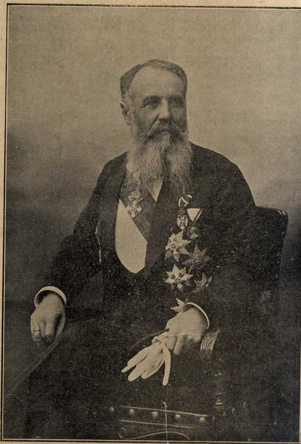
Творац Балканског Савеза НИКОЛА П. ПАШИЋ

Излази сваке недеље. Ванредно по потреби. — Претплата тромесечно два динара.