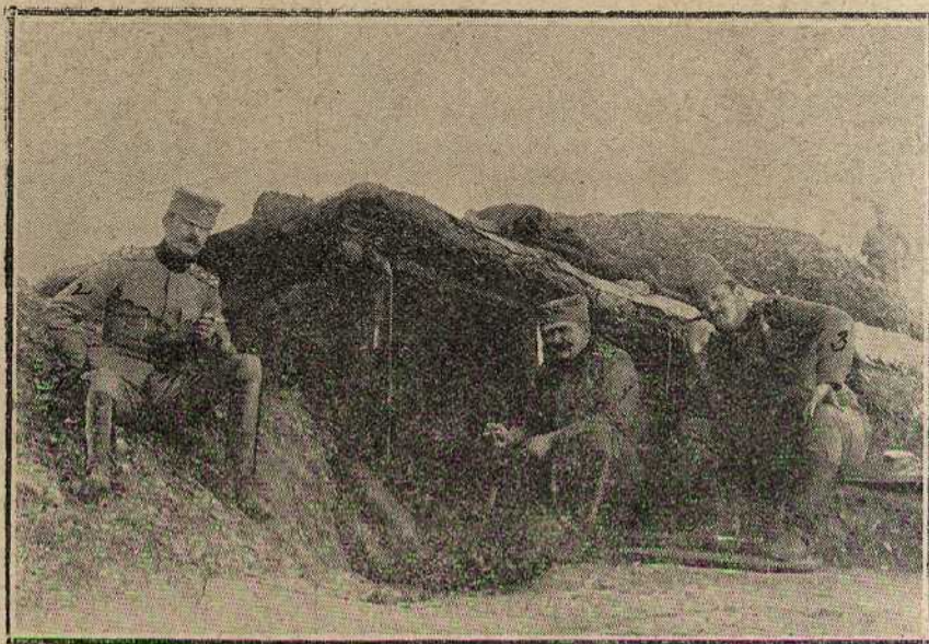
Наши у земуници под Једреном.

ги од њих своје кости оставили су тамо, а народ њихове гробове чува и пази с поштовањем и захвалношћу. Бомба је била најомиљеније оружје славних наших четника, са бомбама су они правили русвај у турским редовима, с њима су рушили све што им је сметало. У бомбе су имали највише поверења, јер су их сами пунили, па су звали, да их у најкритичнијем моменту издати неће. Наша слика на 42. страни представља момент, како комите сами себи граде бомбе у једној кровњари, у којој су сигурни од турске потере.