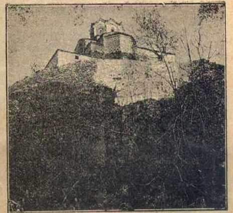
Из Нове Србије