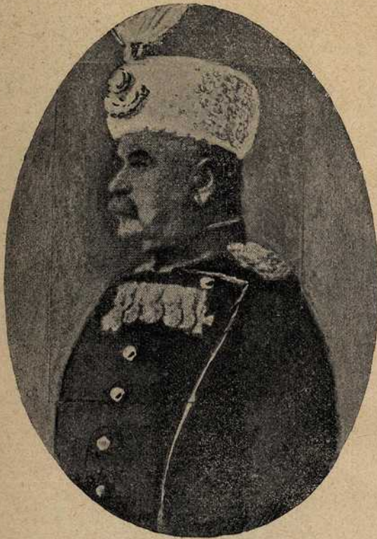
Генерал Степа Степановић КОМАНДАНТ ДРУГЕ СРПСКЕ АРМИЈЕ

Један од најпопуларнијих наших војсковођа је генерал Степа, који је у овом рату доживео ту част, да под своју команду добије и српске и бугарске трупе. С тимочком дивизијом одлично се показао у борби на Црном Врху. У овоме рату генерал Степа имао је за задатак, да чува Софију и да на Овчем Пљу пресече одступницу Турцима. Он је тај задатак извршио са пуно задовољство Врховне Команде, и заузео је са својим трупама Криву Паланку, Кратско, Кочана и Штип, одакле је упућен под Једрене.