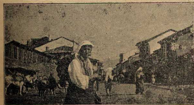
СТРУГА: НА ПАЗАРУ