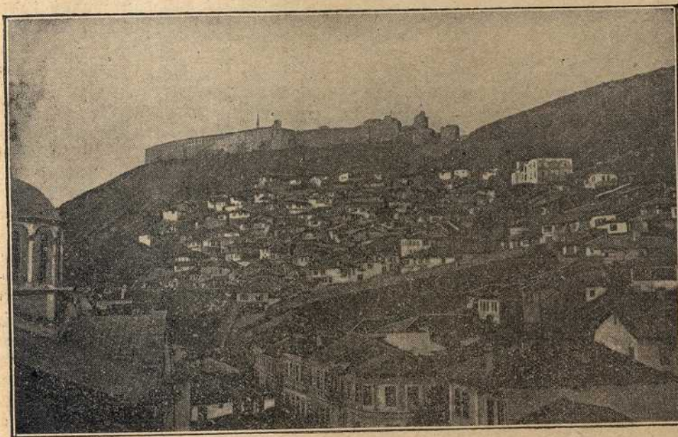
Душанов град у Призрену

Једино што имате весело у овој вароши то је Богом дану реку Бистрицу. Видите је какој хучи преко стена