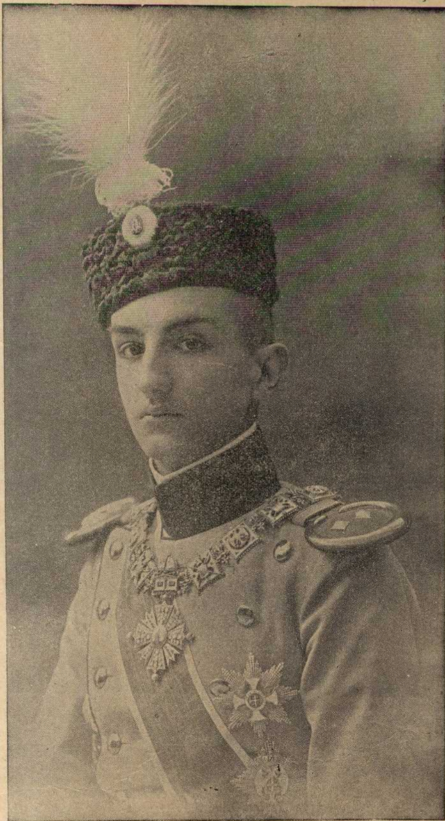
Њ. В. краљевић Ђорђе.

У Н И В Е Р З И Т Е Т С К А Б И Б Л И О Т Е К А