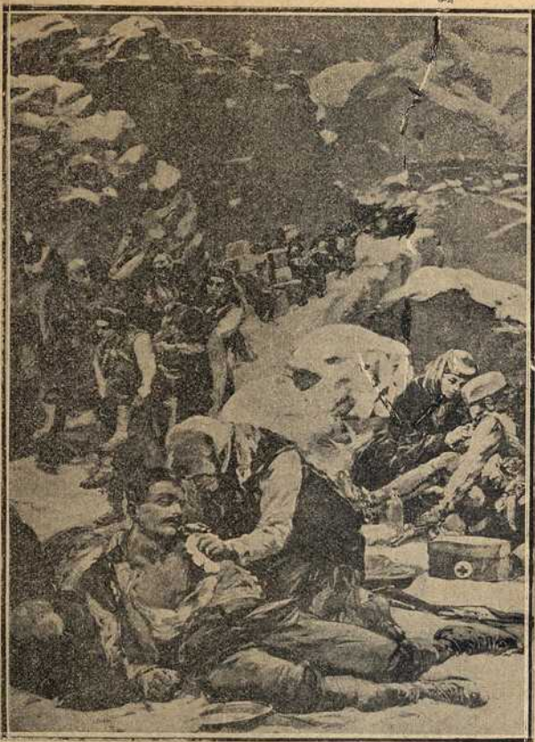
Црногорке на бојном пољу.