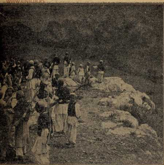
Арнаути у горама