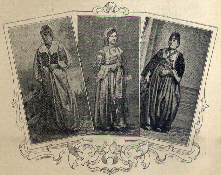
Наши нови поданици