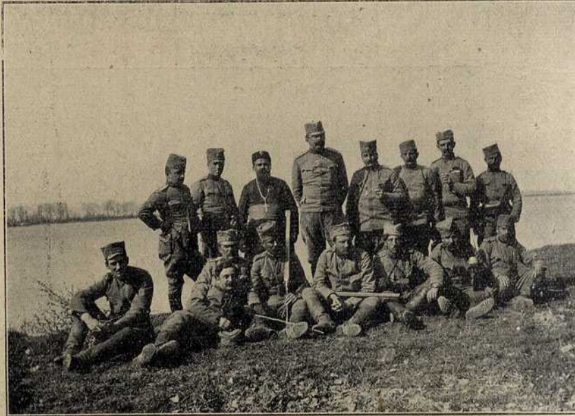
Одмор наших коњаника на обали Марице

Оца им рече две три поздравне речи, па и нехотично отпоче беседу на турском језику. Ми нисмо разумели беседу, али се постепено опажао њен силан утисак на турске официре, који постојаху све блеђи и блеђи. Настаде гробна тишина и само се чуо тих говор