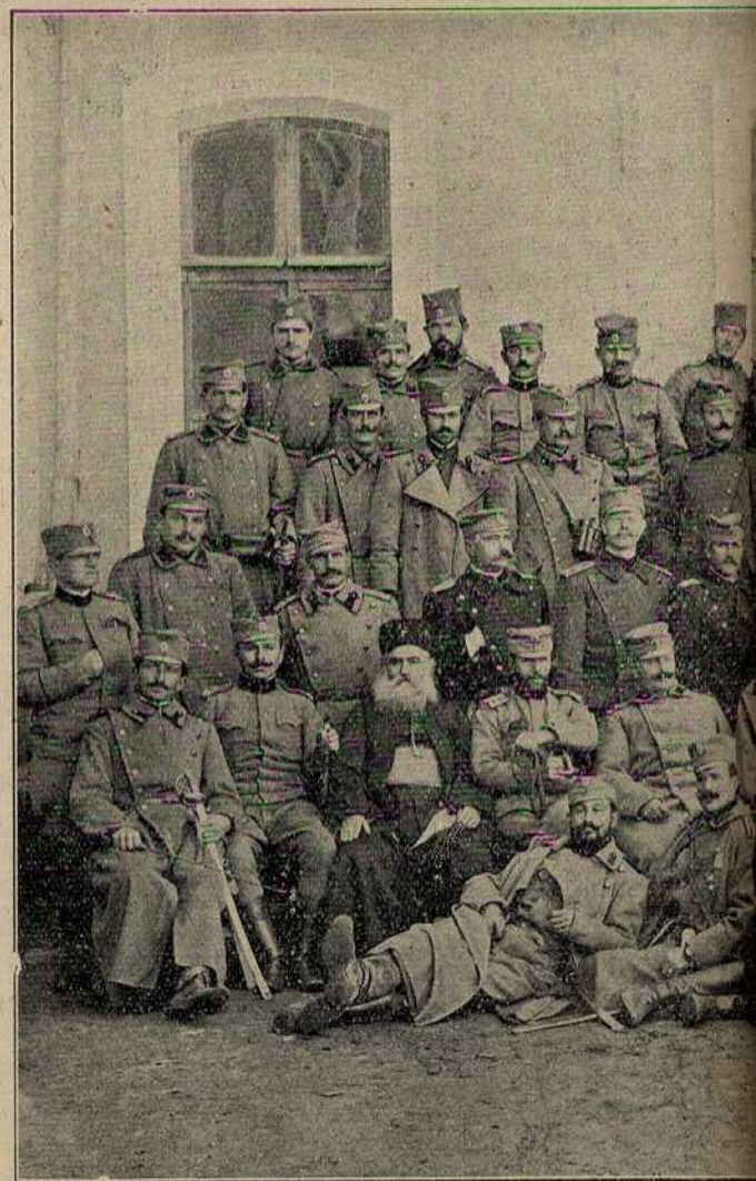
Официри I. пешадијског пука Књаза Милоша