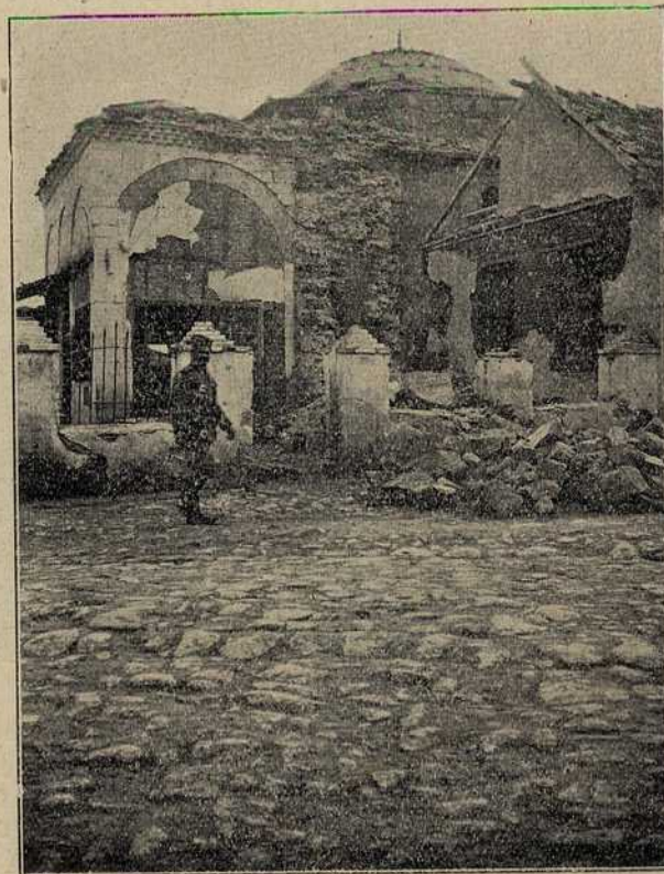
Куманово: разрушена џамија

Неописану радост у васколиком српском народу изазвао је глас да је победоносна српска војска без отпора ушла у Скопље и да је на гордом граду престонице Душана Силног развијена српска тробојка. Тек улазак српске војске у царско Скопље показао је значај и величину кумановске битке. За неколико дана српске власти увеле су у Скопљу потпун ред и законитост. Турци су били потиштени, јер је петвековно им царство пало, да се никад више у српским крајевима не поврати, али су у Срба нашли праведну заштиту и они новом стању, ако га и нису поздравили, нису супрот стали. Постали су мирни и лојални поданици Србије, која им је загарантовала равноправност. Наши војници у побеђеном Турчину не гледају више мрског непријатеља. Они су се с њима већ спријатељили и од њих ево пазаре, и Турци виде благородност српске душе и не ропћу но су се спокојно предали својој судбини, па тргују и даље.