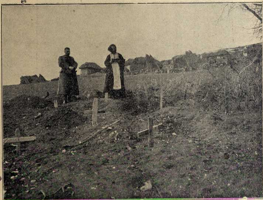
Јуначко Гробље на Нагоричину.

Наш народ слави успомену славних својих синова и веома поштује њихово вечно обитаваиште и ми смо сигурни, да ће ово сада по изгледу тако сиротињски бедно гробље ускоро бити украшено лепим каменим обележјем над многим хумкама, а диван је и нагоричинских хероја