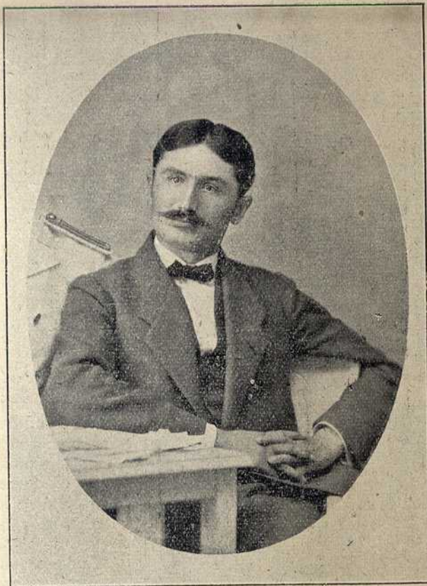
РЕЗЕРВНИ ПЕШАДИЈСКИ ПОТПОРУЧНИК