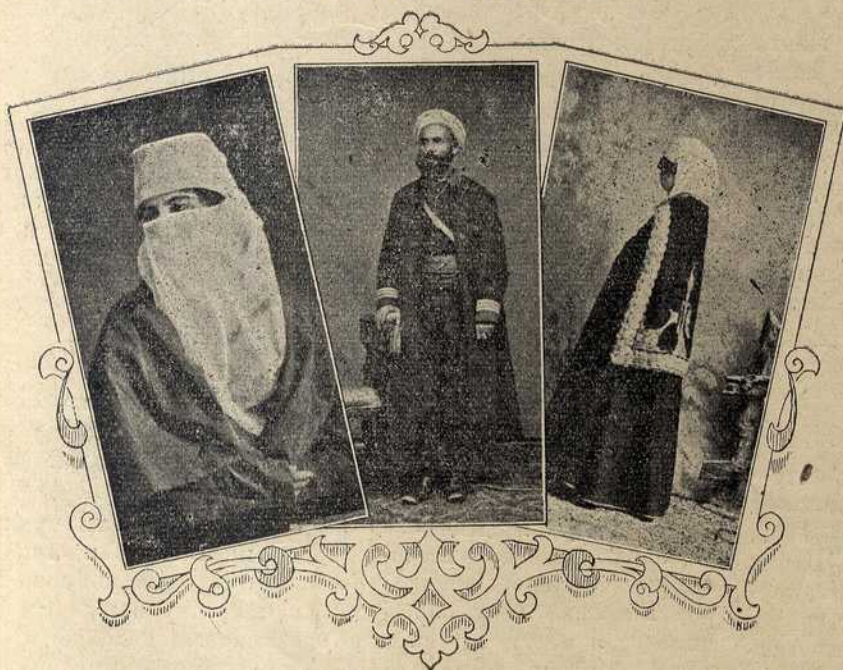
Наши нови поданици