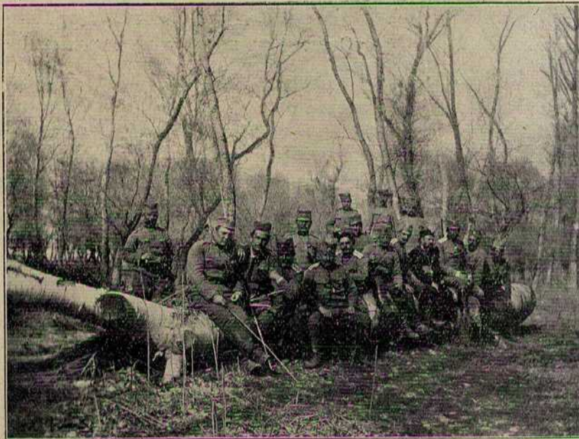
Наша коњаници на одмору под Једреном