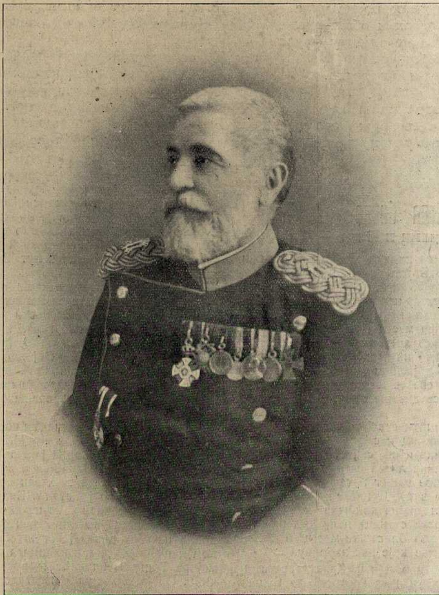
НАЧЕЛНИК ШТАБА ВРХОВНЕ КОМАНДЕ

Издаје сваке недеље. Ванредно по потреби. — Претплата тромесечно два динара.