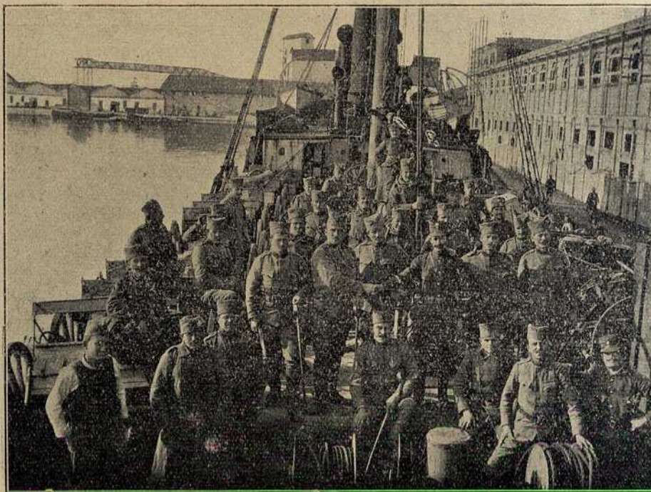
На потопљеној „Трифилији“.