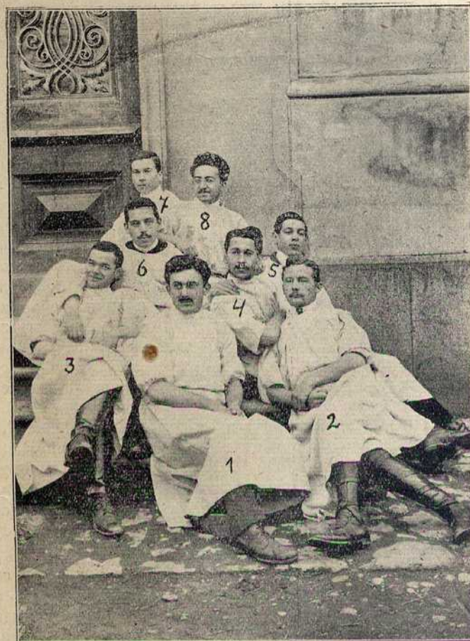
Група болничара — студената медицине — у војној болници у Нишу

На глас, да је Србија наредила мобилизацију целокупне своје убојне снаге сви наши студенти са стране, и ако нису војници, похитали су најбржим путем у отаџбину да јој своје знање и своју снагу ставе на расположење.