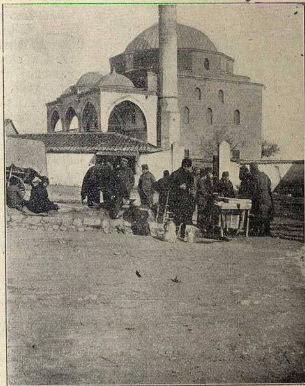
Скопље: сцена са улице пред џамијом