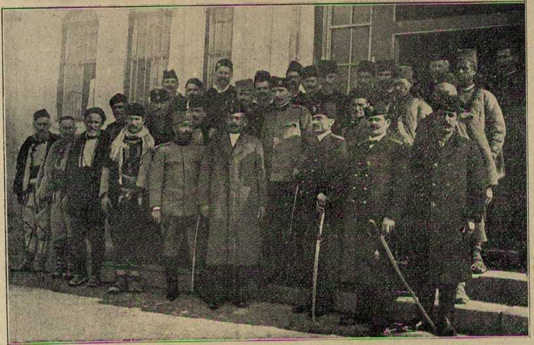
Прво народно представништво у Скопљу