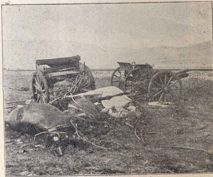
Уништена турска батерија на Куманову.

вучени из блата и одвучени у Куманово. Четврта слика приказује читав низ отетих турских топова, који су уређени у порти лепе, нове српске православне цркве у Куманову, која се на овој слици врло лепо види. Ти су топови сви исправни и већ су дејствовали у рукама наших артиљераца под Скадром.