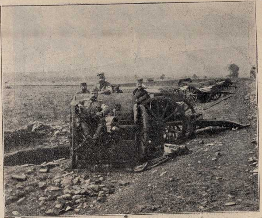
Напуштене турске батерије на Куманову.