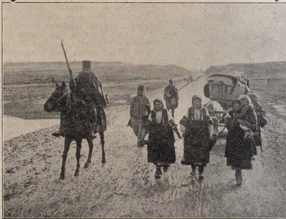
Ослобођена Србадија сербез језди друмом, на коме се под Турцима није смело ни појавити.

метара. Ни сад не знам шта је било теже: да ли пентрање уз њега, да ли спуштање низ њега, до у долину Душ. Од 5 и по часова настало је спуштање, односно претурање по путу, који су брдски потоци серпентинасто правили. Мислили смо да никад неће бити крај овом — вратоломном спуштању, као да се спуштамо у утробу земље. Тек у 10 часова ноћу, стигли смо на једну безшумну камениту узину. Ту смо направили ватре од већиног трња и прокадили се целу ноћ. Чим смо се пробудили, видели смо мало даље, лепо пошумљен предео, са дивним ливадама, где би се царски могло заноћити, кад већ нисмо остали на величанственом врху на шумовитој пуној пашњака висоравни — на Души. Али пошто се то није знало, а морали смо што пре завршити пролаз кроз Албанију и ушавши у Сан Ђовани ди Медиа свршити са задатком, који је у овом рату имала наша дична дринска дивизија II. позива, пошли смо и одатле.