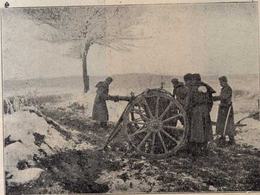
Српски топови дејствују против арнаутских зликоваца.