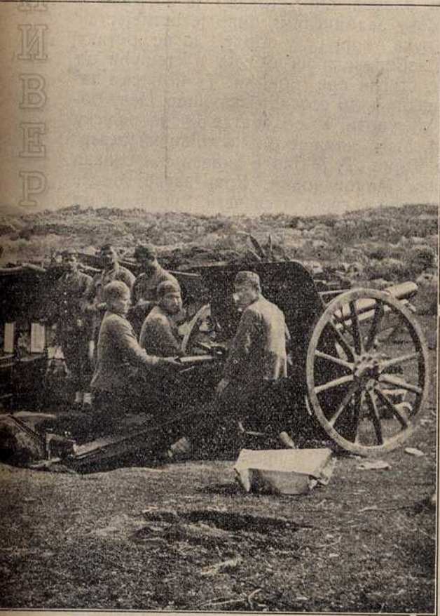
командом на позицији Меси.

Гори дала већи број заплених од Турака и горско људство под командом српских офи- цијера под Сквадром на позицији Меси, која је ише Ђубишића и Турцима задала много јада.