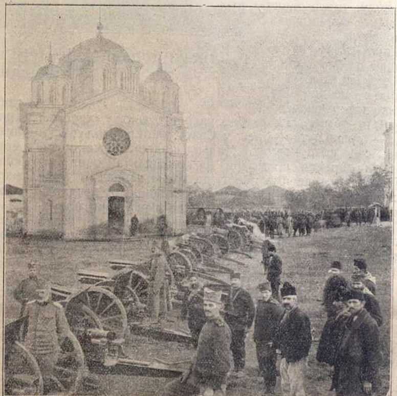
Заплени турски топови на Куманову у порти Кумановске Цркве.