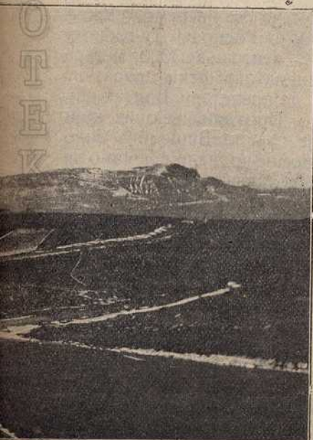
на Младом Нагоричину: Центар са турских положаја.