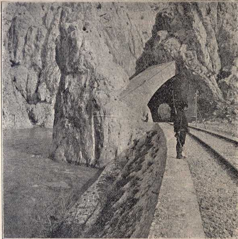
Наш стражар из трећег позива пред тунелом код Демир Капије