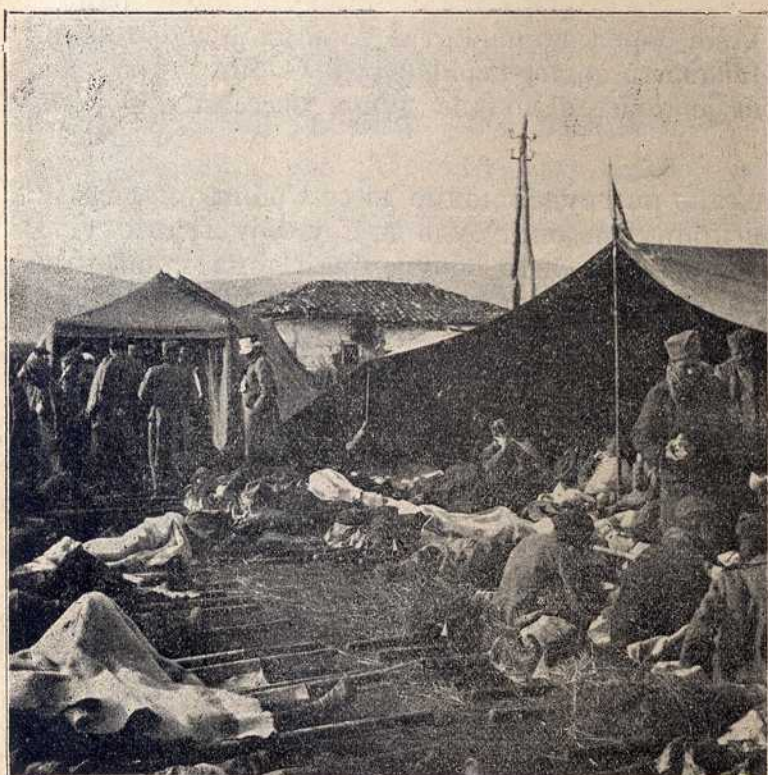
Првијалиште друге пољске болнице између Табановца и Нагоричина.