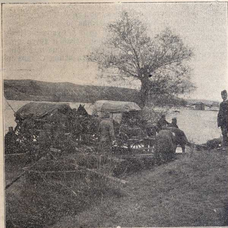
Прелазак српске војске преко Вардара.

Прву страну данашњег броја украшујемо ликом једног од најзаслужнијих војсковођа за сјајну кумановску победу, онда команданта дунавске дивизије, а данас министра војног генерала Божановића, који се са својом дивизијом исто тако одлично показао и на Битољу, о чему смо опширно писали у опису Битољске битке. Генерал Божановић је по свршеној гимназији у којој се навек истицао као један од најбољих и најразборитијих ђака, ступио 1882. године у Војну Академију са 15. класом. Међу првима у рангу произведен је за потпоручника пред саму објаву српско-бугарског рата, у коме се одликовао. Доцније је као инжињерски официр заузимао разне команде свог рода оружја, у коме је важио као један од најспремнијих стручњака. Последњих година напустио је стручне инжињерске по-