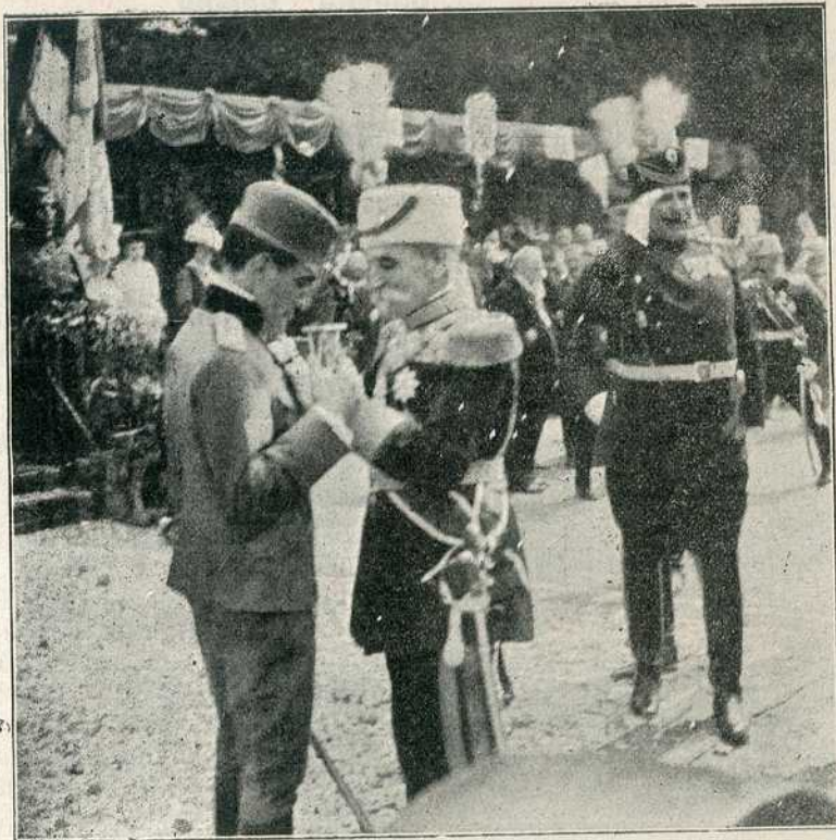
Њ. В. Краљ Петар лично на груди Престолонаследника Александра при- дева златну медаљу за храброст