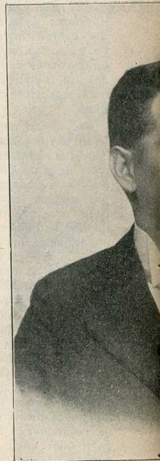
Резервни по Проф. Подлегао р