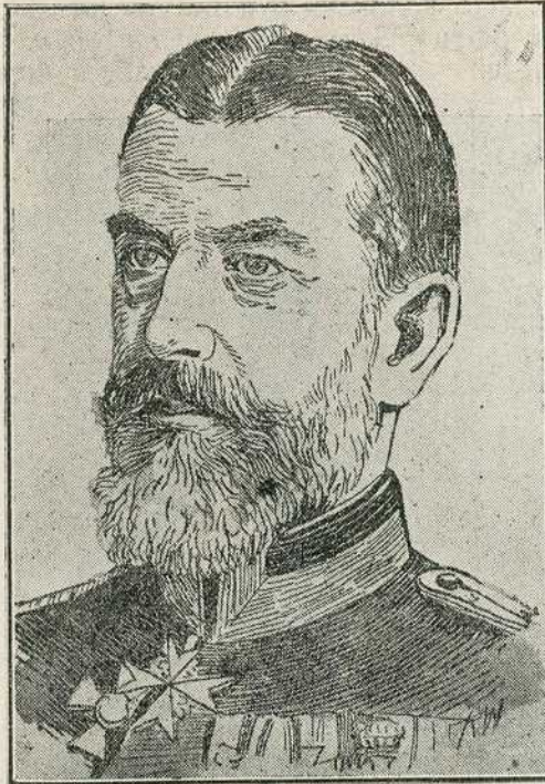
Њ. В. Краљ Карол румунски