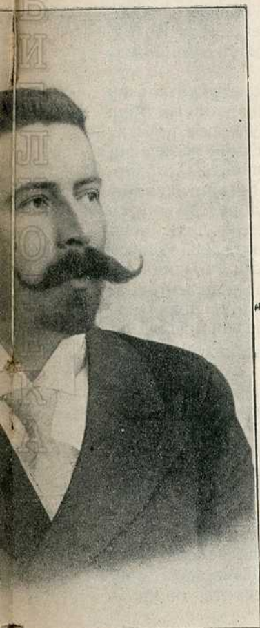
ешадјески капетан Живојин Хаџић ратним тегобама.