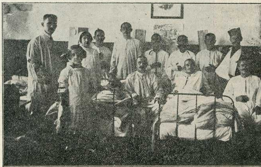
Једна соба у болници Кола Српских Сестара.