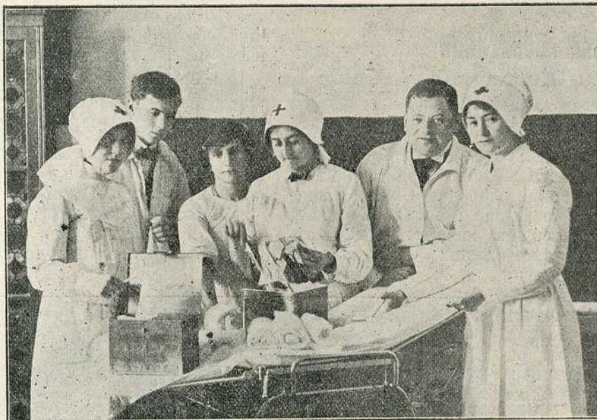
Операциона сала болнице Кола Српских Сестара.

Жена у вароши била је такође свесна великог времена у коме живимо и трудила се, да по својим силама, допринесе свој обол за свето дело на коме је сарађивало све што се српским именом поноси. Жене у вароши