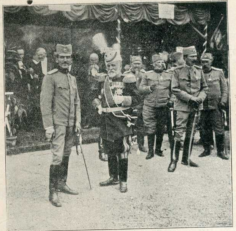
Престолонаследник Александар, Војвода Путник и Ђенерал Петар Војовић