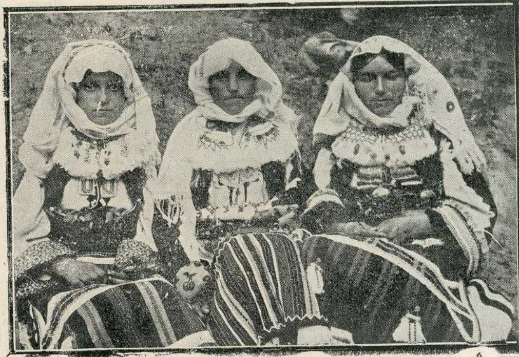
Српкиње сељанке из околине Скопља.