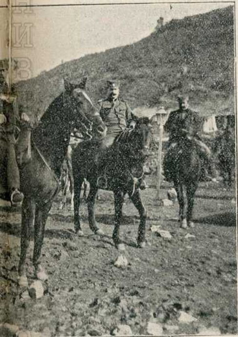
командант вјеске против Арнаута