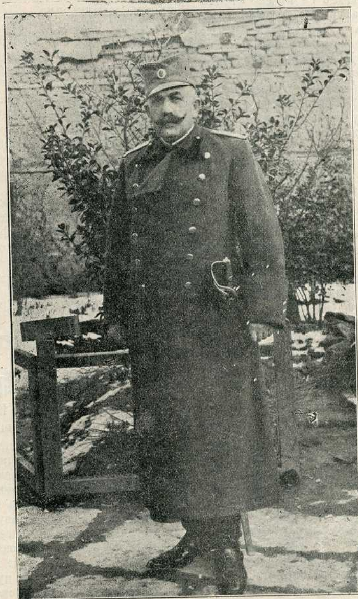
Генералштабни пуковник Божидар Терзић КОМАНДАНТ ШУМАДИЈСКЕ ДИВИЗИЈЕ