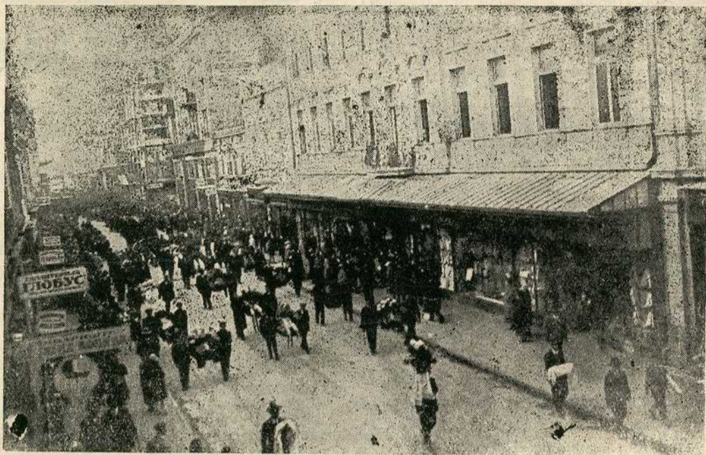
Спровод у Кнез Михајловој улици

Настањен, од доласка у Београд, у Савамали, он се још првих дана са посвећује њеном добру и напретку, ради чега га савамалци у знак при-