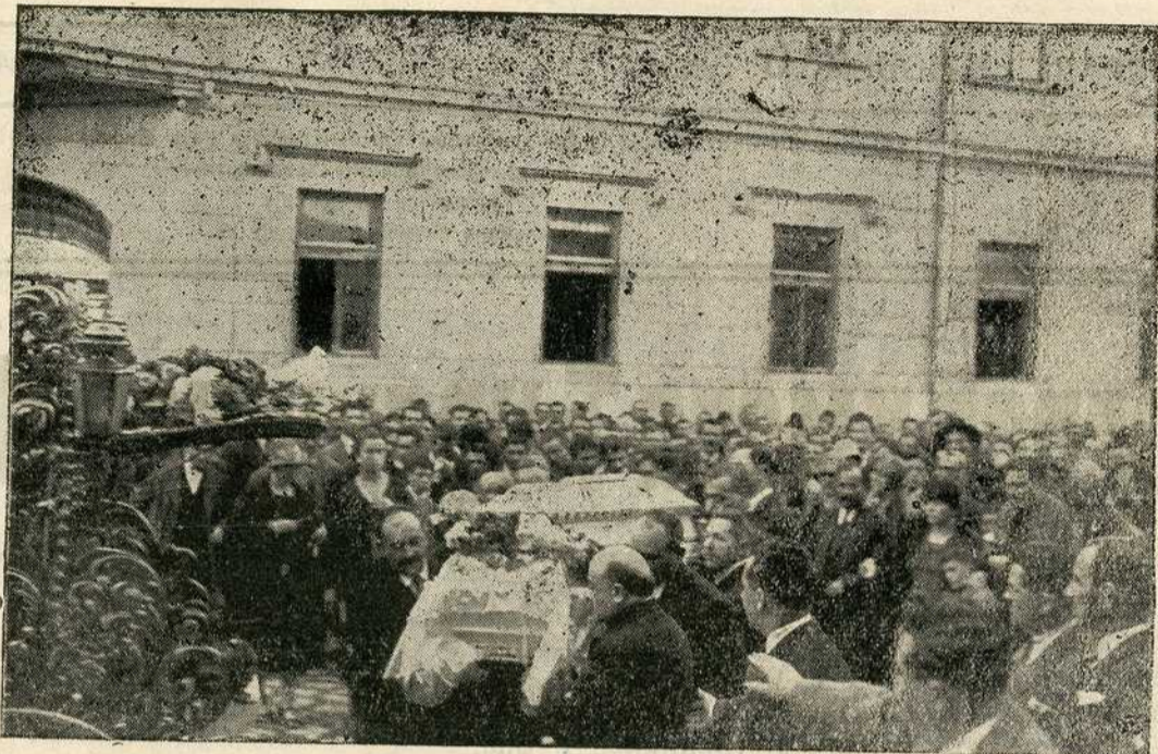
Председник г. Кумануди са члановима Суда уносе ковчег у Саборну Цркву.

Нарочито је запажено присуство г. Љубе Давидовића и министра просвете г. Милана Грола.