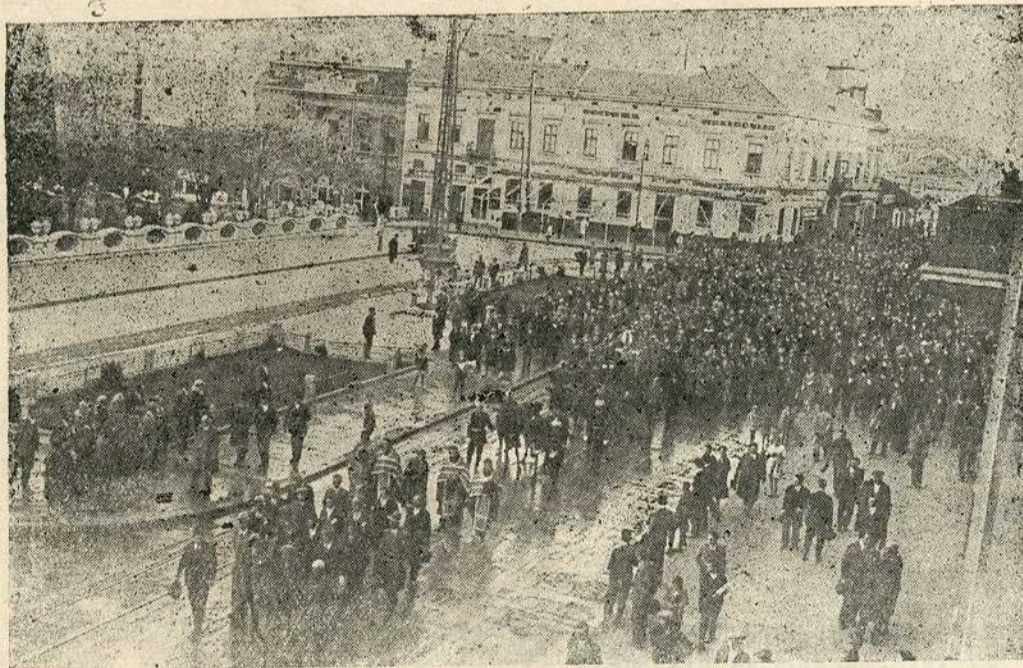
Спровод на Академском Тргу

После тежног дневног посла, за исхрану жене и дечице, млади је столар проводио ноћи у читању и конферисању са пријатељима, да би раног јутра у својој радионици спремао нов хлеб и то не само за своје и себе већ и за све невољне тога краја.