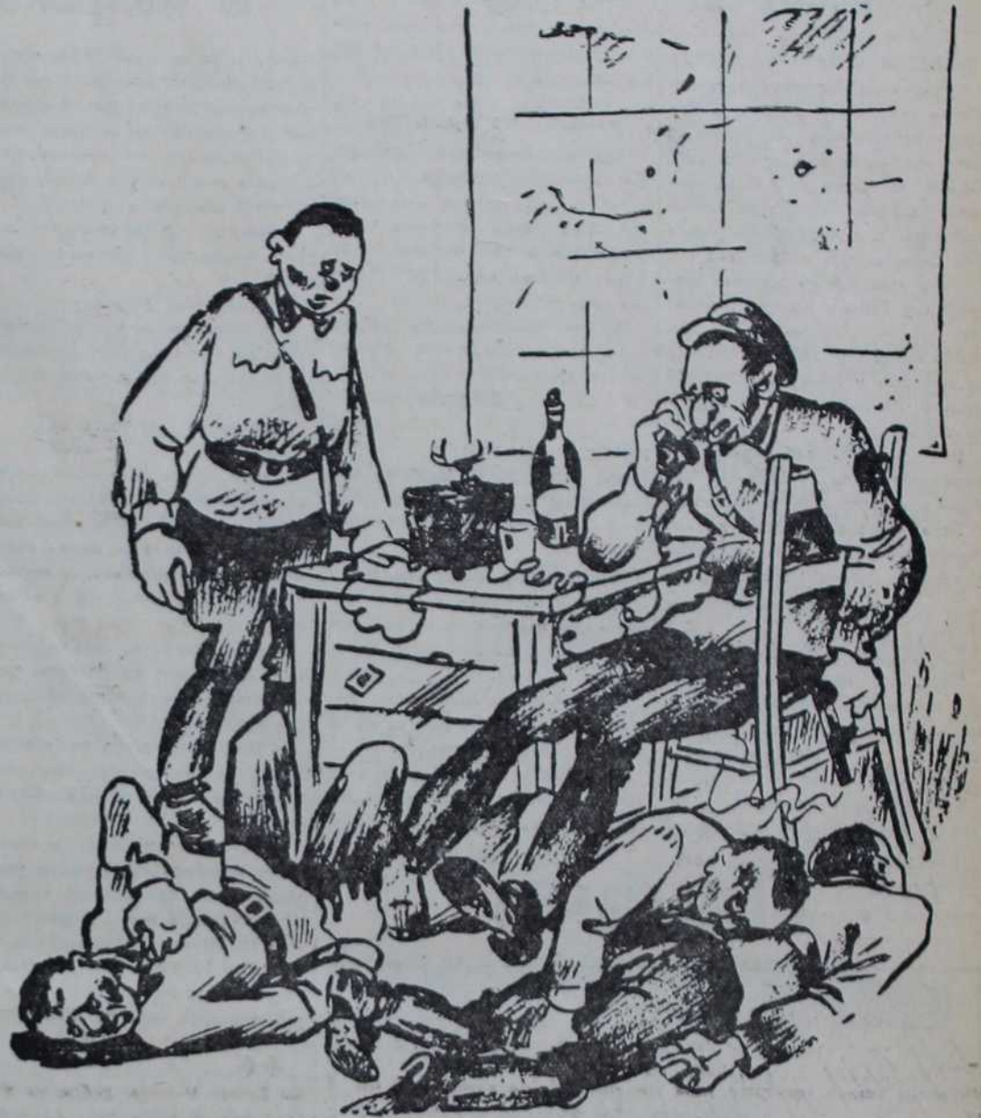
— Друзе Стаљине, ја поправљам ситуацију. Пошаљи ми 4 нова генерала.