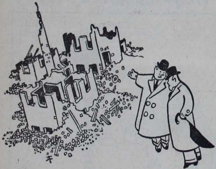
— Ово је моја фабрика! — Моја је грађена у истом стилу.