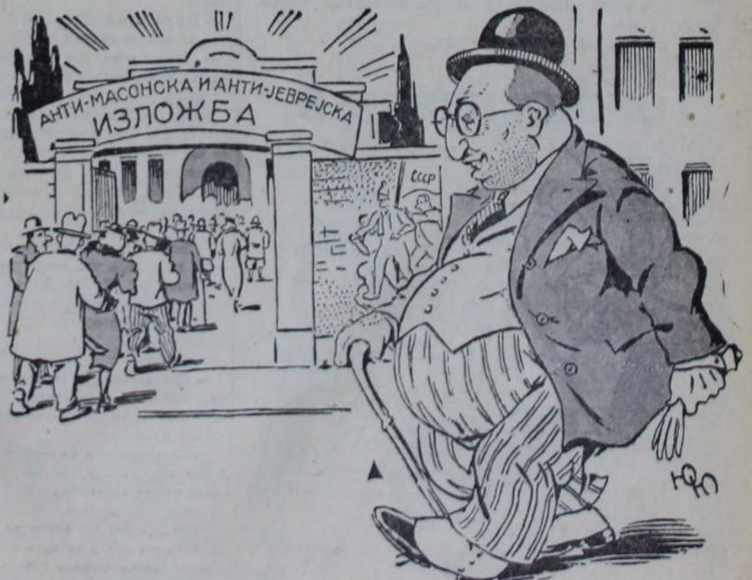
— Видим ја да ме моји Бесгрђанци инсу заборавили...

На антимасонској изложби налази се соба за рад Геце Конга