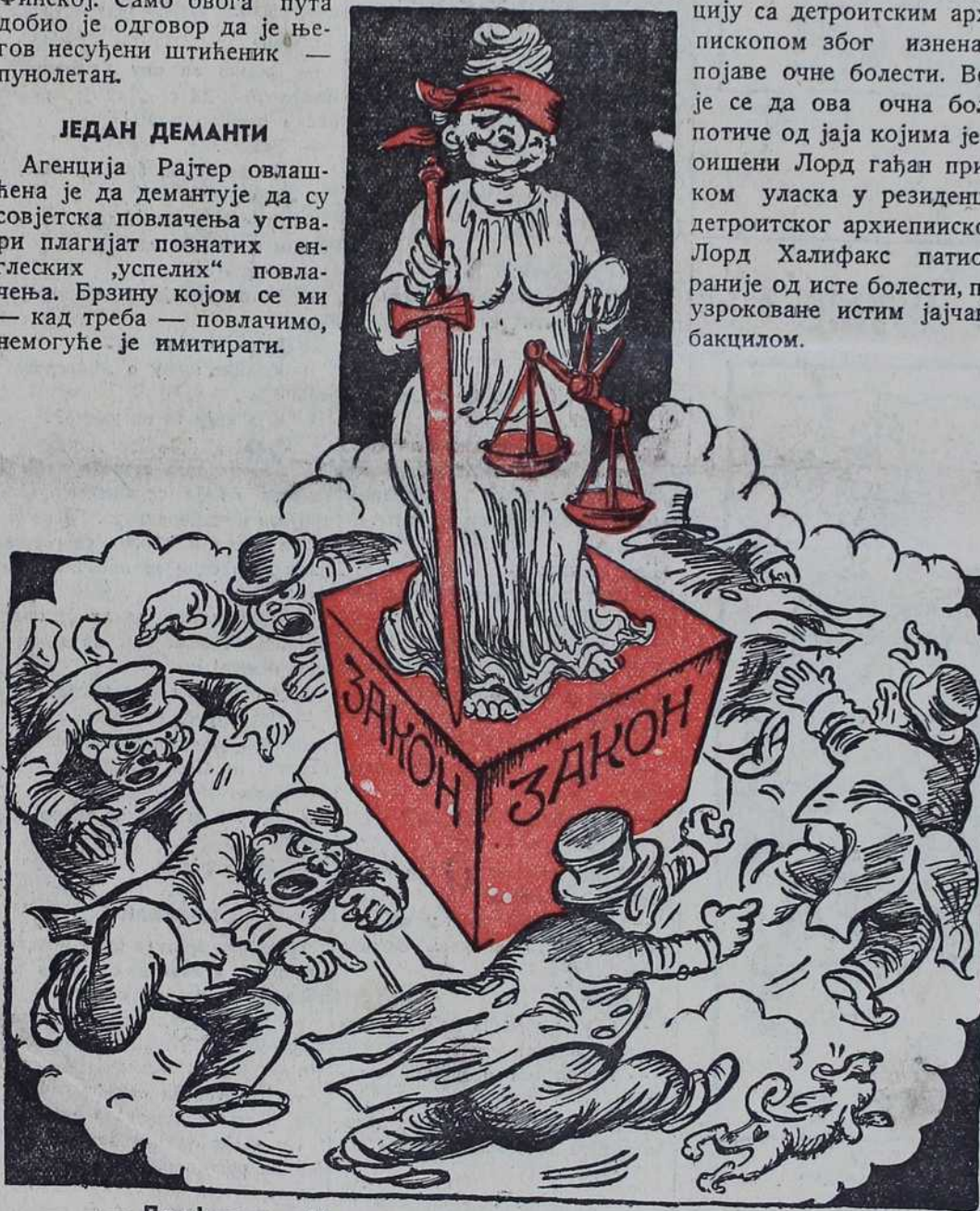
— Држ' лопова !! ...