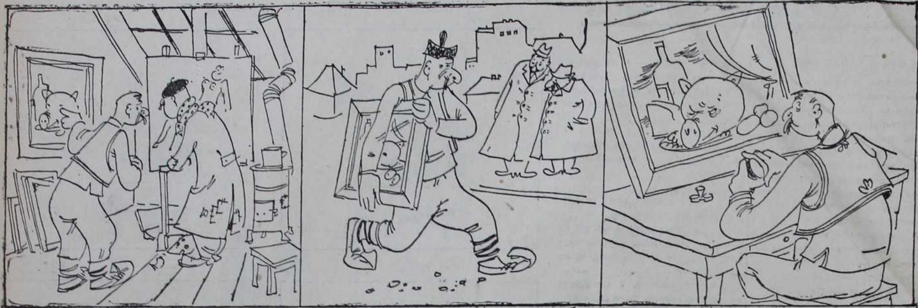
Равајло се сналази — нано зна