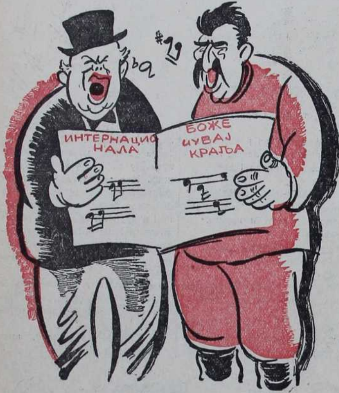
— Ма, опет нам нешто не ештимујес.