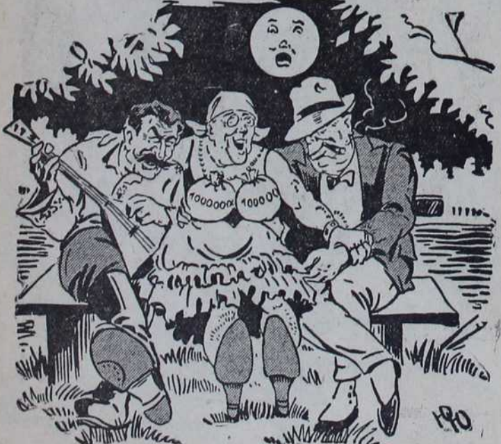
...али не од Бетовена.