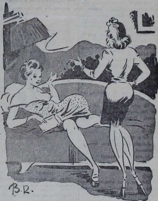
— И онда сам му енергично рекла, да га не желим више видети.