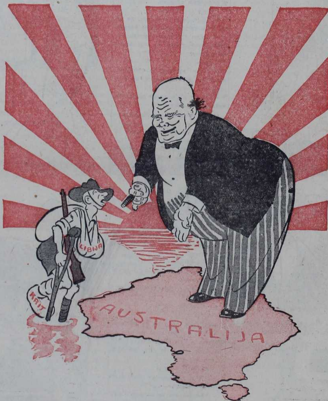
Черчил: — Драги пријатељу, пошто си толико ватрено желео да браниш своју земљу, ето, сада ти пружам могућност...

Адвокат: — Да вас суд не би исувише строго осудио, потребно је да вас огласимо за лудог.