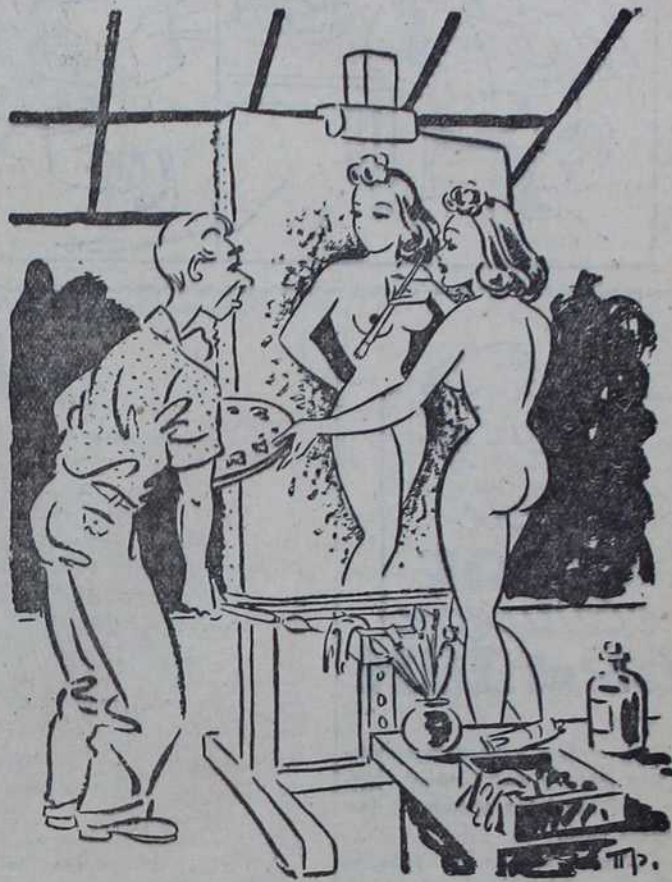
— Уста ћу ја сама насликати, ви се у то не разумете.