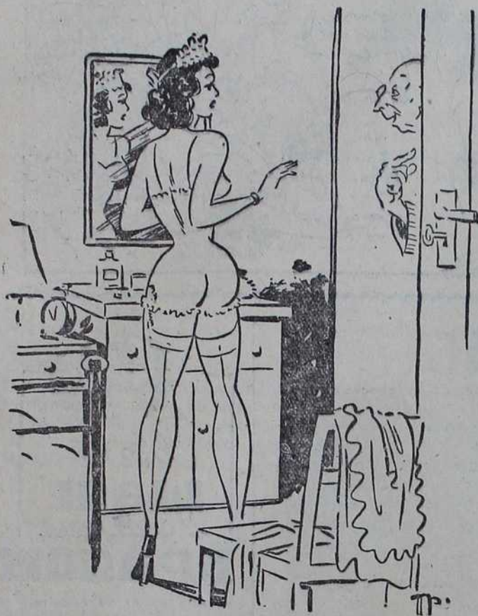
— Да ли сте ви звонили, Катице!

Муж: — Опрости ми, молим те, ако сам те прекинуо у говору.