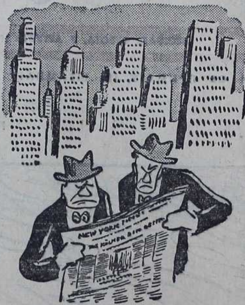
— Јесте, да ми рушимо старе римске цркве, али то ми чинимо само зато да изградимо модерне облакодере у нашем америчком стилу.

Јер када потроши и последњу снагу Ови компаноци послаће га к' врагу Јер њима не треба аждаја из Кремља Већ срушена, гола и пропала земља Па ће онда своју диктирату вољу А место Стаљина набавиће шмољу А Стаљин то види, али шта му вреди Кад је у невољи и великој беди Бољшевицима давно већ је пала трола Он се упрегао у јеврејска кола.