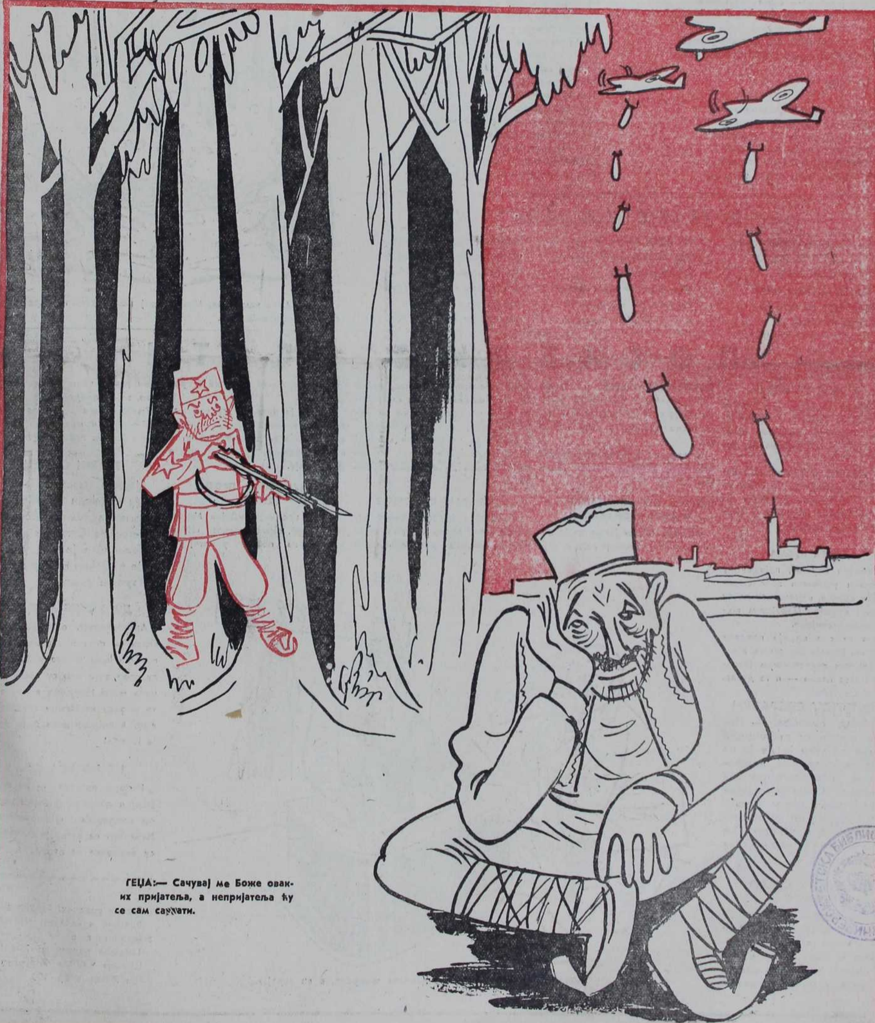
ГЕЏА:— Сачувај ме Боже овак- их пријатеља, а непријатеља ћу се сам сачувати.