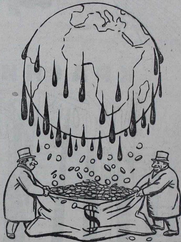
— Алал нам вера, Мошо! Овај наш систем да претварамо сузе у злато није лош.