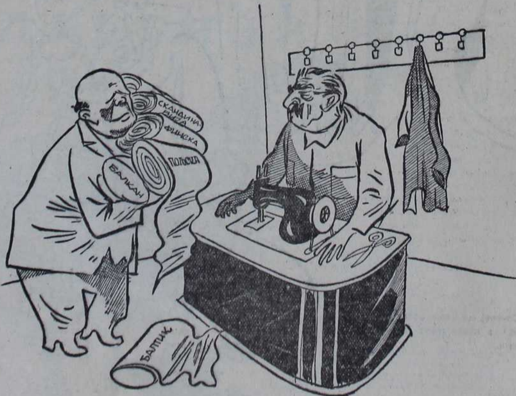
ЧЕРЧИЛ: — Ја вам мајсторе донесох штофове, а ви скројте.

Њујорк, октобра. — На њујоршкој и лондонској берзи хартије од вредности »Неутралност — Лимитед« не котирају се више па су оглашене за неважеће.