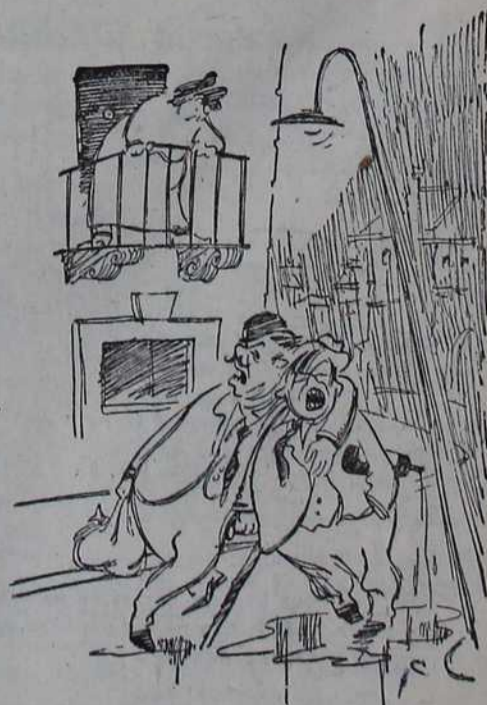
— Госпођо, ко је од нас двојице ваш муж!