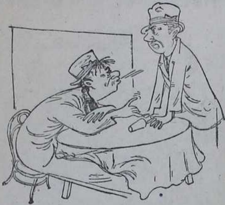
— Како, зар ти претседник трезвењачке лиге, па пијеш! — Знаш, ја сам сада на отсуству!