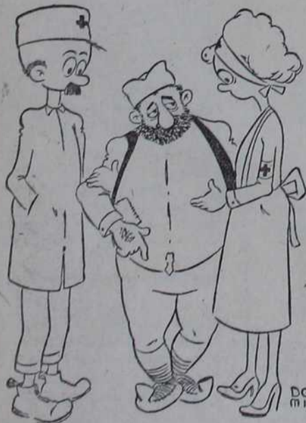
— Имате ли пицалу! — Не, већ запалење слепог црева!