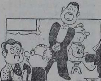
— Његов глас је једино ње- гово имање. — Ако, сиромаштво није мана.

тако је свуда Само мој тата није Тео да тлипи зато сад сам кува луцак и пеле судове јелбо ниједна девојка неце да остане код нас, због тате ето свуда за- вуце нос и у све се мес а блате код нас долазе много гости Па сад када је зима тлеба да се ци- сте две собе и лозе две фулуне а то је много теско јелбо мола да буде топло а длва мола да се стед е па нико не може да удеси јелбо се Тата после деле ко луд и казе да неко кладе