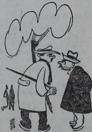
— Јеси ли чуо да Ђокица ви- ше не пије! — Шта кажеш! А кад је умро!