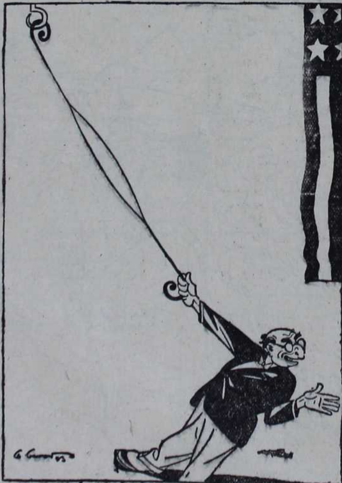
— Видите господине председниче, како је параграф растегљив.