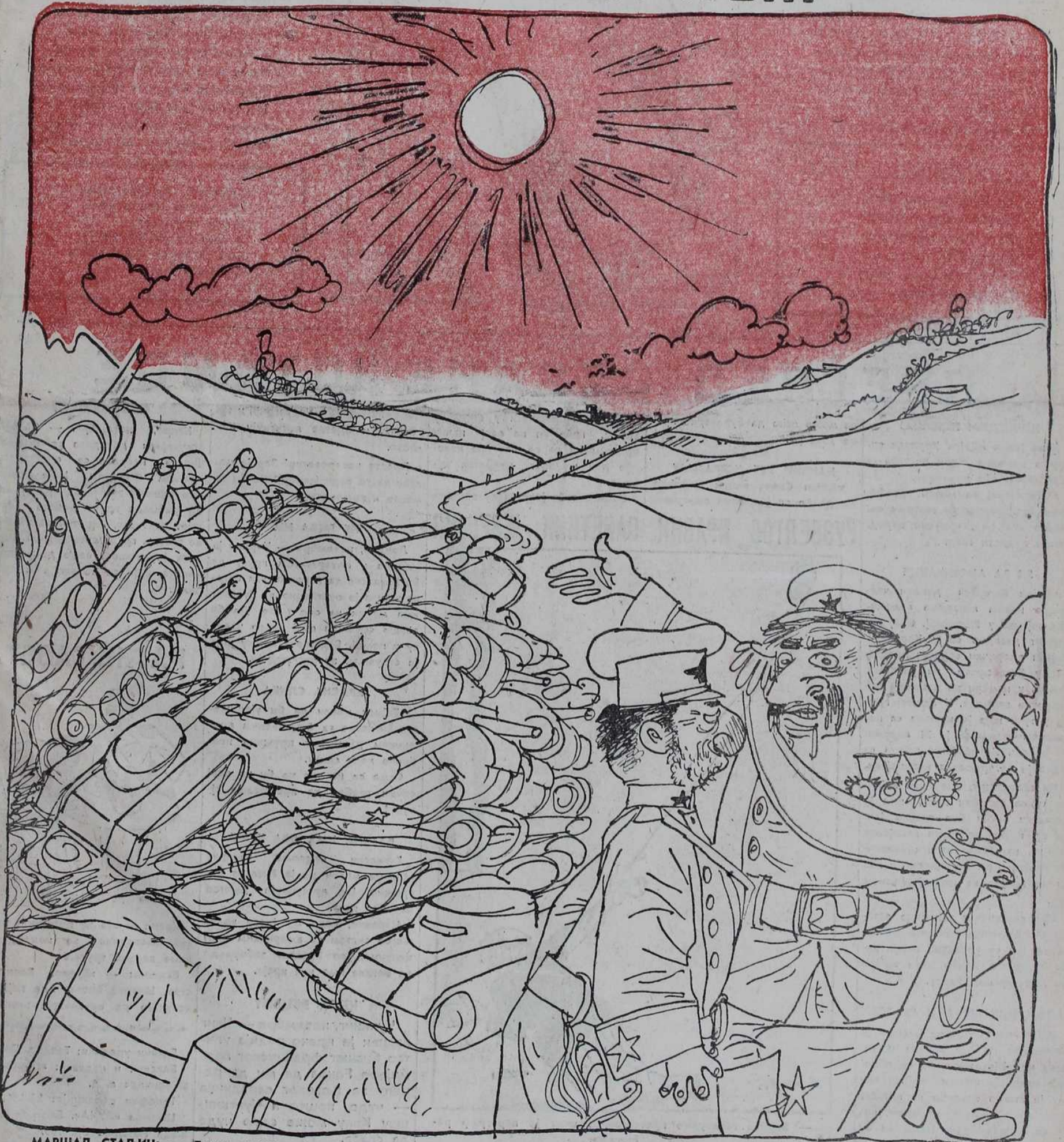
МАРШАЛ СТАЉИН: — Друзе генерале, ја сам вам дао на расположење 34 стрељачке дивизије и 6 оклопних бригада, да ми на аутостради код Смоленска отворите »пут према Западу«, а ви затвористе пут. — А, извините, друже Стаљине, то нисам ја урадио, него они преко...