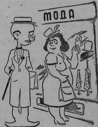
— Драги, Тошо, шта да ти ку- пим за рођен-дан! — Ништа, душице; немам но- ваца.