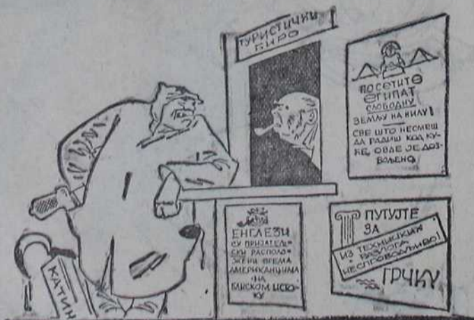
— Дај ми једну карту за Алжир! — Тамо и натраг! — Не, само тамо, пошто тамо и остајем.