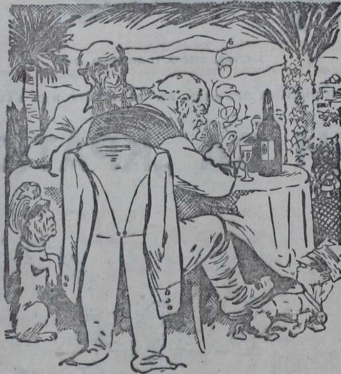
— И постали досадни просјаци з италијанским столом.

У престоном граду Персије, на брегу Где се разне гује и акрепи легу Где је многом краљу натопљена земља Рандеву заказа диктатор из Кремља Черчила је позва по бежичној траци А Рузвелт је дошо на дрвеној штаци Састали се тајно, ал без резултата Од подвале сваки плашио се бата Па кад видли да се сложити не могу За идуће лето одложили слогу А свету су рекли да је све у реду Време је да они један другог једу Све се свело на то да су та летења Требала да буду због личног виђења Јер Рузвелт је до сад, по старој навици Стаљина видео — ал само на спици И тако је било цабе подворење Није им помогло ни лично виђење Тек ће сад настати из потаје врење Међу ортацима наступиће трење Код овог састанка велика је мана Што слога не рађа усред Техерана.