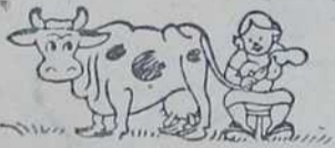
— Од срца