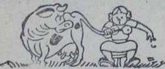
— Скоро ни мало