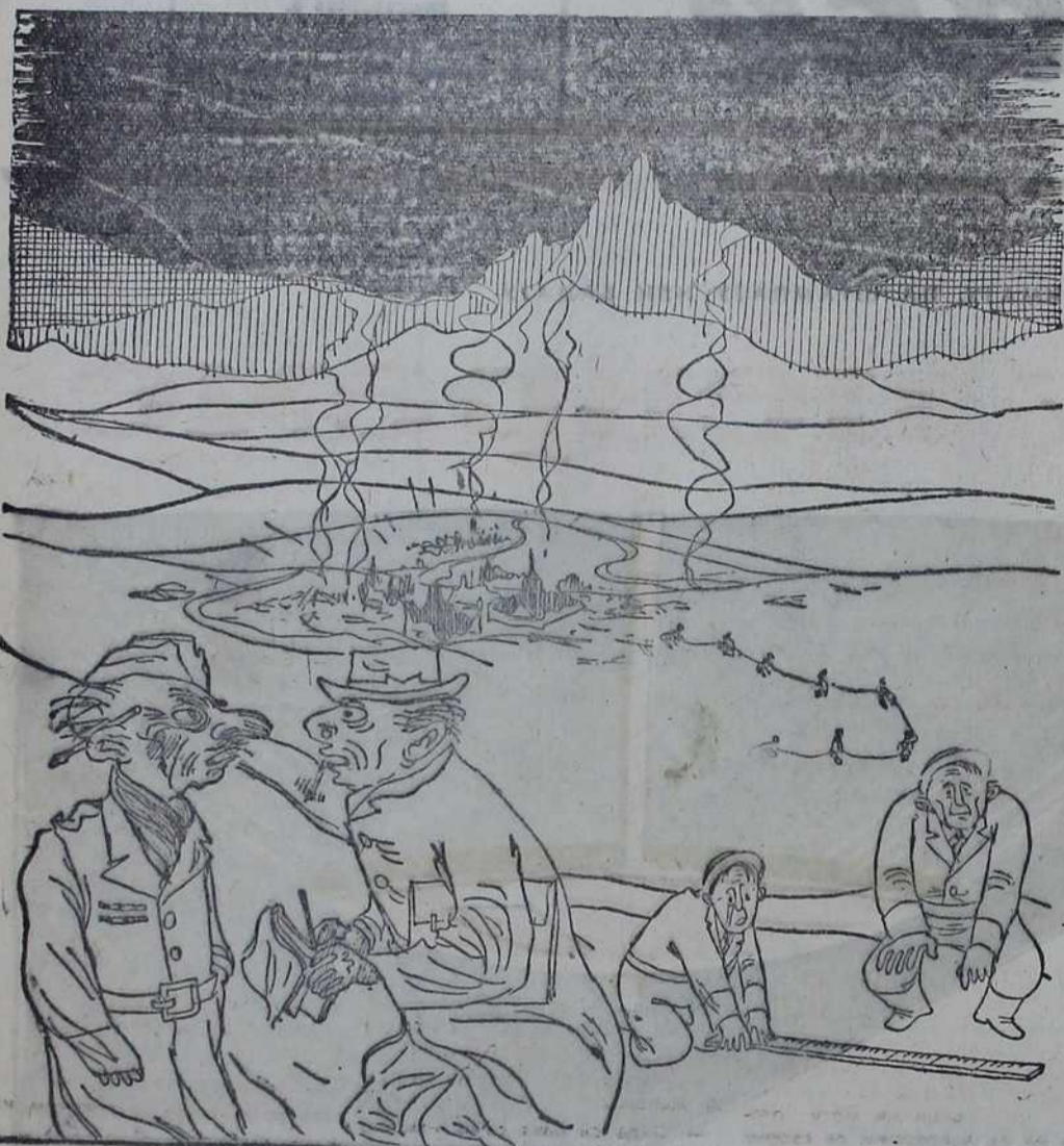
ДОПИСНИК «ДЕЈЛИ МЕЈЛА»: — Генерале смем ли знати, колико је ваше напредовање ових дана! АМЕРИЧКИ ГЕНЕРАЛ: — Сто педесет и три сантиметра.