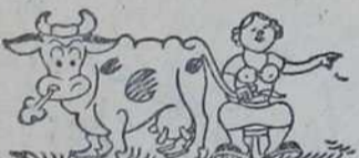
— И сувише мало