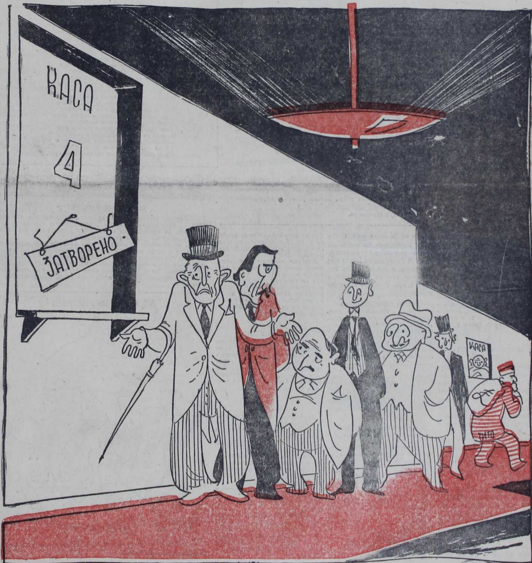
ПУРИЋ: — Ови нас редуцираше усред зиме кад му време није!