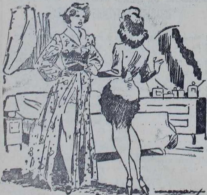
— Колико времена сте провели у служби? — Не знам тачно, госпођо! Нисам гледала на сати!