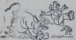
— Воле мош