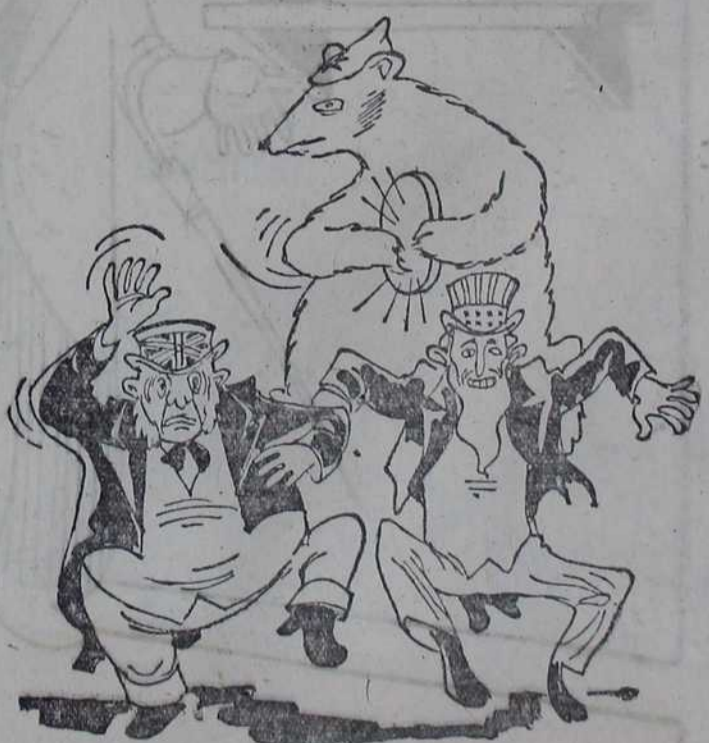
МЕДВЕД: — Доста сам ја играо по вашем такту! Сад ви мало играјте како ја свирам.