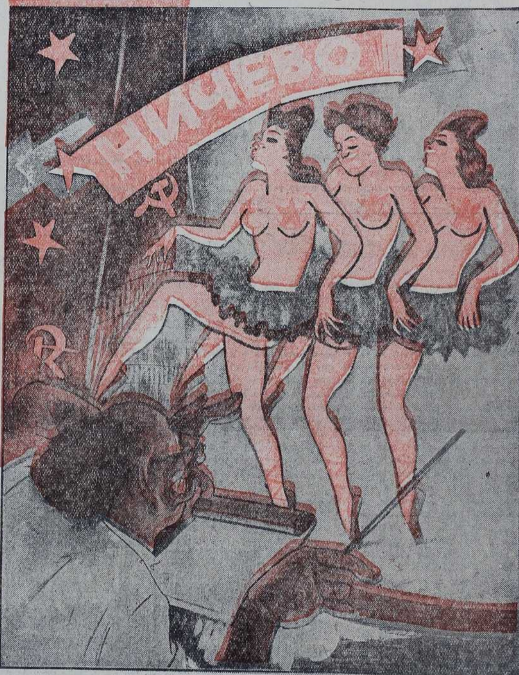
— Пре претставе не обећавајте, за време претставе не показујте много, а тада ћете, после претставе, мојм тражити колико желите!