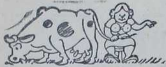
— Воли ме