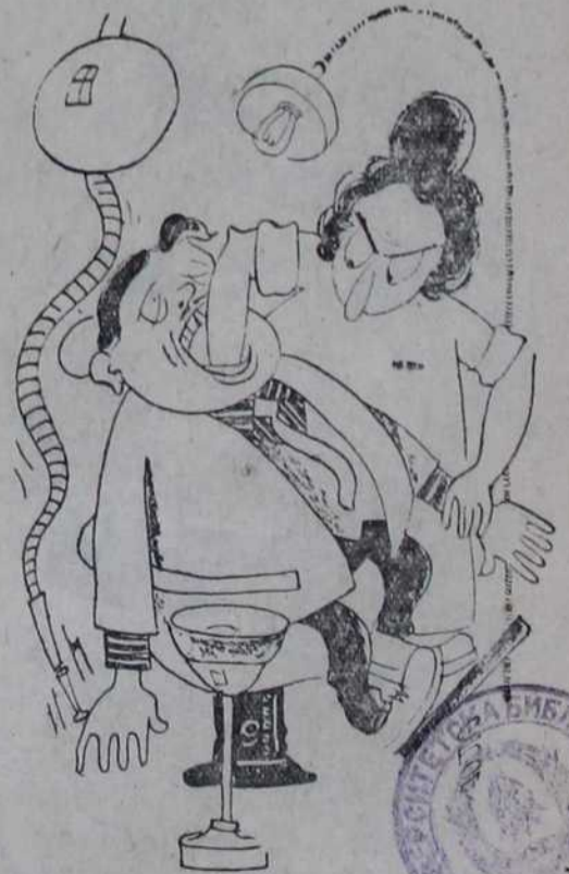
— Шта се дерете, ја сам женска фина! — Фина, ал' за каспина!