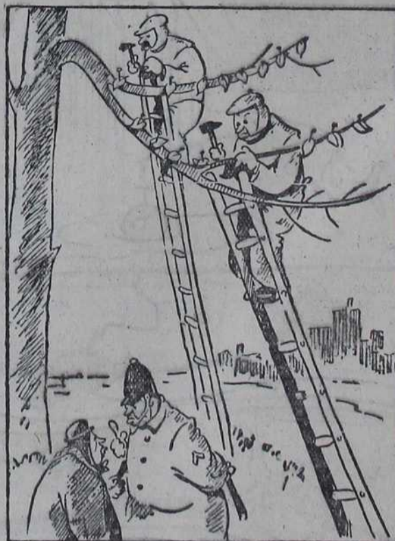
— Кажите ми зашто ови људи причвршћују лишће на дрвећу! — Зар ви не знате шта је Черчил рекао, да ће Немци бити потучени пре него што опадне лишће.