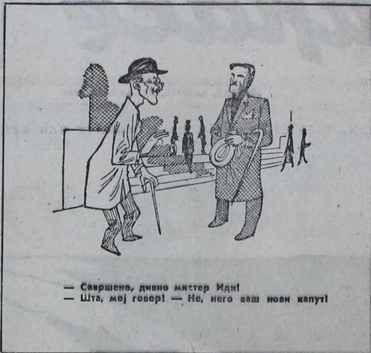
— Савршено, дивно мистер Идн! — Шта, мој говор! — Не, него ваш нови капут!

Коментари разни пробише нам опну Са лажима хоће за врат да се попну Лондон вели једно, Москва друго мисли Ортаке су разни терети притисли Од јада је Рузвелт озледно жучку Јер Стаљин им хоће да потера сучку Па други фронт тражи, скоро заповеда Да се даље врда, он ревносно не да Они виде да се затрчали глупо Инвазија клета коштала је скупо И цео би поса хтели да батале Али Стаљин вели да ту нема шале Јер његова војска са снагом при крају А ортаци помоћ никакву не дају Па се чиле брине да не буде грешке Јер долазе борбе крваве и тешке Победиће онај који буде бржи А црвена војска неће да издржи Зато је на југу он искуство стеко На север се сели, мисли да је меко Али залуд лупа главом о бункере У његовој војсци празнине се цере Да пробој направи — он није у стању Зато целу војску шаље сад у бању Патријарх не вреди, муфтија још мање Код њега је опет очајничко стање.