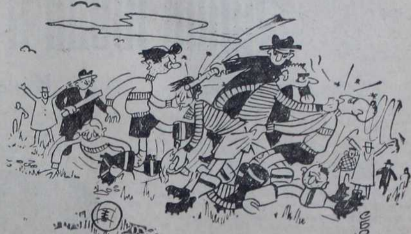
— Тренинг утакмица Балкан—Хајдук, резултат: један теже повређен и четири лакше.

— Мамице, не заборави да понесеш и бонбоне да ми их даш ако ја на улици случајно почнем да пла- чем.