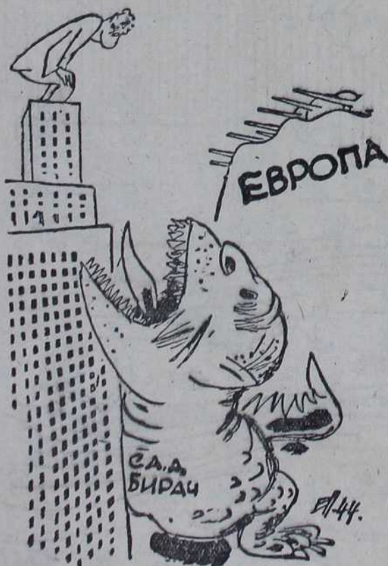
— Дођавола — ако не будем добро прескочио!