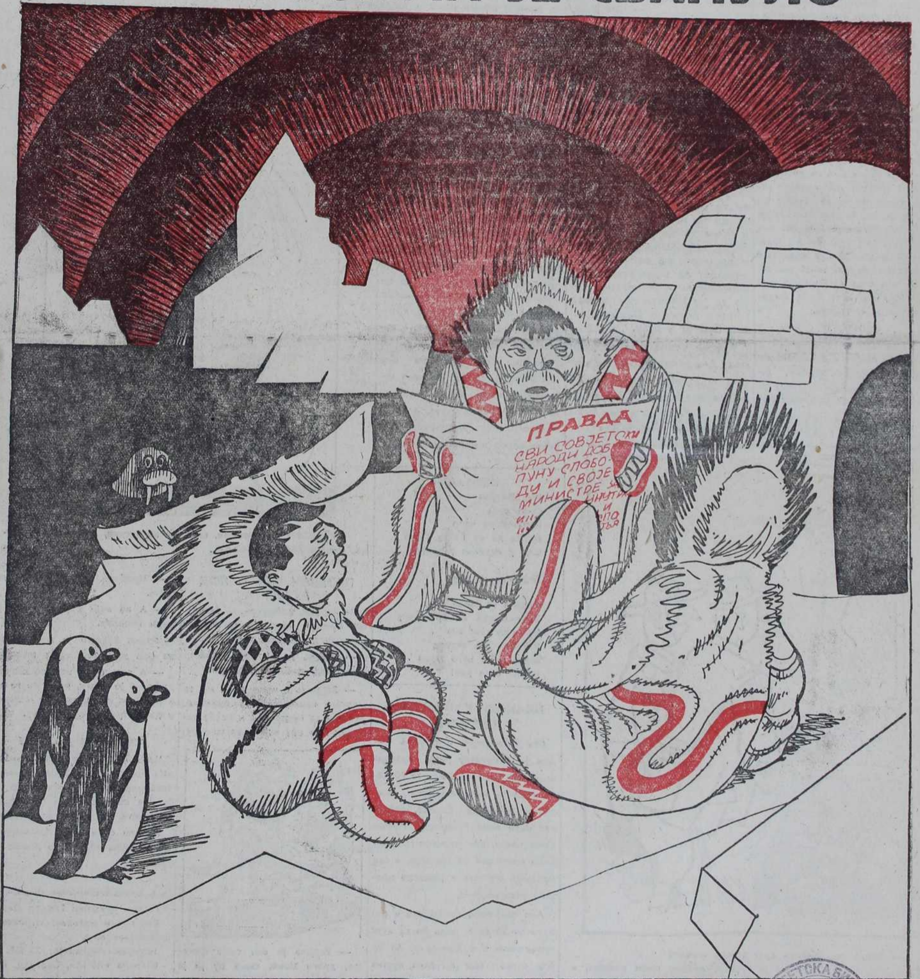
— Види, совјетска дипломатија припрема нову организацију. — Е, значи, сада ћемо и ми имати свог министра спољних послова.