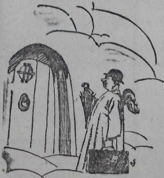
Детектив пред рајским вратима: — У име закона отварај!