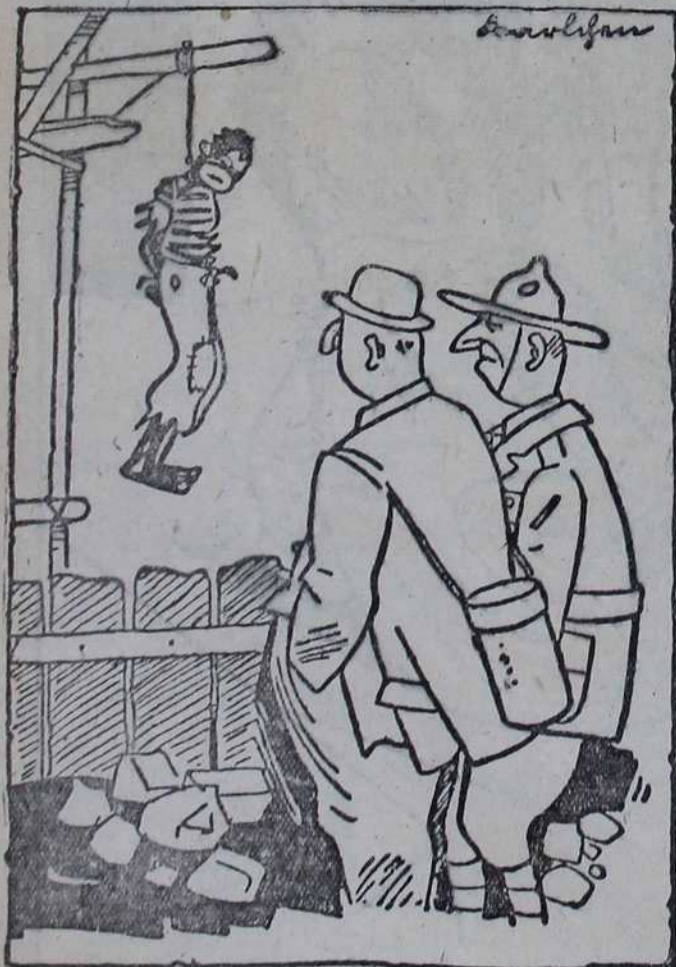
— Зашто сте обесили овог црица, момци! — Он је тврдио да му је Рузвелт обећао виши положај и ослобођење од свих брига — и ми смо му учинили по вољи.

Главни уредник: Теодор Докић. Власник и издавач: »Просветна заједница« в. д. Телефон редакције: 25-681. Штампа »ЛУЧА«, Београд, Краљице Наталије бр. 100.