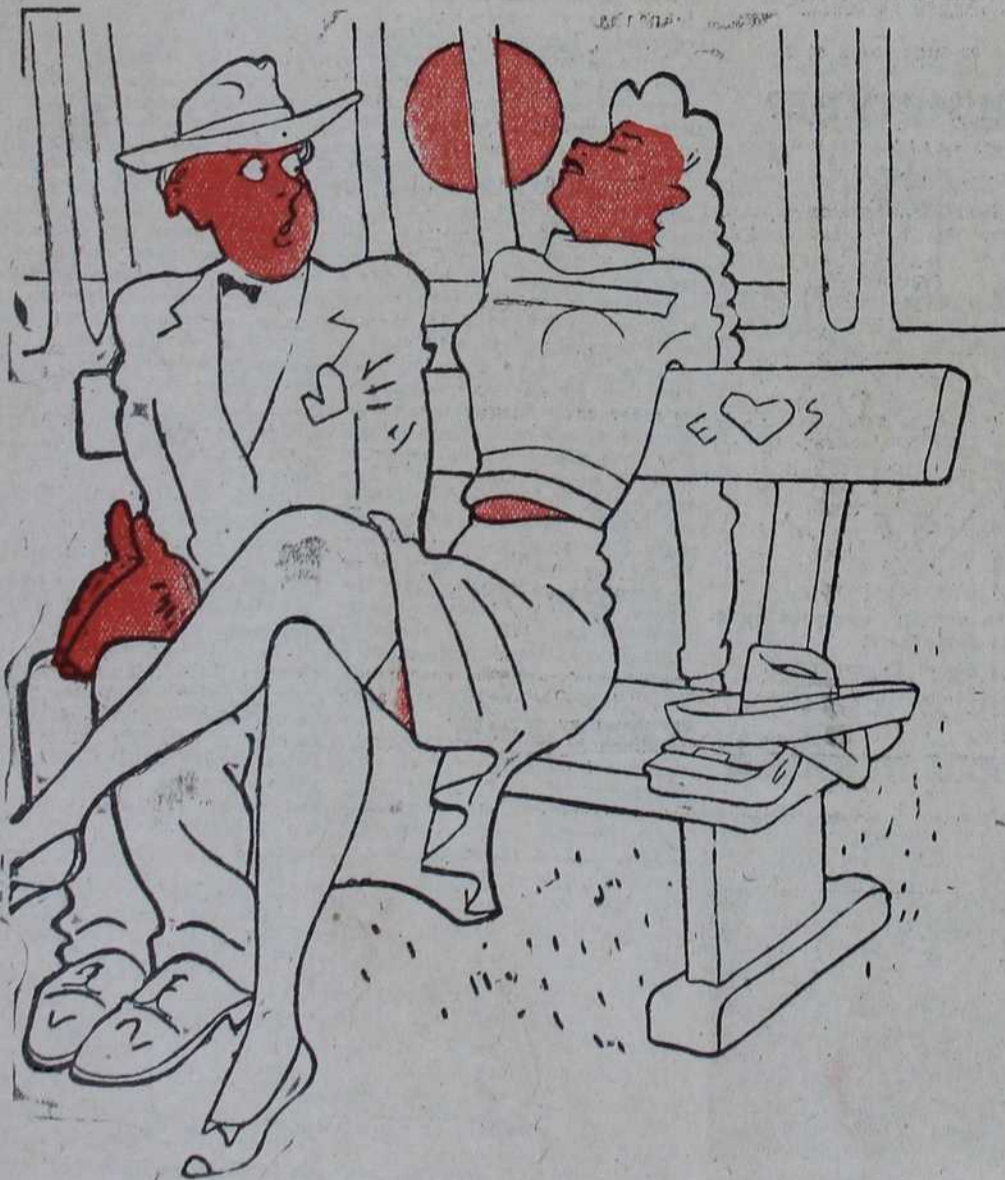
— Да нисте мизда уморни, госпођице Мирол

Млади удварач (маломе брату своје обожаване): „Бокице, ево ти пет банки, донеси ми једну локну из косе твоје сестре. Хоћеш ли?“