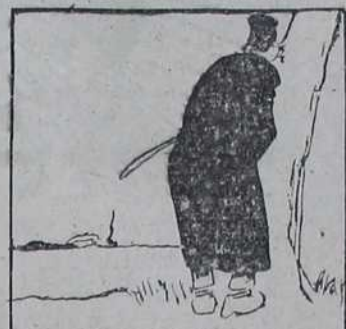
1844 Јеврејин Пинкел.