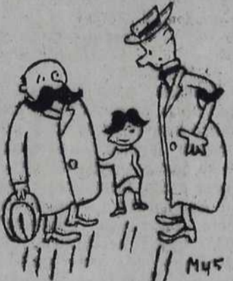
— Види се већ на први поглед да ти син личи на аџа.