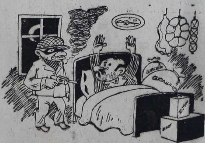
— Узми шта год тоћеш, само немој да зовеш полицију!