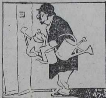
1874 Торбар Демејо