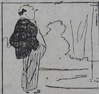
1914 Господин Лафонтен