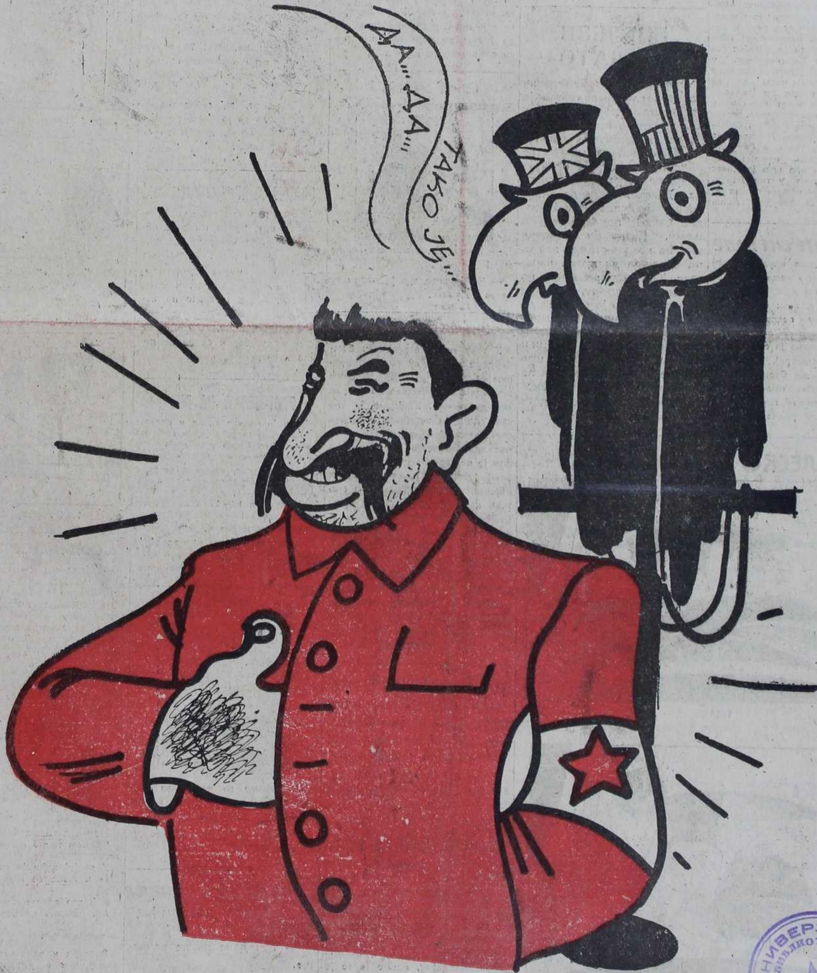
— Ову двојицу сам харашо дресирао...