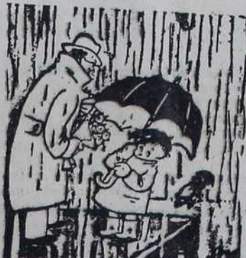
— Поздравља вас моје сестра, и рекла ми је да вам кажем да ће доћи чим буде киша престало да пада.

— Још не. Играмо се тридесетогодишњег рата.