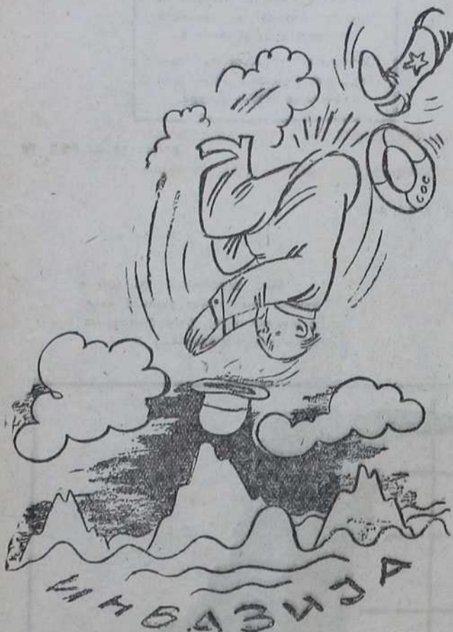
Ја скочих, па шта ми Бог да! Ваљда ће Свевишњи услишати Франклинову и Јосифову молитву...

Како се из редова Срба у емиграцији није могао наћи ни један који би примио на себе улогу Брозовог скутоноше, то је стари режисер наше трагедије, Черчил, извадио из архиве познатог срболоуба Шубашића, који је, озарен од среће што је најзад постао президент, упутио одмах по наименовању своје земљаку Брозу-Титу писмо у коме му је изразио своје дивљење на његовом досадашњем раду на истребљењу Срба, и наговестио му је