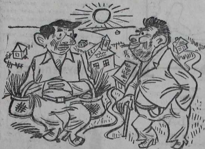
Јел' из Београда Господине! — Јесте. Носим мало лука и кромпира да продам у селу.

Цене појединим намирницама у селима око Београда су дупло веће него у самом Београду.