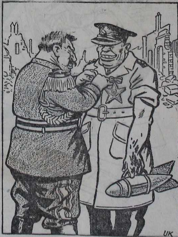
— После Берија, ти си, товариш, најсавршенији убица.

Стаљин је одликовао маршала Хариса, главног заповедника савезничке терористичке авијације.