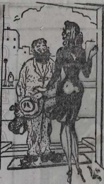
— Молим, имате ли једне старе ципеле!