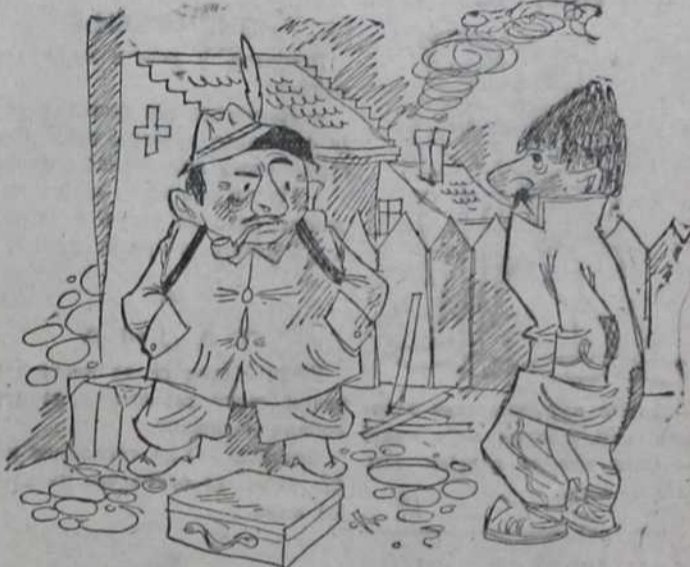
— Је ли здрав овај крај! — До сада ми уопште нисмо имали гробље и чекамо да неки од вас Београђана умре.

Микајила из Барошевца... «пола унапред, а пола ако се изврда трошарина и Дириск» и тд.