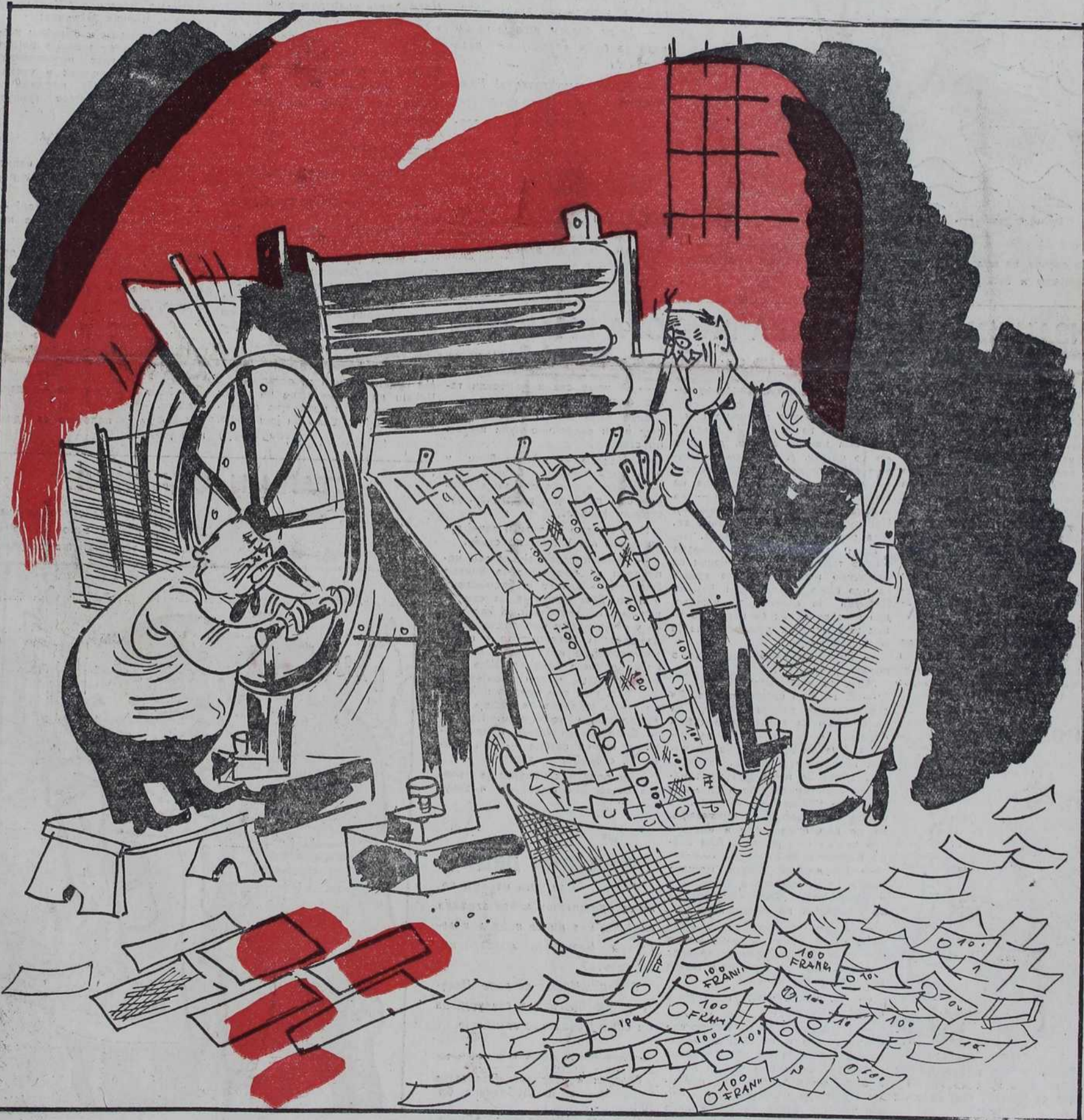
РУЗВЕЛТ: Обећали смо француском народу да донесемо храну. Ја мислим Винстоне, да им уместо тога пошаљемо франке, јер нас то ипак мање кошта.

(Код заробљених Англо-америчких инвазионих војника нађен је велики број фалсификованих француских франака...)