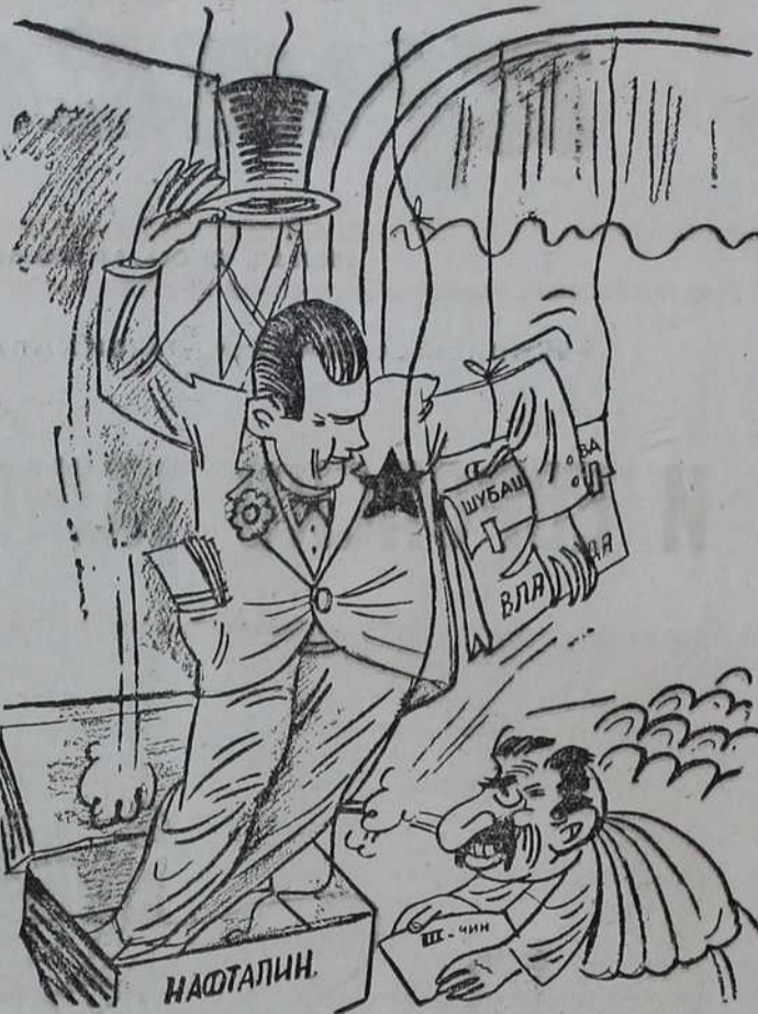
Стаљин: Ајде, Шубашићу, од играј добро ову улогу... Ови досадашњи глумци растераше нам сву публику.

— Ми и сада помажемо привредно Европу у границама могућности — река оје г. Хал. За сада само шаљемо ваздушним путем тепихе.