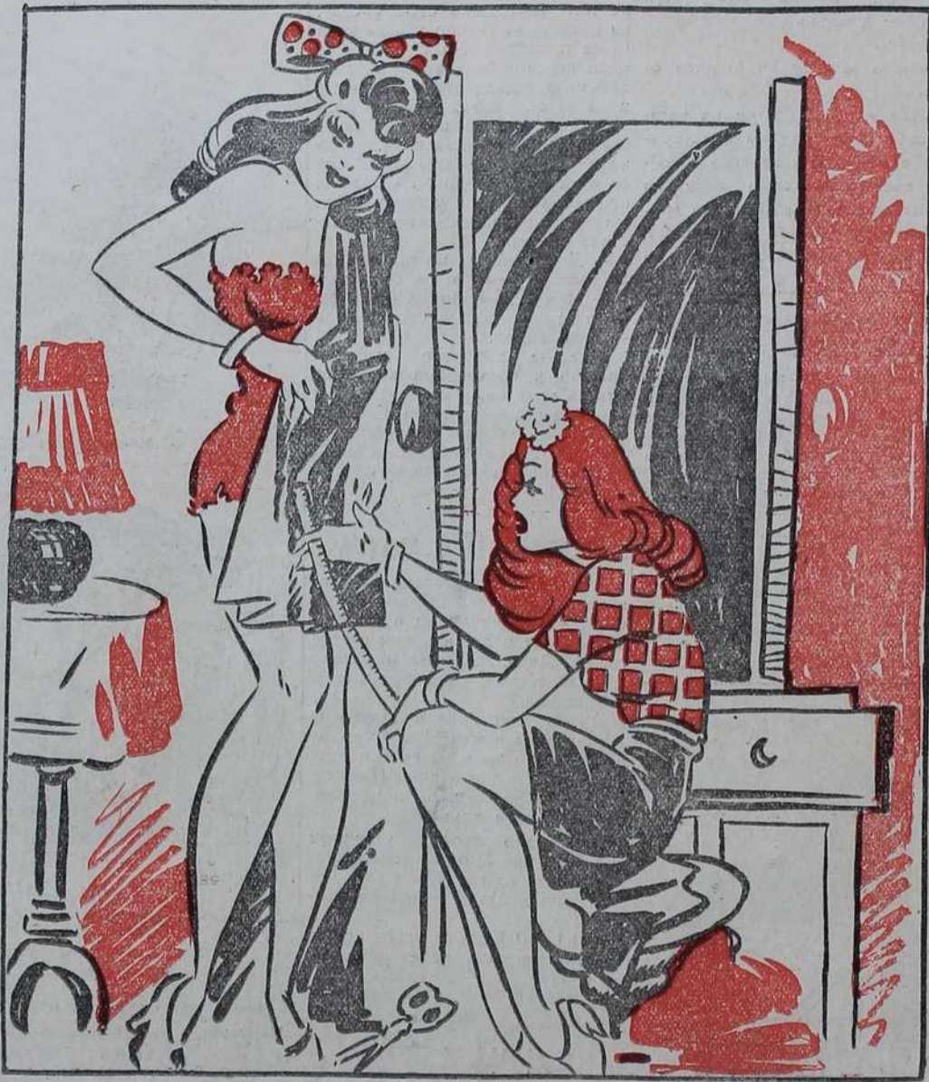
Знате! Госпођице Мицо, имам још једну свилену марамицу, два салвета и метар пантљике — можете ли ми од тога направити једну пепу хаљину!

Једном професору. Сјајан је твој оглас којим позиваш ученике да их спремаш у састављању писмених задатака из српског језика. Сад треба неко тебе да спрема у састављању огласа на правилном српском језику.