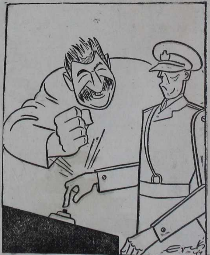
— Генерал Ајзенхауер дао је знак за почетак инвазије.