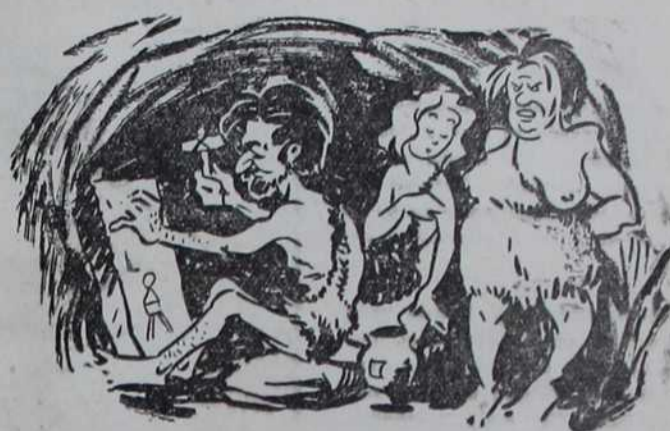
Наши преци 1944 год. пре Христа.