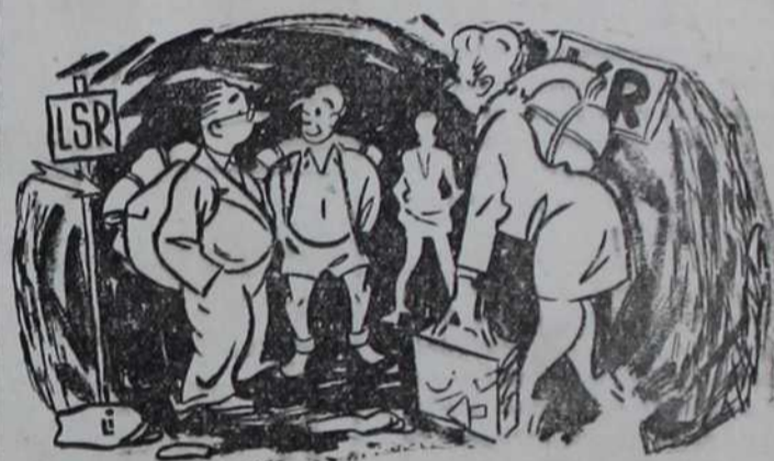
Ми — 1944 год. после Христа.