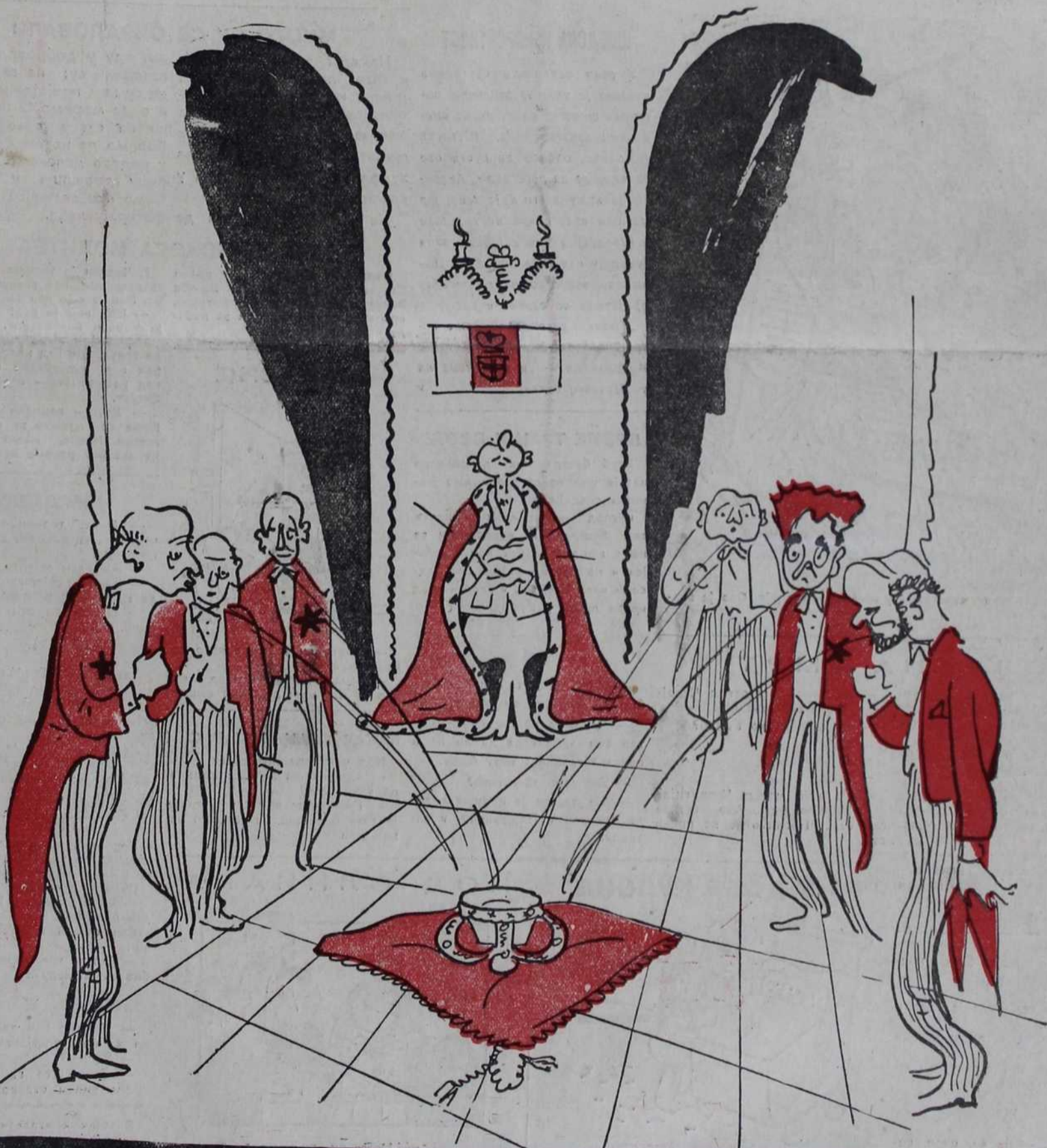
Нова италијанска влада заклиње се да ће бити верна круни