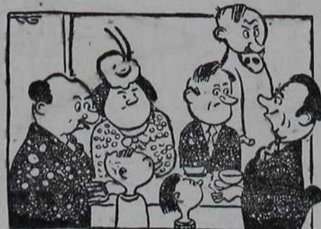
— Јесте ли ви сликар! Тада сигурно сликате само лепе ствари! — Не, ја правим портрете.