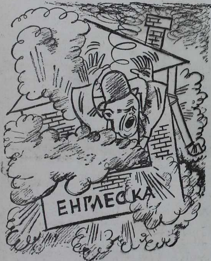
— У помоћ, људи, спасавајте у име цивилизације. Ово је варварство а не рат!

»Опсервер« захтева интервенцију Папе поводом »безобзирног« бомбардовања Лондона немачким новим оружјем.