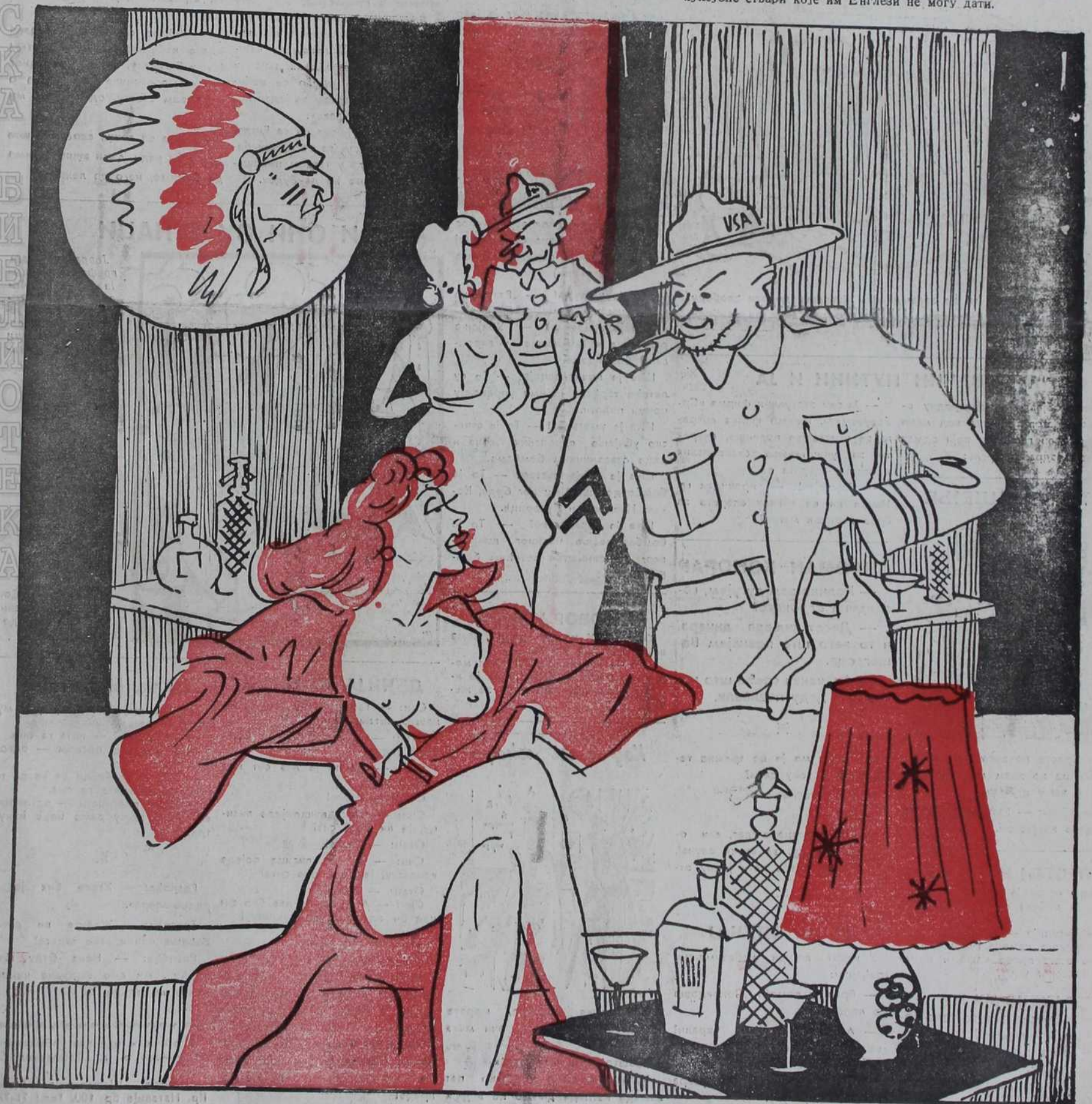
Раније су се Јенки борили са кожом, а сада свиленим чарапама.

Енглези се жале да им амерички војници одузимају најлепше девојке, поклањајући им свилене чарапе и друге луксузне ствари које им Енглези не могу дати.