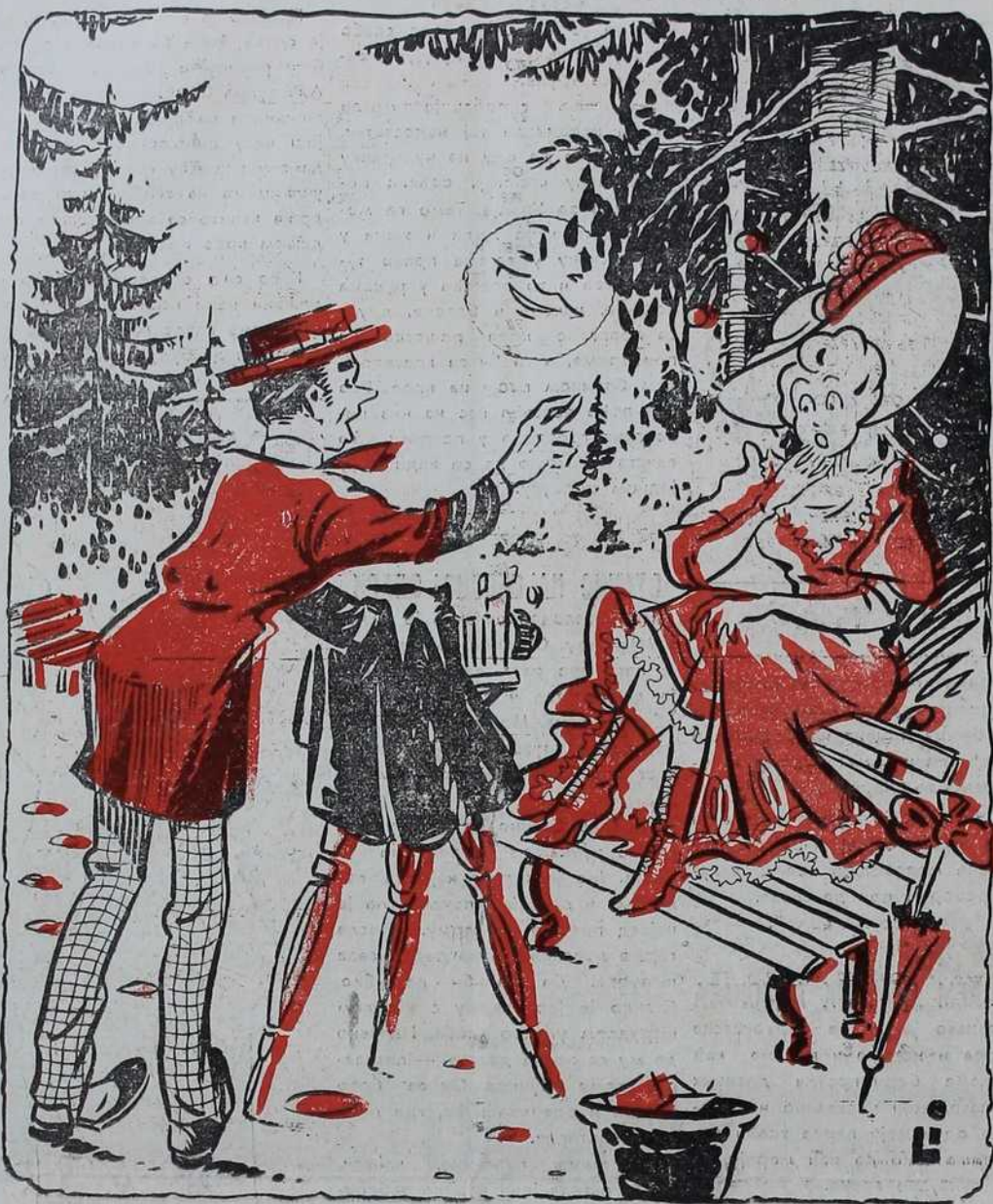
— Али, обећај ми да нећеш никоме показати фотографију.