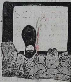
Женски шешир за биоскоп

Стари морски вук-руча у једној крчми на пристаништу. Келнер му донео супу. — Келнер, упита морнар, шта је ово? — Па то је говеђа супа, господине. — Тако? Онда сам ја, значи, преко 50 година пловио бродовима по говеђој супи, а то нисам знао.