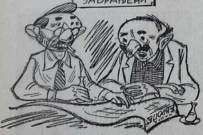
ПОЛИТИЧКИ РАЗГОВОРИ ЗАБРАЊЕНИ

— Бре, Благоје, ти не знаш да нам Енглеска доноси слободу. — Знаш, знаш. Ето београђани по цео дан седе на слободи, — у природи.