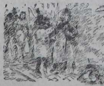
— Радо бих вам однео то писмо у Ниш, али ја путујем само до Ђуприје.