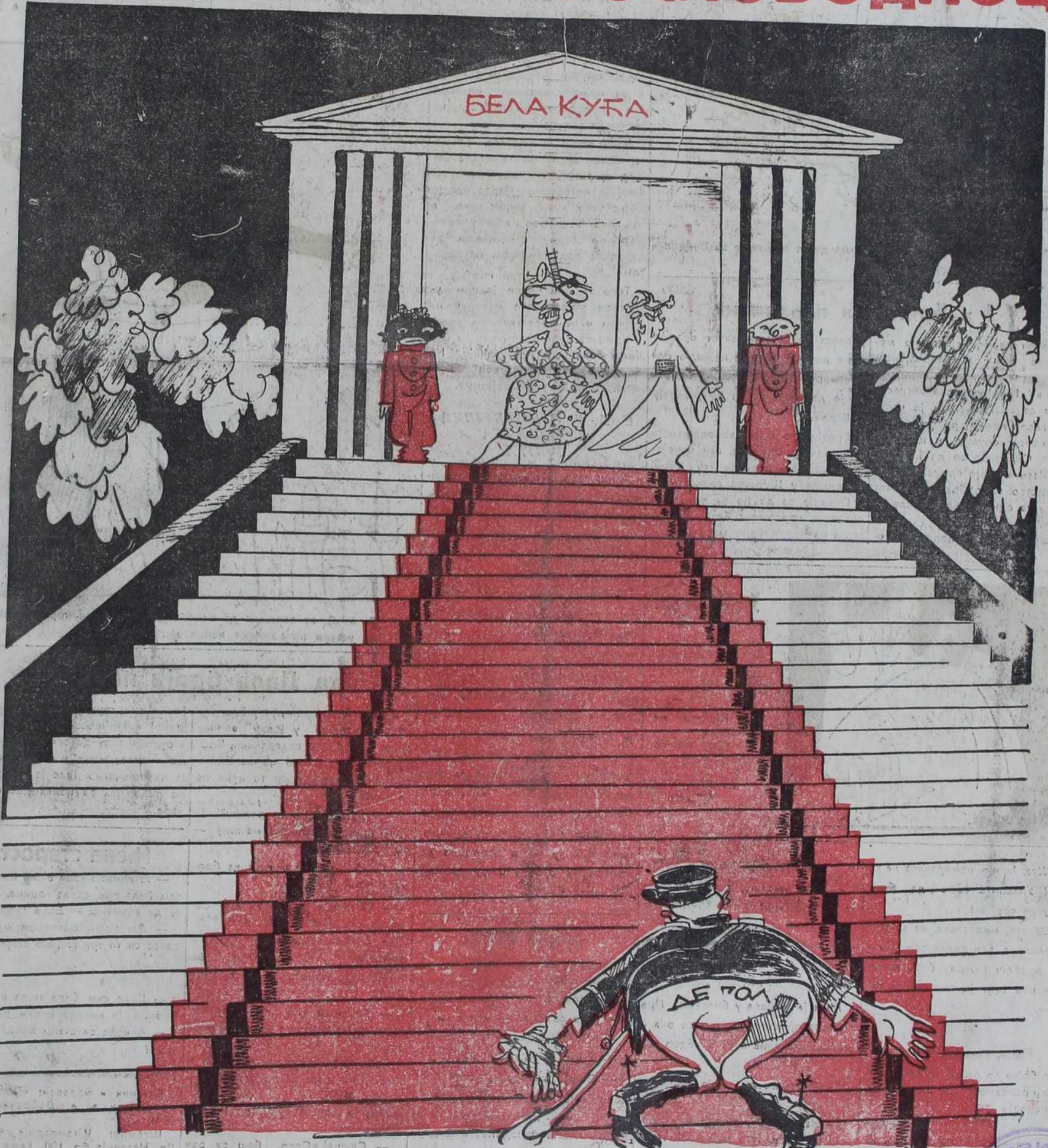
РУЗВЕЛТ: Шта желите меје Де Гол, па ја сам већ ослободио 17.000 Француза — од живота.