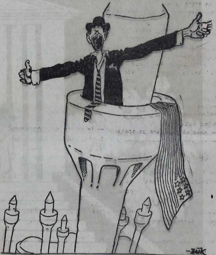
С. А. Д. су спремне да ослободе све народе који су вољни да им уступе петролејске концесије.