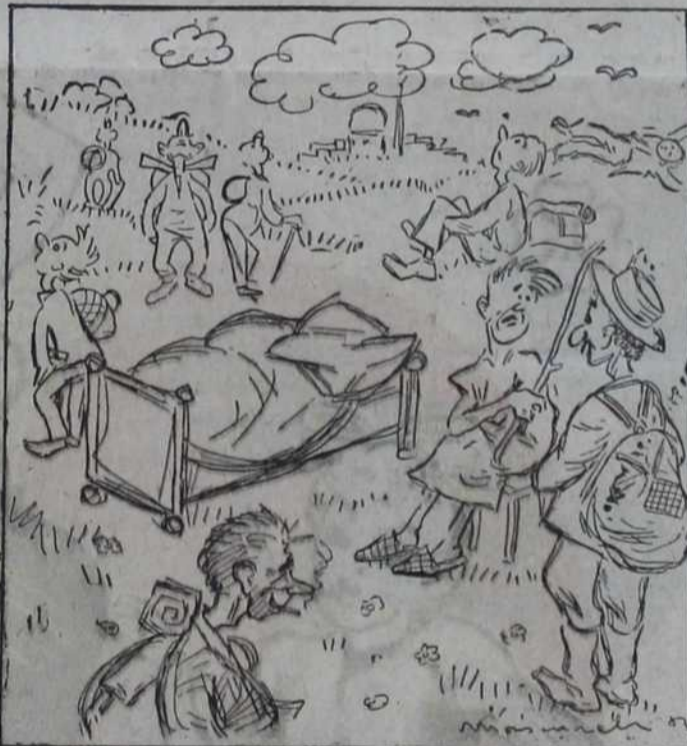
Њему је лекар народне да две недеље чува кревет