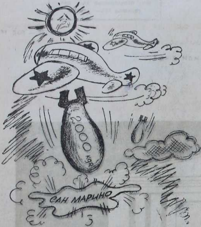
Удрите момци, удрите! Бар њима да се осветимо за Лондон, ако не можемо Немцима.

Англосаксонци су на бруталан начин напали из ваздуха малу, неутралну републику Сан Марино.