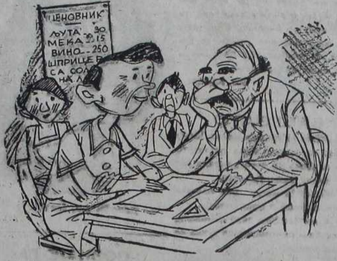
— Кад смо се већ овде скупили Госпон професоре, хајде да наручимо по једну путу.