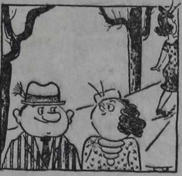
— Јеси ли видела како ми се ова лепа млада девојка насмешила! — Није ни чудо. А ја сам се насмејала кад сам те први пут видела.

После неколико дана повукле су се трупе француског краља из целе Холандије и Амстердам је био спашен захваљујући само мирним живцима дебелог већника.