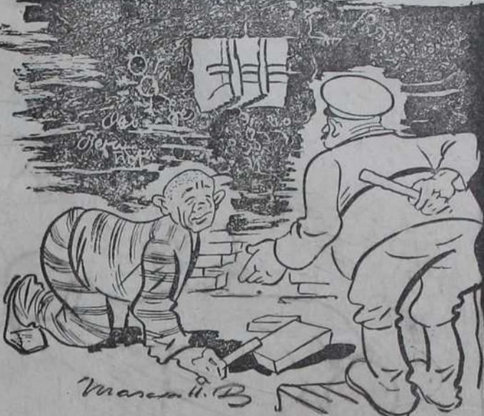
— Што радиш то, бре! — Ето, копам склониште у случају ваздушног напада.