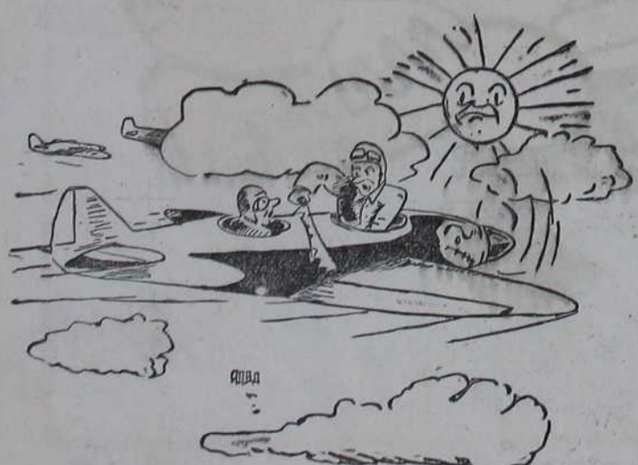
— Хоћеш ли ми убудуће оставити жену на миру!