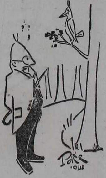
— На шта ли ме потсећа ова птица?