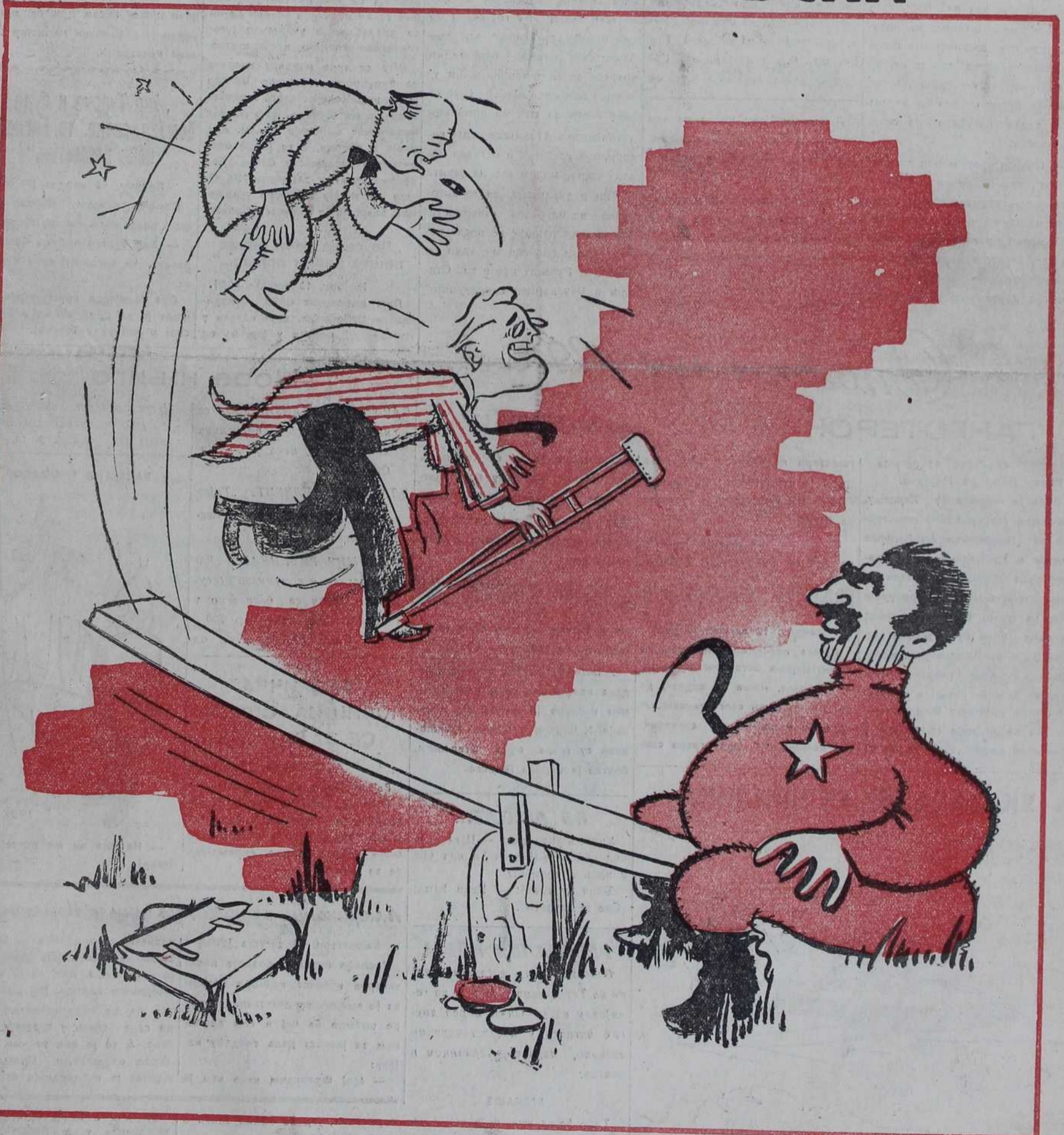
»Ако се у савезничком троуглу две стране сложе по неком питању, онда трећа мора да се повинује«, — рекао је Черчил између осталог у свом последњем говору.