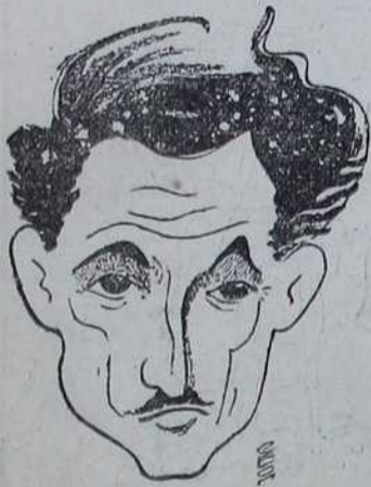
Боско сто има бифе

длаги цика Уледнице, посто сам се добро испаво ле-сно сам да идем у позолните да Гледам Дон цезал незнам даље наслов ти си то век сигурно гле-