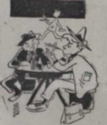
— Које вам цигарете најбоље пријају? — Туба.