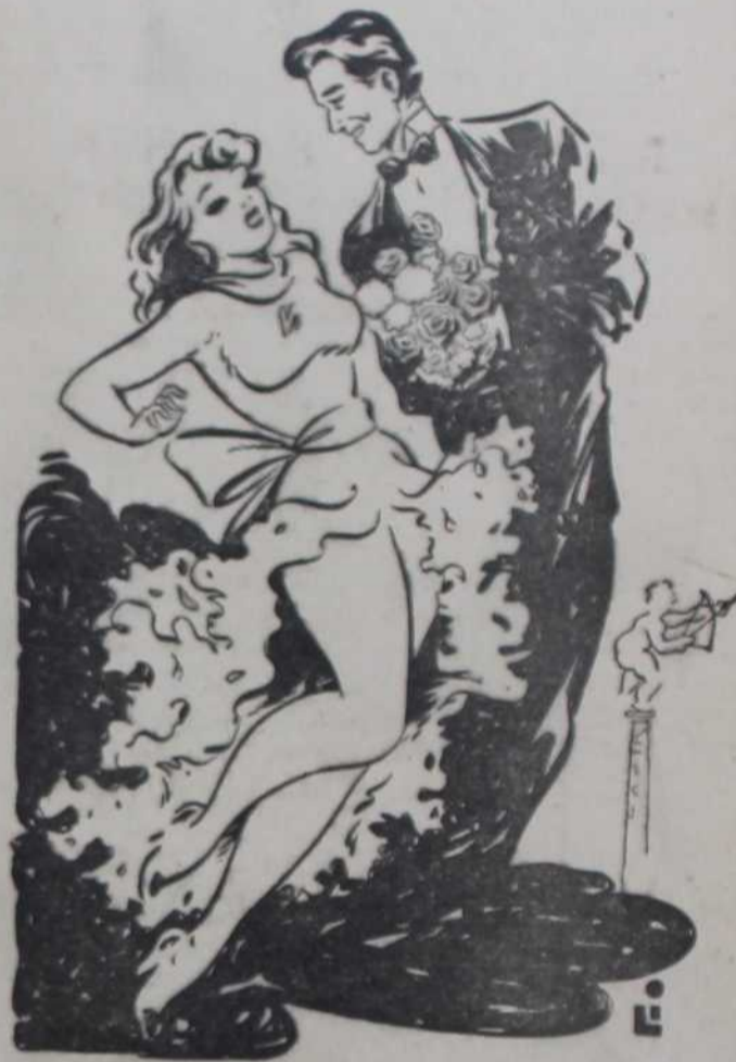
— Ах, Милане, како је лепо бити тајно верен. Све ми моје другарице завиде...

Испод тога неки пакостан човек додво: Друштво за заштиту животиња.