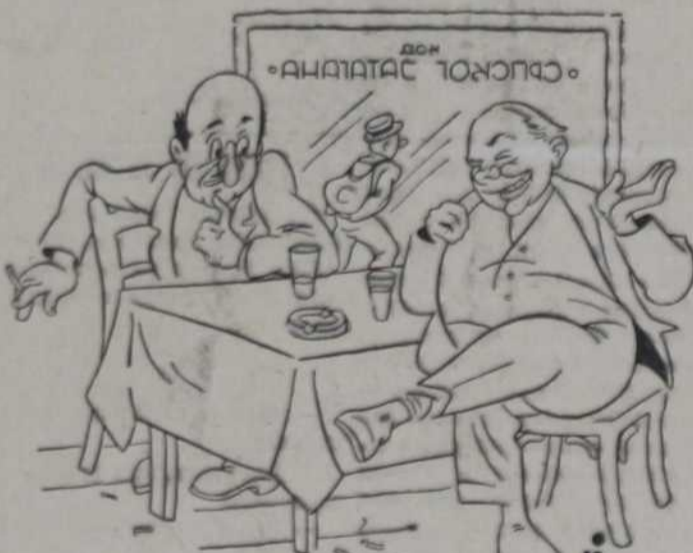
— Дакле, ти не верујеш ни у шта! — Ја верујем само у оно што могу да схватим. — Дакле, ипак сам у праву.