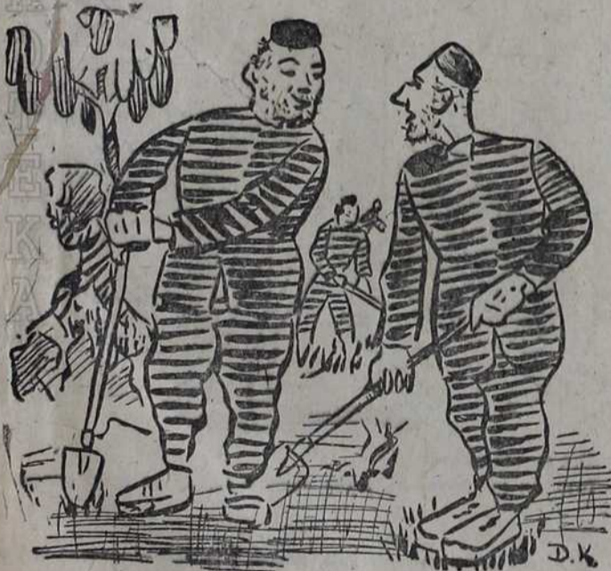
... и једнога дана сам приме-тио да држава прави исти новац као и ја.