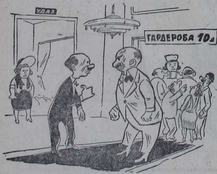
— Господине, ви сте мојој дами стали на ногу! Ја тражим сатисфакцију! — Дрете вољо, био је тамо моја жена и станите јој на ногу!

лиће... И ако још једном дође о- пет ћу га убити. пет ћу га убити. * — Већ трећи пут је ваше псе- то ујело моју ташту. — Значи, желите да га убијете. — Боже сачувај! Хоћу да ми га продате.