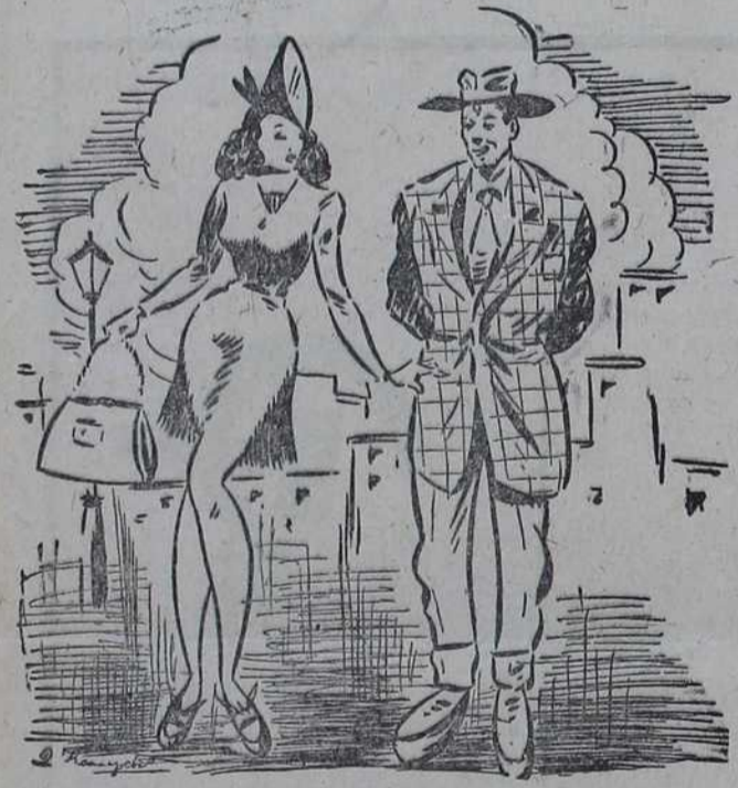
— Један лекар ми је једном рекао да нећу дочекати старост! — Ето, госпођице, видите да и наука може да погреши.

Позориште наше главно Завршило сада славно И сезону трећу: Најпре штукло због узбуна, А сад опет због тајфуна Тражи зграду већу.