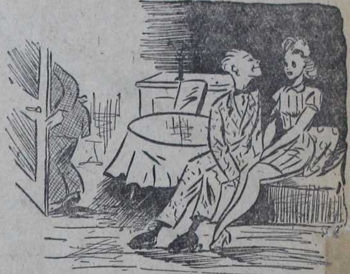
«Назад је твој отац отишао да спава!... Реци ми драга где он оставља своје цигарете!»