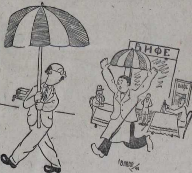
— Кишобран нисам заборавио... Зашто ли сад виче овај келнер!