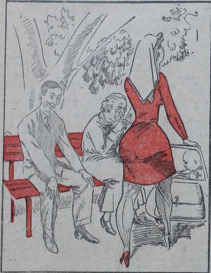
Стара дама: Дивна беба! Млади господин: Свакако... свакако...