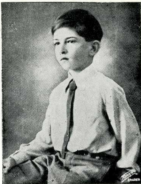
ЊЕГОВО ВЕЛИЧАНСТВО КРАЉ ПЕТАР II.

Детињство и младост увек су привлачни и мили и све симпатије су увек на њиховој страни. Те симпатије још више расту, а по једном инстинкту човечанског саосећања, за децу која рано изгубе оца или мајку. Тај осећај, усађен у људско срце самом природом његовом, развија се као један неодољив талас на читаве масе и на целе народе према младости Суверена, кад на своја премлада плећа примају сву тежину једне владавине. Колико је тек бескрајно симпатичан осећај нашега народа према Сину и Наследнику Онога, коме народ дугује дуг захвалности за своје ослобођење, за своје уједињење и за своју велику и моћну националну државу. И у колико је дубљи и огромнији бол целог народа био са губитка Краља Оца, у толико су дубље, искреније и трајније симпатије народне за Краља Сина. То је толико истина, да данас при спуцању младога Краља Петра Другог на престо, ми можемо поуздано рећи: да никад у свешту није забележена тако спонтана, дубока, искрена и велика народна љубав при доласку на престо једнога краља, као што данас осећа цео југословенски