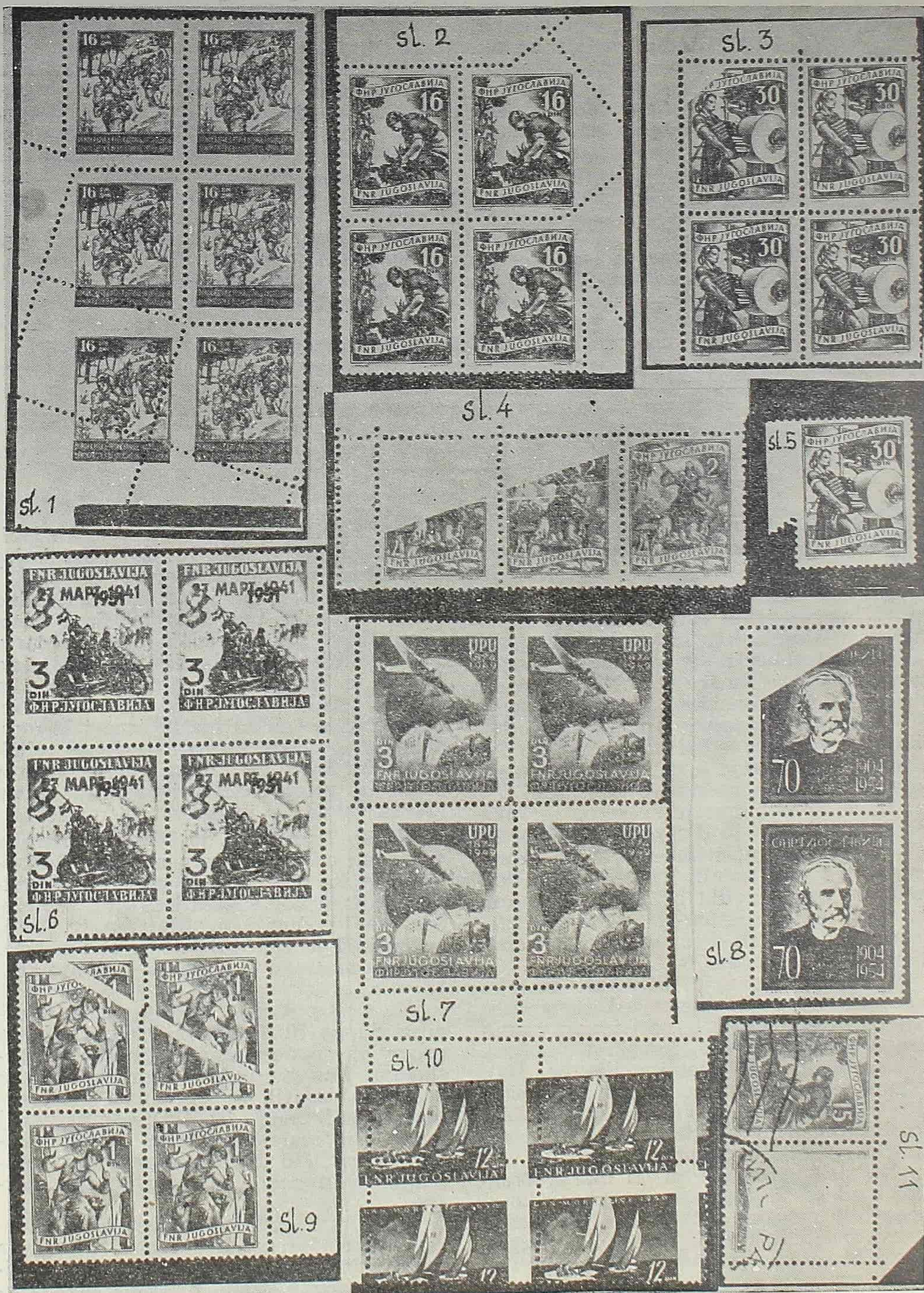
Snimci grešaka na našim markama na koje se poziva Vladimir Vujošević