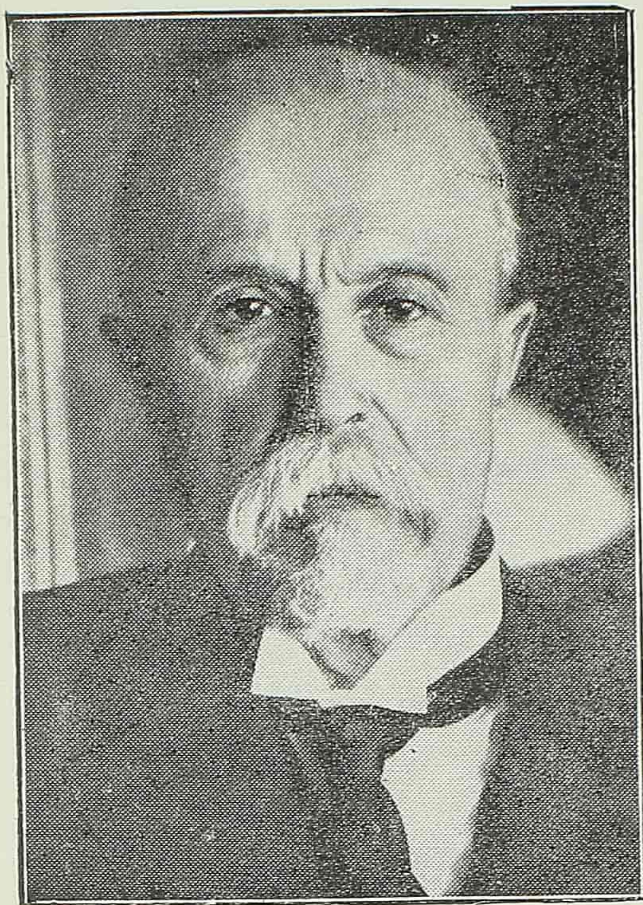
T. G. MASARYK

Pred nekoliko dana sav je kulturni svijet proslavio osamdesetu obljetnicu rođenja jednoga duhovno i etički velikoga čovjeka, Tomaša Garriga Masaryka. Historija poznaje čitav niz ljudi koji su, rođeni u sirotinji i bijedi, vlastitom svojom snagom, mučno i pošteno doprli do visokih vrhova karijere — ali današnjica broji vrlo malo slučajeva da takovi ljudi još uvijek stoje na čelu svojega naroda. Za Čehe je jedna od najodličnijih svjedodžbi da se klanjaju poštenju i duhu ovoga borca za istinu, pravdu i bratstvo i da ga stalno stavljaju na vrhovno vođstvo svoje zajednice.