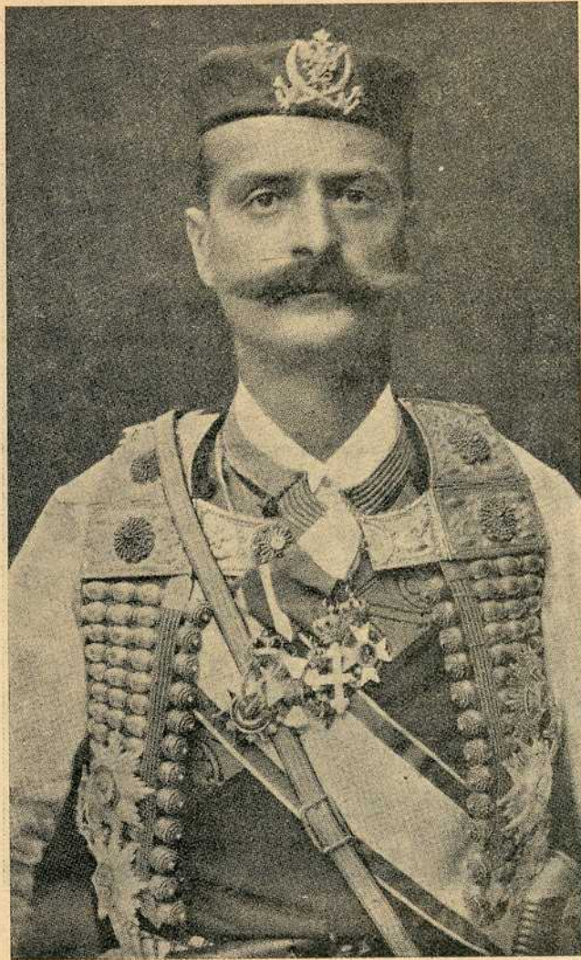
Бригадир Митар Мартиновић командант приморске црногорске војске

Према вестима које су јуче стигле из Цариграда борбе се још непрестано продужују око Берана.