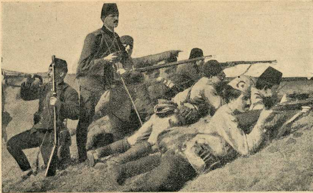
Призор из Кумановеке битке

армијом ђенерала Степана Степановића, која је ишла из Бугарске преко Ђустендила ка Игри-Паланци и Кракову. Бенерал Степановић имао је под својом командом две српске пешачке дивизије, два коњичка пука, потребну артиљерију и остале помоћне трупе у јачини око 45.000 људи, а сем тога и једну бугарску пешачку дивизију.