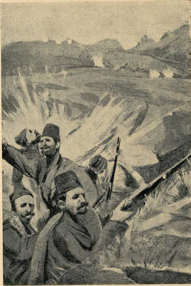
Привор из Кумановске битке

љеном меморандуму који је објашњава а да, као доказ свог пристанка, опозове декрет о свој мобилизацији.