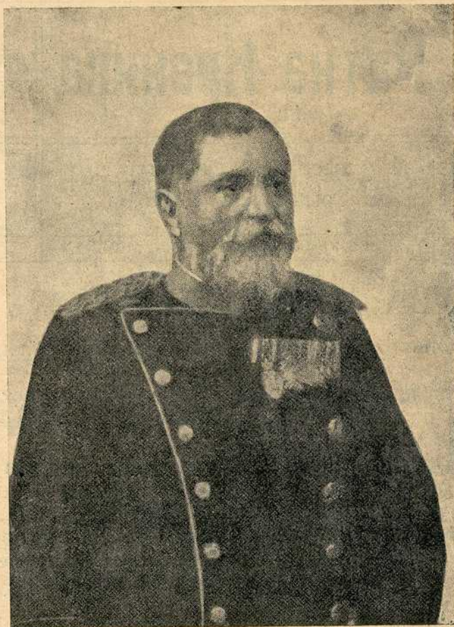
Војвода Радомир Путник шеф ерпеког генералног штаба