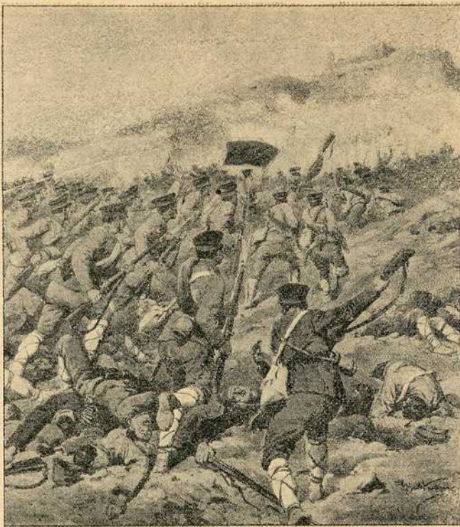
Бугари јуришају на Турке у битци код Луле-Бургааса

Поред саме пруге постројен је одред болничара са носилима, а више њих, један поред другог, до саме топчидерске трошаринске станице, наређани су фијакери који имају да од-