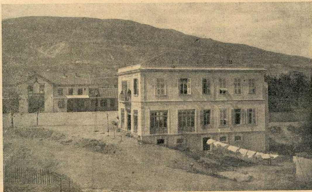
Железничка станица у царетвујућем граду Скопљу