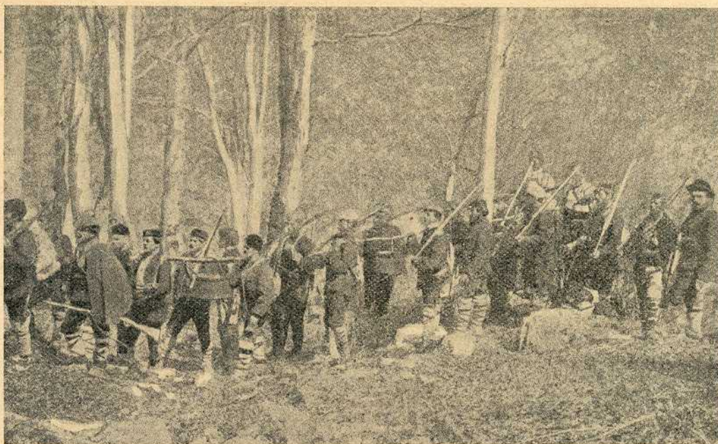
Српске комите прелазе из Србије у Санџак

мали број војника у касарнама). Српски официри су најбољи купци свију стручних и белестричних књига, које се у целом Српству штампају. Сем службеног часописа „Ратника“ готово је сваки српски официр претплатник Српске Књижевне Задруге, Српског Књижевног Гласника, Бранкова Кола и Босанске Виле.