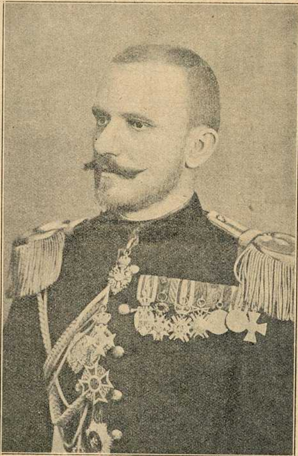
Генерал Живојин Мишић помоћник шефа српског генералног штаба

и своје браће, па опет залуду. Српске су владе за ових тридесет и четири године безуспешно исцрпили сва дипломатска средства и код пријатељских сила и код Порте; шта више, кад се пре неколико година покушало с реформама у неким вилајетима Европске Турске, већи део Старе Србије био је искључен из тога покушаја. Ја сам са своје стране све учинио, да мирним путем исправим ово стање тешко и несносно, и по нас и по браћу нашу. У томе смеру ја сам ступио у споразум са Краљевима балканских држава да сложено покушамо, заједничком представком у Цариграду, поправити оно што се више не може трпети. У том спремању били смо изненађени мобилизацијом и концентрацијом турске војске према нашим границама. На то се морало одговорити једнаком мером, али смо ипак једном заједничком нотом, испуњеном свим обзирима умерености, учинили последњи покушај да се мирним путем нађе злу лека. На то се одговорило новом сечом наше браће, новим зверствима над њом, новим повредама границе и на послетку опозивањем турских посланика из Београда, Софије и Атине.