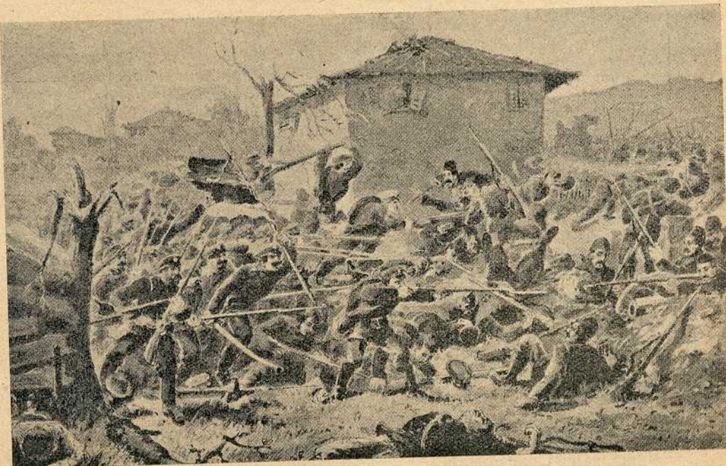
Призор из борбе код Киркилисе

Јуче у шест часова изјутра отпочео је наш седми пешачки пук