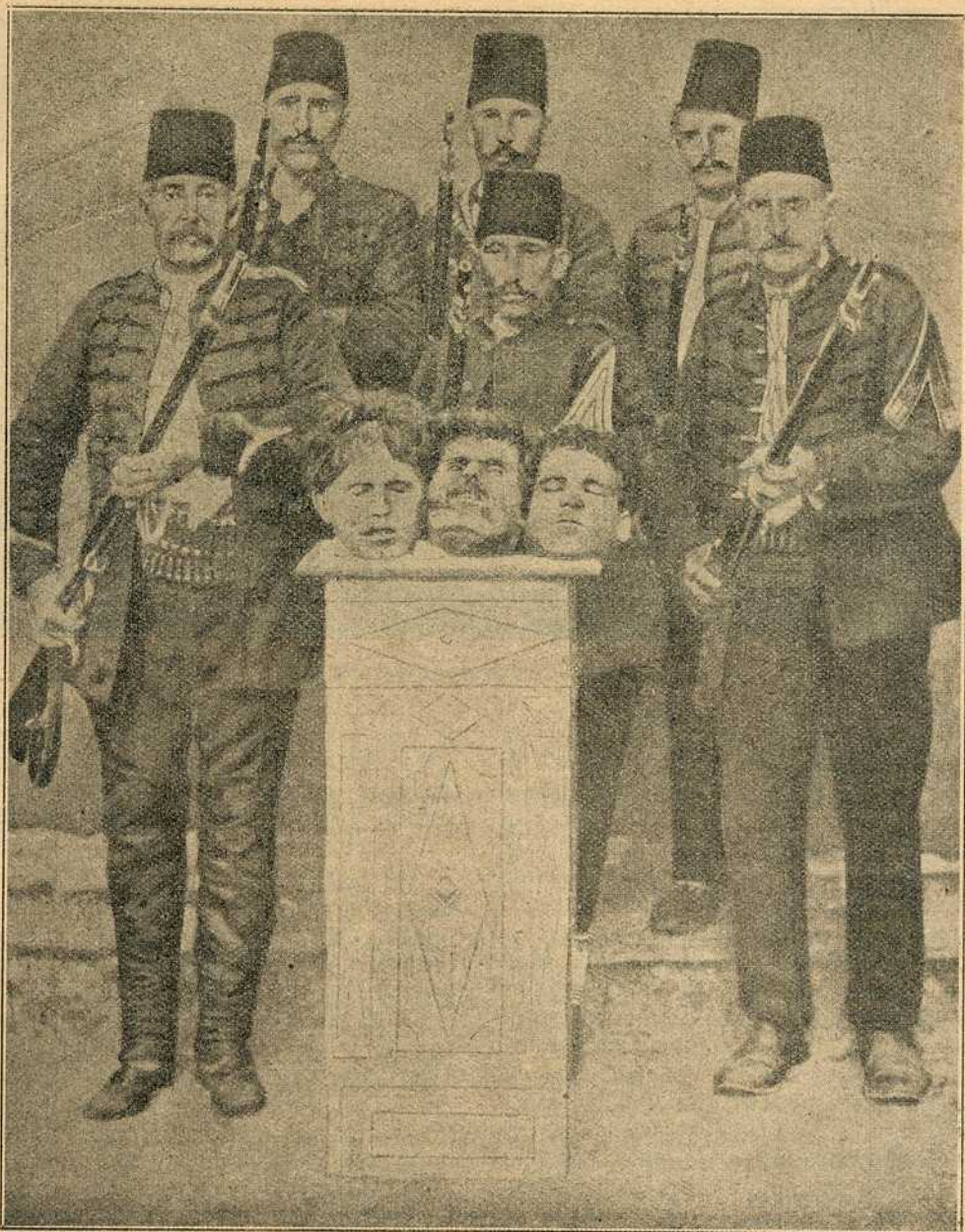
Слика турскога зверства

[На Куманово!] Ноћас и јутрос наше су трупе наставиле продирање ка Куманову и можда још данас по