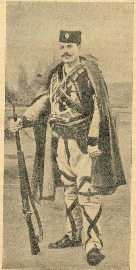
Војвода Јован Бабунски

[Заузеће Подујева.] Али Турцима ни то није било доста и они су јуче рано изјутра поново напали наше трупе. У јучерашњем броју нашега листа ми смо саопштили последње вести о почетку тог великог боја.