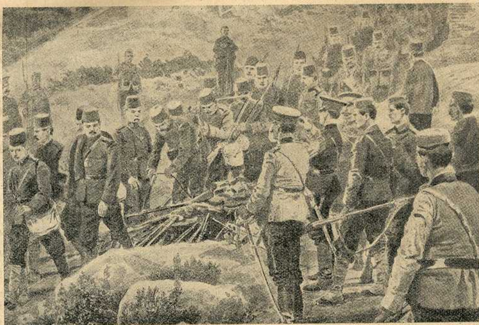
Посада Тузи предаје оружје

најозбиљнију бригу покљонио стварању организоване народне војске. Дотле је војска била под управом унутрашњих дела, а њоме је командовао »начелник стајаће војске«. Кнез Михајло је позвао француског пуковника Мондена, да организује српску милицију, и тада је створио засебно министарство војно. Пуковник Монден (умро је пре 6 година у Паризу) био је први српски министар војни. Кнез Михајло је за подизање српске војске врло много урадио. Довео је неколико Срба аустријских официра, створио школу за старешине народне војске, установио стална вежбања недељом и празником за народне војнике и целу народну војску наоружао тада модерним оружјем. Благодарећи оваком његовом раду на јачању народне оружане силе, он је могао 1867 без капи крви да добије шест градова, у којима је била још турска опсада.