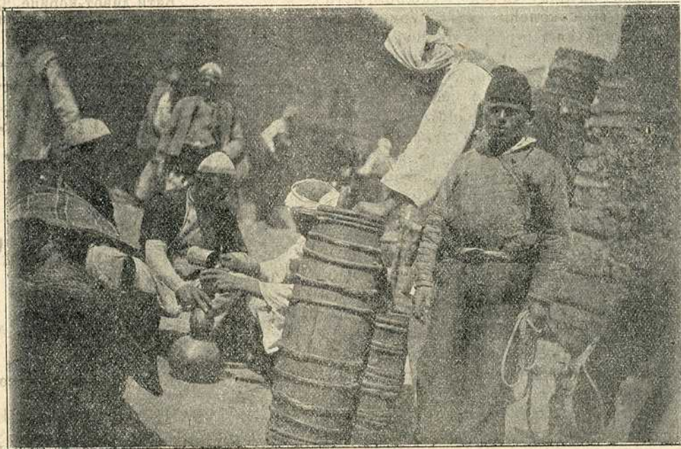
Продавци вина у Скопљу

По описима многобројних бегунаца, који сада нису тако многобројни, као за време рата, стање је у Једрену очајно. Житељство нема шта да једе. Хлеб се продаје по два лева килограм и Једренци су се већ одавно одрекли да једу месо. Соли, шећера, каве и за лек је премало. Заразне болести прождиру грозне жртве. Дневно гине по десетак војника од врућице и колере, а у житељству је тај број и већи. Ретка је кућа у Једрену, која се у жалост није завела. Вода се пије само из Марице и Тунде. Но