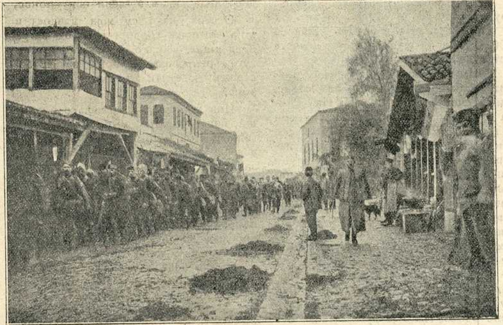
Српска војска III. позива улази у Скопље

Кишне капљице, упијене у дебело и грубо одело, као да већ миле по мојој кожи. Умор од дугог пешачења довлачи се као лопов у моје тело, да