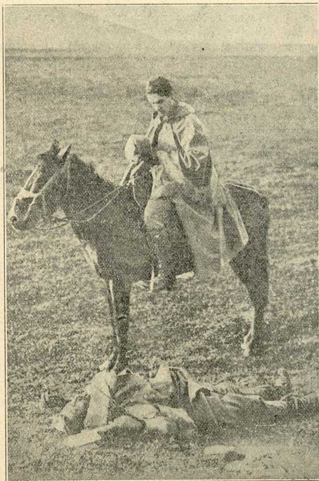
Српски официр одаје последњу пошту јунаку погинулом на Куманову

Ради радозналости предложим да свратимо у једној од таквих кућа, која бјеше пушта, а привлачише нас и својом величином, (неки рекоше да је то кућа потомака паше Бушатлије), нашто сви