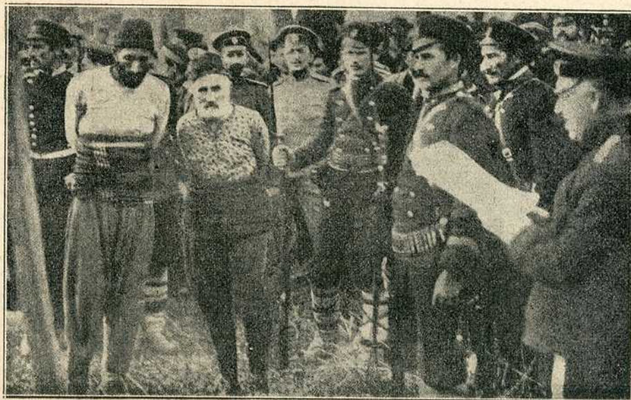
Башибозуци у бугарскоме табору пред стрељање