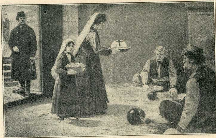
Споменуло се не повратило се! Срби у турскоме ропству пре Косовске освете