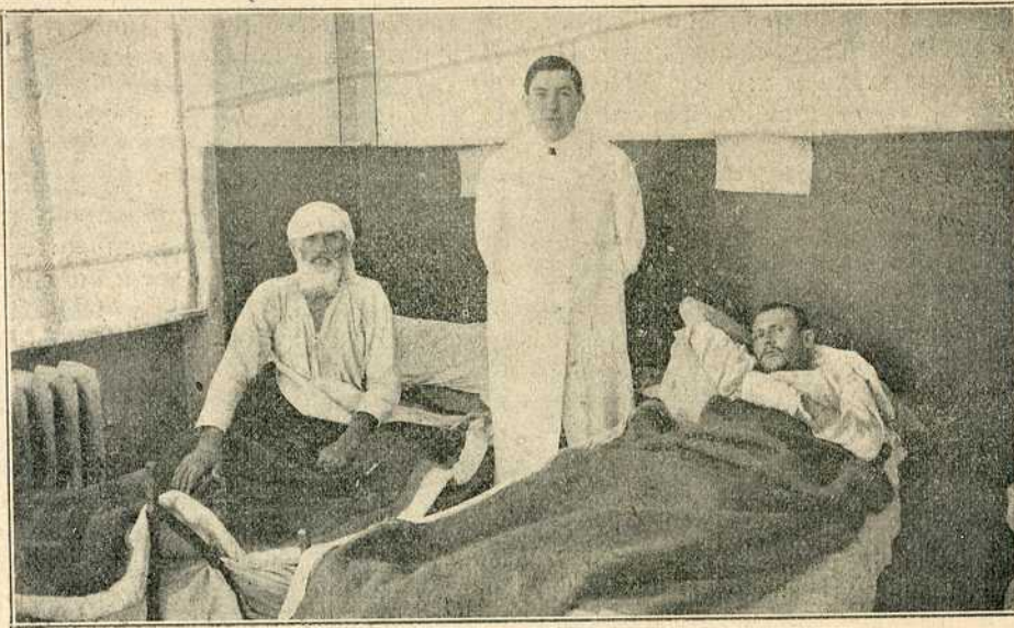
Из београдских болница: Млади Арнаутин који је убио осамдесет Срба, старца, жена и деце (види слику на другој страни)