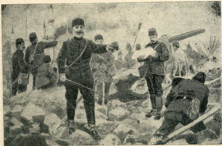
Обнова рата — Бугари и Срби засипају једрене гранатама — Шукри паша издаје налоге