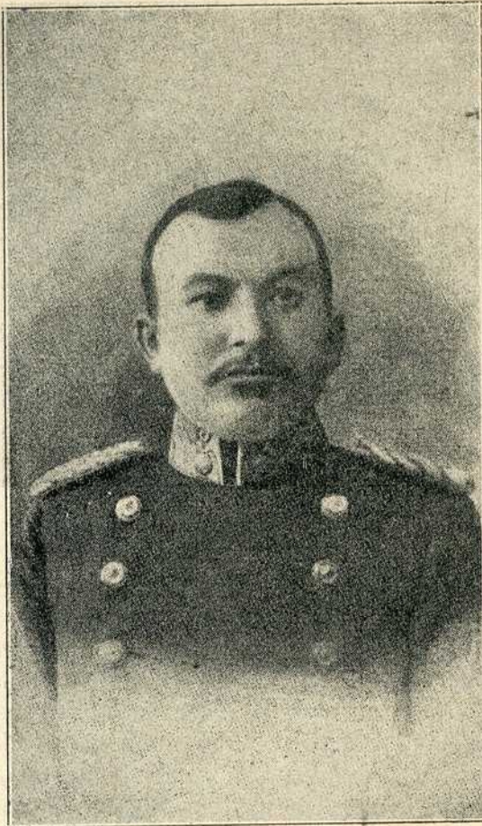
Хасан Риза беј, заповедник Скадра

у овом раздобљу мира и неактивности, јер је апсолутно искључено, да би неко мислио на повратак и на напуштање потхвата. На свим заузетим позицијама бивакирају србијанско-црногорске трупе. Западњак дува хладно од пет дана и, завијајући, шиба невероватном жестином ове неукротиве војнике. То је олуја зрака, која се баца огромним маховима на бојно поље. Од часа на час који неодољиви вихор провали из којег горског кланца, склизне над језером подижући наборе модрикасте воде, захвати у грабежљивој вејавици по читаве скупине шатора и однесе их далеко међу мочваре.