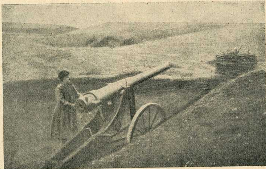
Српски опсадни топ под Једренима