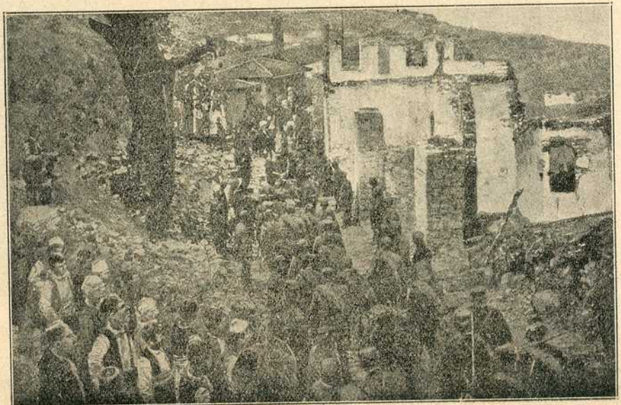
Улазак црногорске војске у освојени Скардар