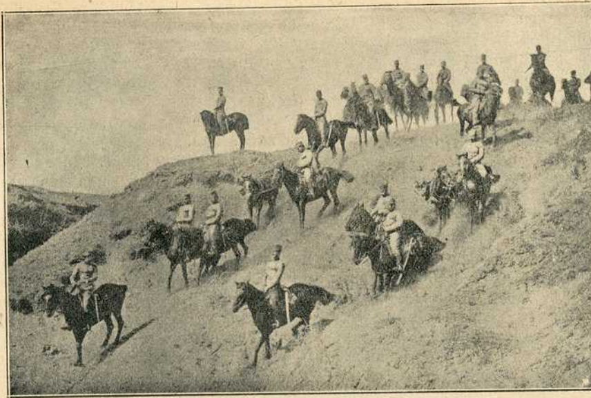
Прелаз српске коњице са својим митраљезом код Демир капије