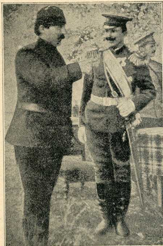
Есад паша предаје црногорском престолонаследнику Данилу Скадар