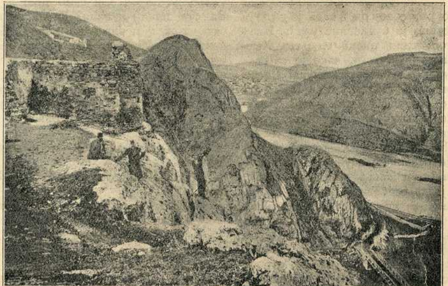
Рушевине цркве Краљевића Марка у Велесу