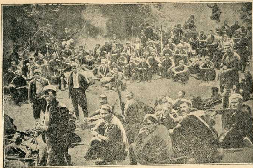
Црногорци пред Скадром