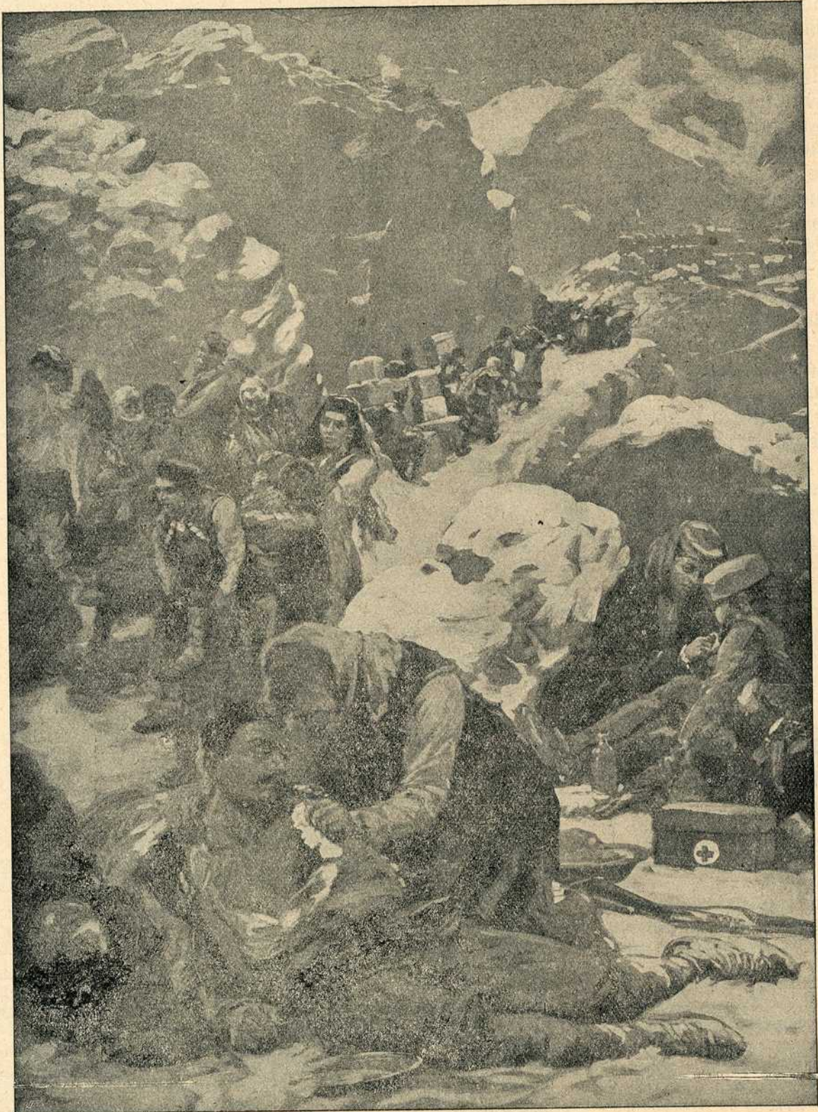
Призор из балканског рата 1912-13. Црногорке изнашају из бојне линије своје рањене и пале јунаке