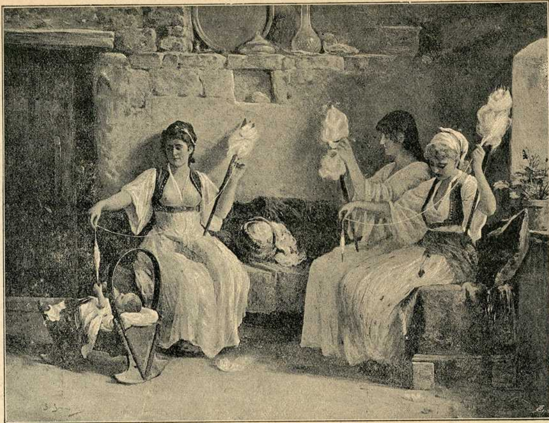
Црногорке на дому: Преље

Отровно семе јевропских зала, Несрећну децу охоло цара, Природан савез људскога квара: Черкеза, Курда, зејбек, Татара Са грозном бруком, са алкураном, Крвавом руком и јагаганом, Јуре по дану, траже по мраку Девојке бедне, децу нејаку; И са ханџара бели се глава. Или се пара дели крвава Нејаког чеда, или старца седа, Или је, можда, главица бледа Невести лепој с рамена пала На хладно гвозђе ошгрого реза Дивљега беса: Татара, Черкеза! ... Прешли су земљу Бугарског стења, За њима земља остаде сама, На земљи гробље, по гробљу тама, У тами ужас опустошења, Гаравог стења, крви, камења, Али за цара нема карара; У мору крви нема пехара, Његовој жеђи ту није гаса, Још њему није доста ужаса, Видло је око охолог назови цара, Још једну земљу преко Балкана, Што је слобода љуби, целива, А дичан народ крвљу умива: „Тамо, витези, Курди, Татари, Из мрачне крви српскога мора Татару зора синутити мора!..“ И напред дера хиљаду чета, Крвљу да пере ругобу света, Ругобу своју и свога народа; Ал стоји војска српскога краља, Синови храбри српских земаља,