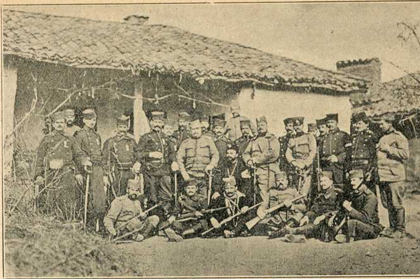
Српски официри и војници који су први одликовани под Једреном од бугарског краља

И заклетва краља бугарскога, На грудима часно знаменије, Краљ бугарски што га погазио. Мирно краљу стаде пред Асана, Очи вјерне к небу обраћаше, Јеванђељем груди заклањаше. Мрко Асан на краља погледа, Хтједо крвник њему прилећети, Ал му нешто коракнут не даје Ни с татари краља опкољети. Тако краљу мало постојао, Пак Асану громко проговара: „Татарине кад ми скинеш главу Однеси је мом невјерном шуру И од мене поздравље му кажи: Од Бога је вјера и братимство, Од сотоне проклето невјерство! И још реци краљу вјеролому, Кад му земан до пред Бога дође, Нек понесе ово Јеванђеље, На коме се вјером заклињао!“ То изусти краљу Владимире Једном крочи међ Татаре дође, Ја да видиш Асан војеводу, Он намакну крвава целата; Диге целат сабљу оковану, Паде глава у зелену траву, Њој прискочи Асан војевода, Крваву је диже са земљице, Пак је баци коњу у зобнице, Однесе је краљу бугарскоме. Боже драги и славо ришћанска, Кад Бугарин главу угледао Грохотом се на њу насмијао; Десном руком главу дохваташе, На софру је мртву поставио, Пак овако њојзи проговара: „Здраво да си од Србије главо, Ходи главо, да се причестимо И братинску вјеру ухватимо!“