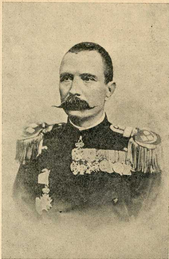
Генерал Петар Бојовић, началник штаба 1. армије

Што му ваздан по пучини језде Ка бијели по небу облаци. Има Србин на мору галије, А у мору рибе шестокриле, Па кад сунце у море замине, А звијезде небом прогледају, Шестокрилке лећу изнад мора, Извију се кано препелице, Сву ноћ поју кано ластавице. А кад с мора кроз приморје пођеш, Зелене се брда и долине, По брдима кестен и маслина, По долини смоква и неранџа. А што горе иду под облаке, Све притисла стада свилоруна, Два пут овца јагњи у годину, Више стада но на гори листа! И то бих му, опростио, слуго, Ал не могу никад до вијека, Што Владимир блиста у свијету, Ђегод идем све о њему збори! Што је Грка и Србаља што је И сувише Арбанаса љutih, Све то пјева краља Владимира, А о мени нигдје ни помена, Ђегод има земље сиритиже Све то њега пјева, благосиља. Залуд мени силе и господства, Залуд мени копља и јунаштва, Својега сам брата погубио Те преузех царску Бугарију, И српске сам земље прегасио, Многе српске круне расковао,