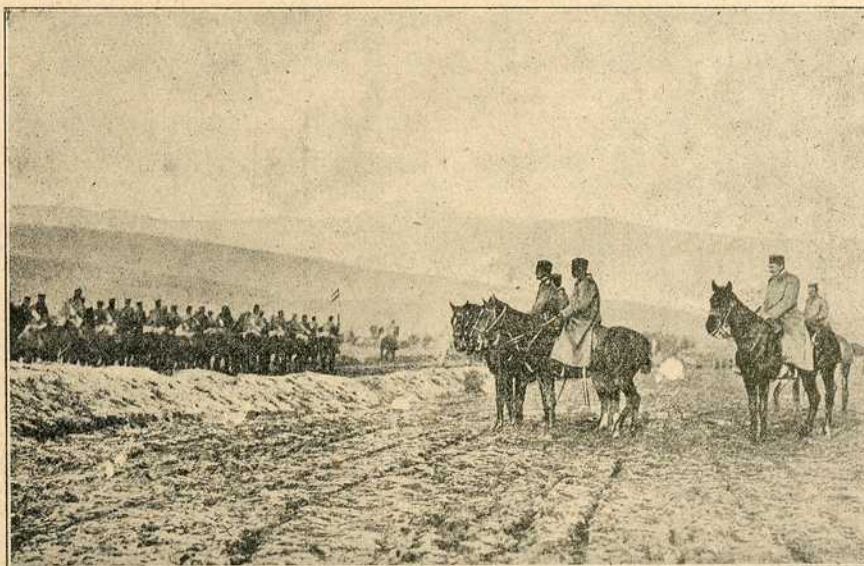
Престолонаследник Александар са својим штабом после битке код Битоља

Ал да видиш краља бугарскога Кад Владимир светом храму дође! Колико се крвник срадовао, Од софре је скоком устануо И гостима живо покликнуо: „Благо мени јутрос до вијека, Ђе надмудрих краља Владимира! Србин луду донио је главу, Јутрос ћу је узет са рамена!“ Краљ покликну Асана привикну, Диже Асан двадесет Татара И сувише краљева целата, Пак полеће цркви крај језера. Истом Асан цркви допануо А краљ стаде цркви на вратима; У руци му свето Јеванђеље,