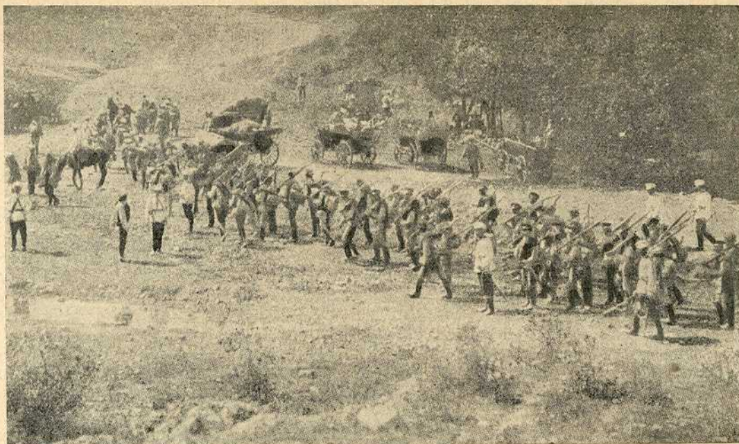
Бугари полазе да мучки нападну Србе на граници