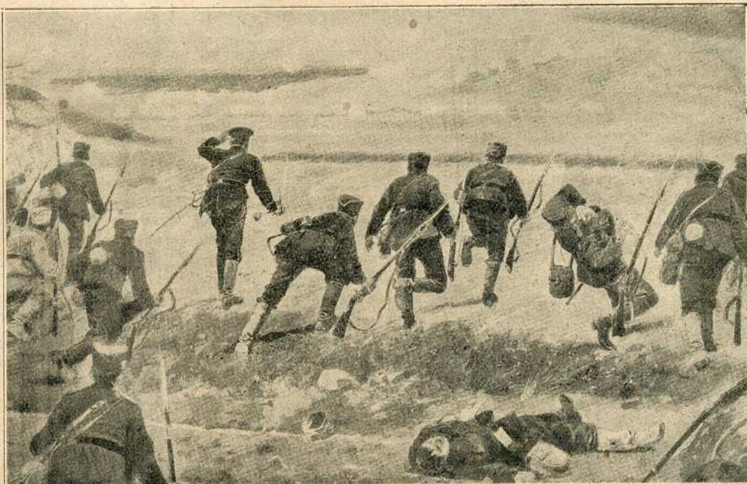
Срби јуришају на бугарске мучке нападаче и гоне их преко границе

И други приказ, приказ берлин-ског професора Клапа је од великог значаја, и волим, што су Немци за тај случај први дознали. Ствар је у овом: Један српски војник је при ју-ришу био рањен, и од јаког одлева крви је онесвеснуо на бојишту. Кад се после неког времена прибрао и дошао к себи, учинило му се, да су му браћа узмакла, и држао је поу-зданно, да ће пасти Бугарима у роп-