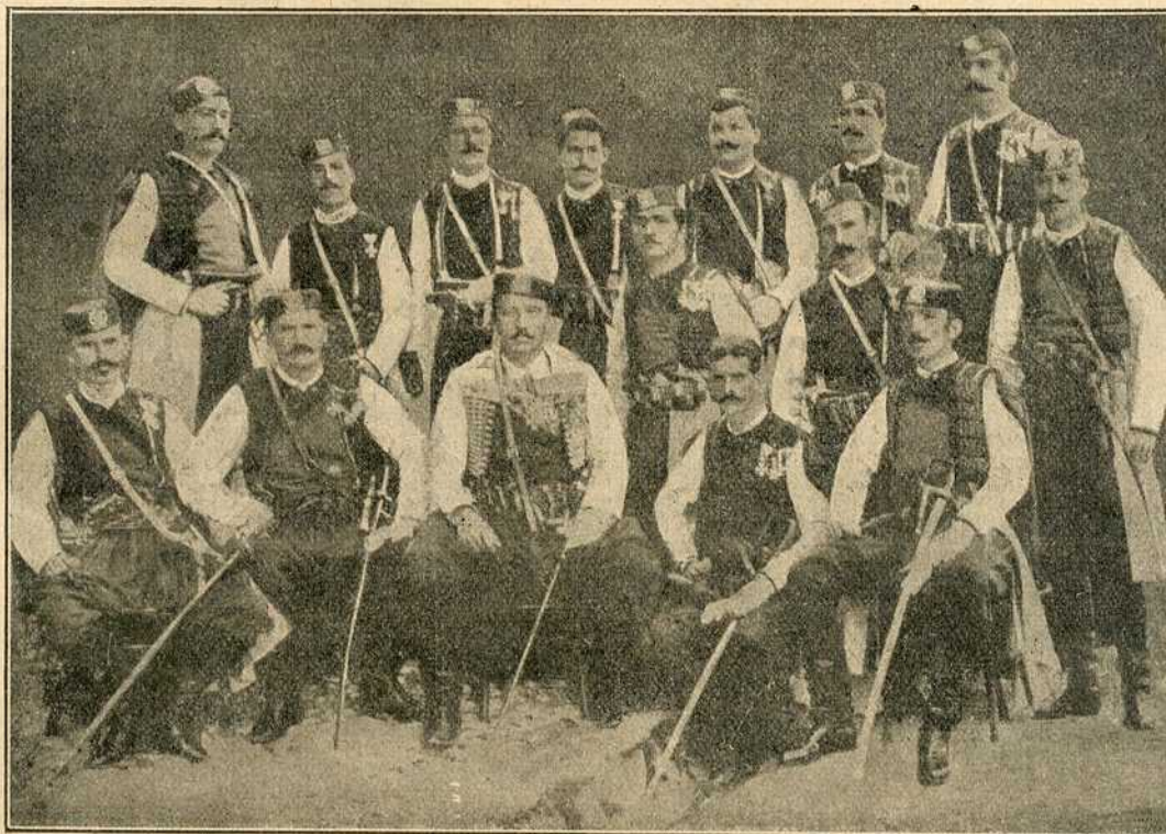
Група црногорских соколова-официра у народној ношњи

Овај бравурни напад коњичке дивизија побудио је команданта прве