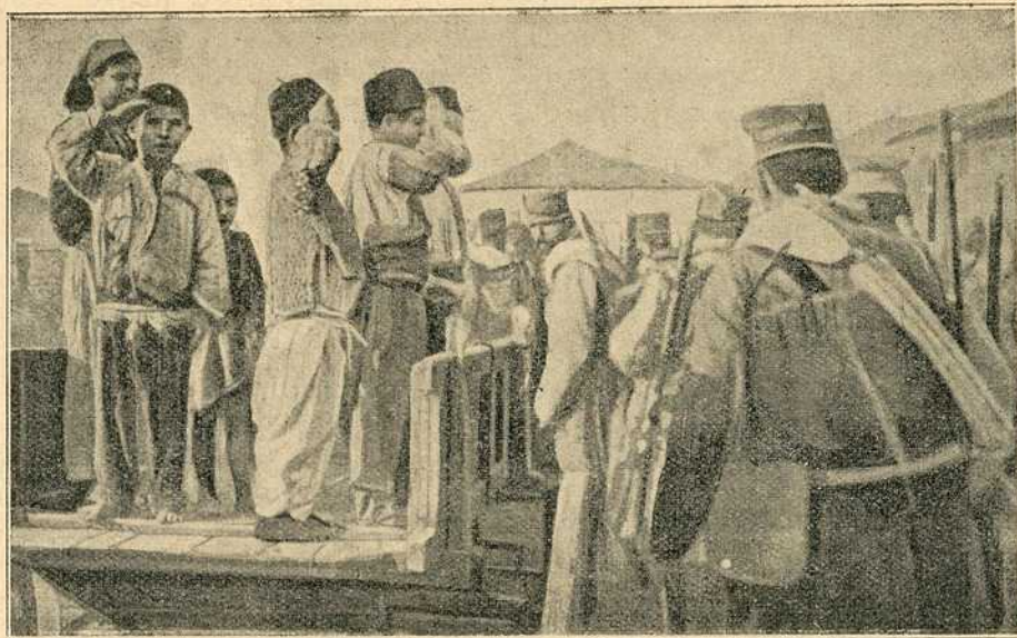
Турска деца поздрављају српску војску која је од Бугара отела Штип

Човека подузимају неки пријатни осећаји, јер види да пролазе велике историјске слике, да се догађају велики догађаји. Нигде негативног при-