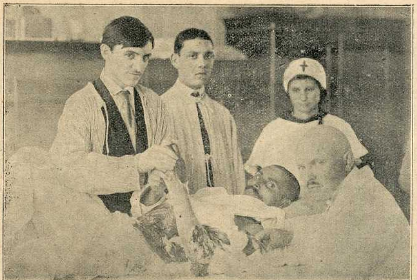
Тешки српски рањеник у болници, јунак са Једрена рањен од Бугара

На Рајчанском Риду изгледа као да је избио вулкан. Из лагане и убрзане паљбе прелази се у брзу која се слава у тупо, потмуло кључање које нервира и због своје несношљивости инстинктивно натерује да се иде напред, јер за време покрета, ма да је човек више изложен ватри него кад лежи и гађа, ипак се осећа другогачије, осећа неку топлоту, сигурност,