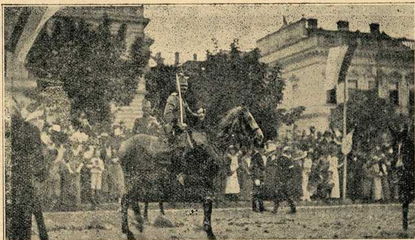
Славље у Београду:

Тужне осећаје изазиваше у гледалаца пољска болница, која је уређена у излогу у „Москви“. Болесници — рањеници од воска вешто израђени леже на слами, крај њих лекар забринут и сетан а хитра женска у белини — болничарка представљају доста неравно право стање у такој једној болници у логору.