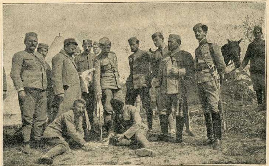
Црногорски официри на бојном пољу

Поред врућег оружја чини неспособнима за даљу борбу, и данас још, хладно оружје . Хладног оружја има две врсте: тупог и оштрог. У тупо спадају кундаци, камење и други чврсти предмети, којима се војници у борби неких пута служе. У оштро хладно оружје спада сабља, ханџар, нож и бајонет. Пред руско-јапански рат је свет држао, да ће покрај садашњег усавршеног врелог оружја бити само борби из далека, а борбе из близа, на бајонет биће ретке или их скоро и неће бити. Ну јапанско-руски рат је доказао, да су борбе на бајонет и у модерном рату потребне и доста честе. Рат између балканских савезни-