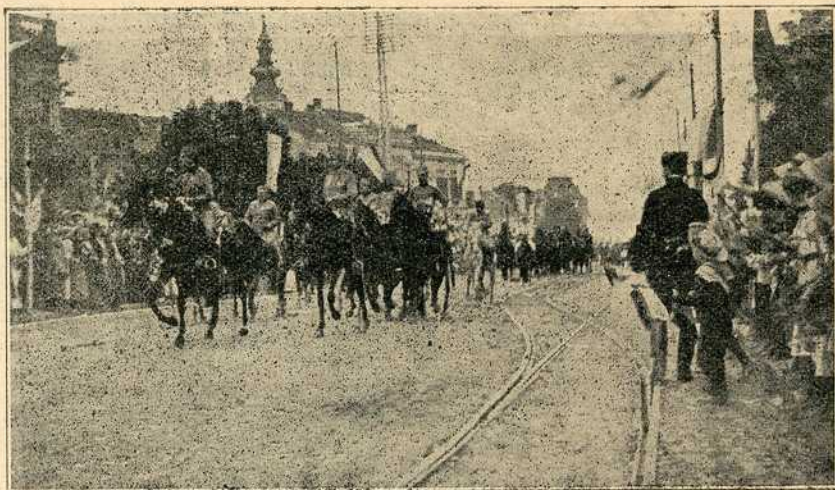
Славље у Београду: Престолонаследник Александар са својим штабом на челу победоносне српске војске

Скопља, Прилипа, Битоља, Брегалнице и др. О тој прослави донећемо још у нашем листу неке појединости; мени остаје да речем коју о уписцима , које је народ понео са те прославе и да изнесем напise и записе, који прослави даше обележје, и још неке друге ствари од значаја. Ево их.