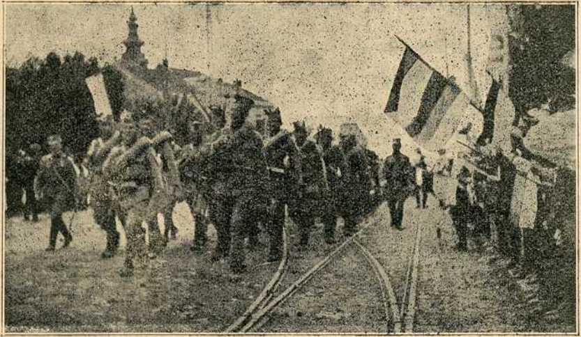
Славље у Београду: Победоносна ерпека војска пролази улицама београдским

Споменик је израдио Србин вајар. На полеђини споменика тумачи се на каменитој, мраморној плочи златним словима читава ова композиција на споменику. Небројени венци ките споменик, уз топове и митраљеви заробљене од непријатеља, још