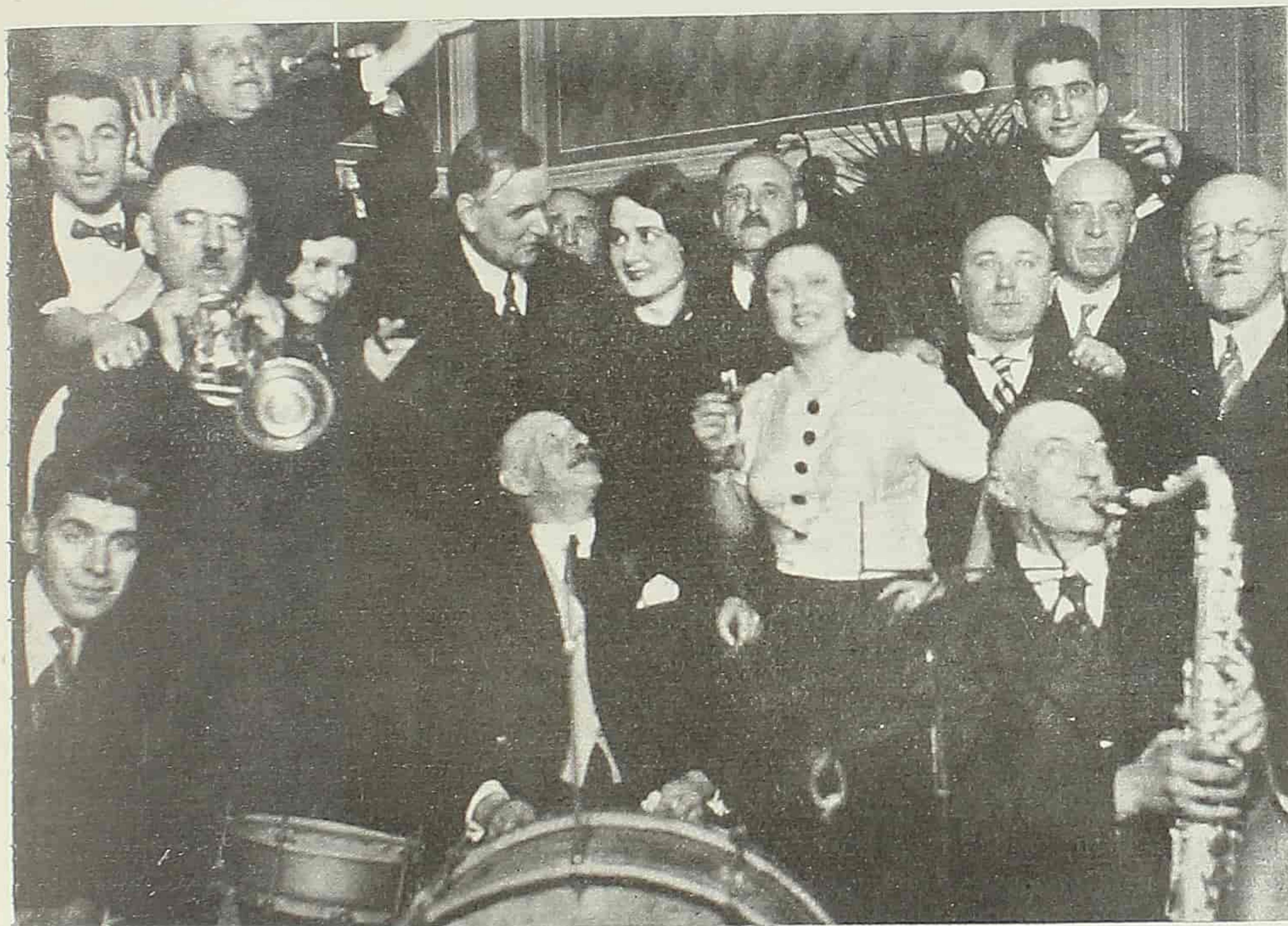
Ladies' night у Суботици, приликом посете гувернерове Un moment joyeux, lors du visite du gouverner du 77 d. à Subotica

Наш Гувернер, др. Милан Стојадиновић, учинио је своју прву званичну посету Ротари Клубу Нови Сад. Сретна околност, да се прва званична посета нашег Гувернера у Новом Саду завршила са врло успешним ladies' night, коме су присуствовала и браћа из Београда и Суботице, учврстило ме је у убеђењу, да су ladies' nights у Ротарству најбоље средство за стварање што срдачнијег пријатељства између Ротара и њихових породица. Кад сам јавио Ротари Клубовима: Суботица, Вуковар и Осијек, да ће неколицина браће из Београда пратити нашег Гувернера др. Стојадиновића приликом његове званичне посете овим клубовима, поставио сам мојим колегама — секретарима питање: „Како би било да се и код вас званична по-