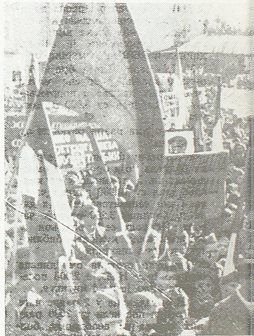
Десетине хиљада београдске омладине

„Читава земља, казао је он, гледа данас на Београд не само као на наш највећи војнички успех, већ очекује од Београда много. Никада Срби, Хрвати, Словенци, Македонци и остали народи неће заборавити да је Београд дао прве знаке којим путем треба да пођу наши народи ако хоће да се спасу уништења. Читава земља никада неће заборавити да је омладина Београ-