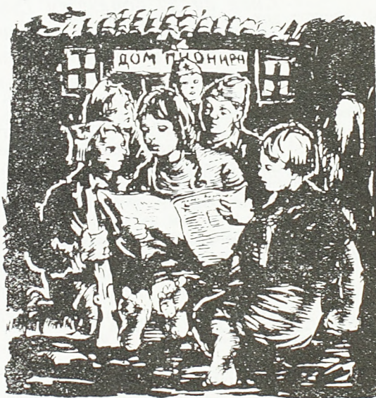
Пионери у свом дому уче