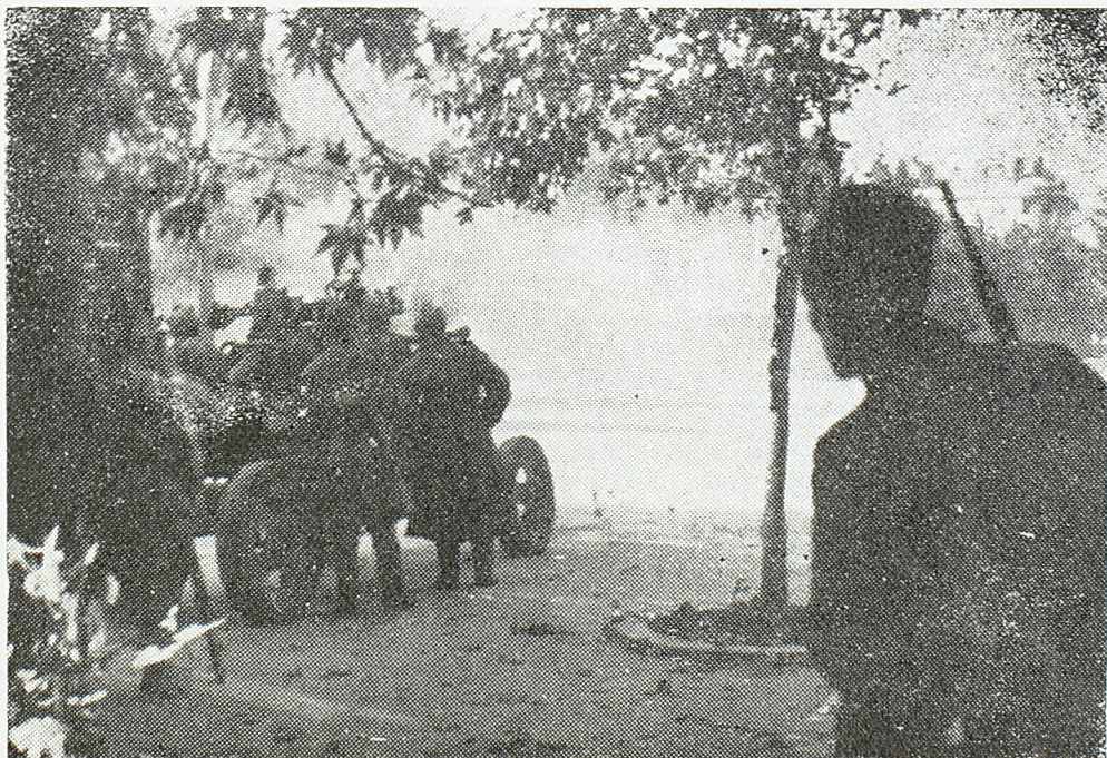
Црвеноармејци и наши борци у борби за Београд