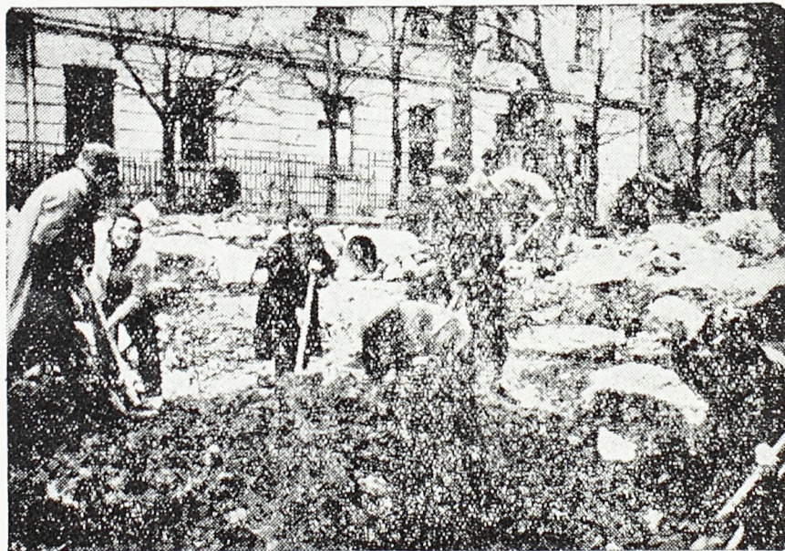
Београдска омладина на раду

»Било је и раније разних радних организација. За време окупације нагнали су нашу омладину разни народни непријатељи на радове, али их је омладина саботирала, јер је била свесна да тиме гради своју тамницу, јер није хтела да ради за фашистичке злочинце, за Немачку и њене помагаче. Кад данас омладина полази на рад у фабрику Веле, у творницу авиона у