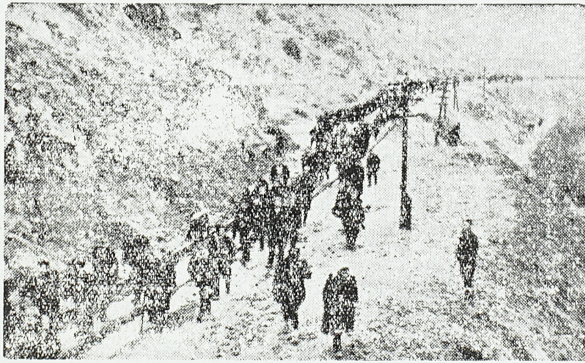
Непрекидно иду колоне омладине нишког округа у нашу војску

У новој, демократској, федеративној Југославији, војска ће бити стуб истинске народне слободе. Нова Војна академија треба да припреми за ту војску прва народне официре, који ће имати не само довољно стручног знања већ и довољно моралних услова за ту одговорну дужност. Нови официри треба да буду васпитани за васпитање, који ће са војником делити добро и зло, и показивати на свом сопственом примеру како се живи и умире за свој народ. То треба да буду учитељи родољубља и одговорни чувари великих народних тековина, не само командири него предводници, не аутомати немачког типа него свесни хероји према националном узору.