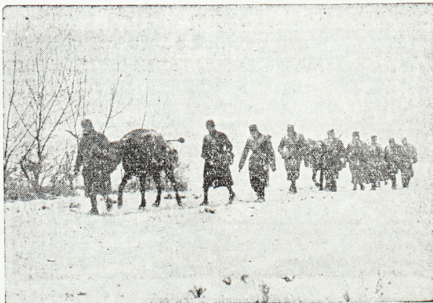
Из Срема: Колоне наших војника крећу у прве борбене редове

Нарочито значајан догађај у развоју ситуације у Грчкој претставља долазак гл. Черчила и Идла у Атину и сазивање конференције претставника грчког политичког мишљења. На конференцији није постигнут успех пошто су непријатељи јединства грчког народа, пошто су претставници ЕАМ-а изнели своје предлоге, напустили саду. Предлози ЕАМ-а су били да ЕАМ буде заступљен у влади са 40% до 50%, да се разоружа Планинска бригада и јединице издјаника Ралиса као и јединице које је Папандреу мобилисао у току борбе, а да се почетком фебруара одржи плебисцит по питању монархије а почетком априла избори за уставотворну скупштину. Једино питање по коме је постигута сагласност је уопштава референдум као битан предуслов решавања осталих проблема.