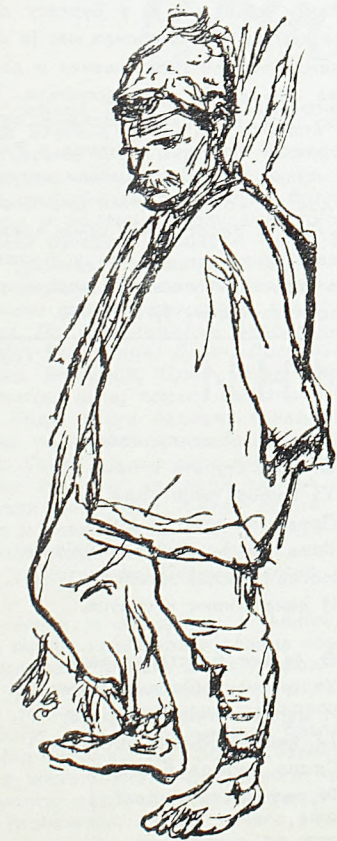
Мујезиновић: Одборник из Шаховића