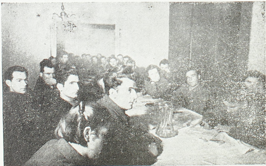
Са заседања Централног одбора УСАОЈ-а

После оставке генерала Радеска, чија се влада тешко компромитовала пуцањем на демонстранте, потајним прикривањем фашиста и другим реакционарним мерама, краљ Михаило отпочео је консултовање личности из национално-демократског фронта, којима треба да буде поверена нова влада. У Јашију и другим местима Румуније одржани су велики зборови на којима је тражено образовање једне јаве национално-демократске владе, која ће одмах предузети суђење ратним злочинцима и радикално чишћење државног апарата и читавог јавног живота од профашистичких елемената.