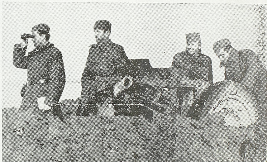
Наша артилерија на положају у Срему

Други сектор налази се у простору Сарајево—Брод. Главнина немачких трупа у Босни, оне које се под непрекидном борбом повлаче из Херцеговине према Сарајеву, и оне које се већ налазе у њему, отсечене су од свога залиха јер се око једине комуникације за њихово повлачење, око пруге и пута Сарајево—Брод, воде упорне офанзивне и дефанзивне борбе у којима су наше трупе успеле већ да овладају извесним доминантним тачкама. Немци чине очајне напоре да прокрче себи пут за повлачење. Уз очајне напоре они су успели поново да овладају путем Зеница—Жепче, али су истовремено испустили из руку читав низ упоришта северно одатле, у простору Жепче—Маглај. Северно од Сарајева, код Високог, дигнут је у ваздух један немачки блиндиран воз, док су јужно од Сарајева, гонећи непријатеља долином Неретве, наше трупе ослободиле Коњиц, последње немачко упориште у Херцеговини.