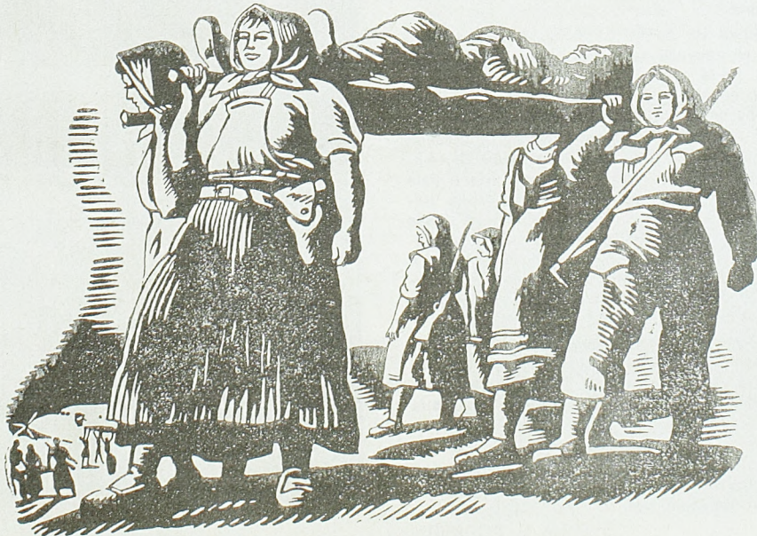
Босанске девојке носе рањеника