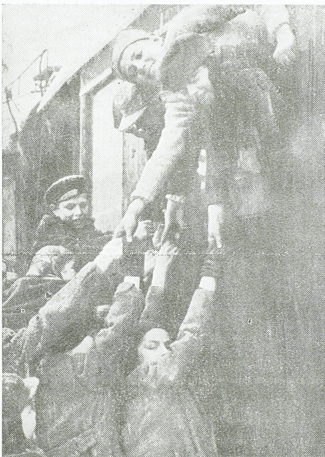
Из Бугарске: наша и бугарска деца братски стежу руке

дељу не може се замислити ни успех. Наше организације ће створити привремене одборе, који ће руководити прославом и организацијом свих акција Светске омладинске недеље. Ти одбори ће свестрано искористити штампу, конференције, митинге, спортске такмичења и