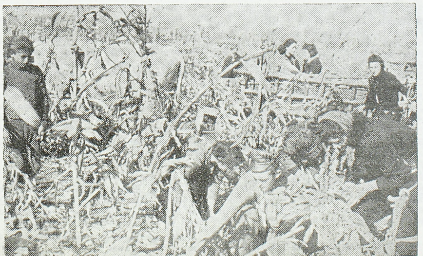
На пољима Срема неће остати ни један клип кукуруза