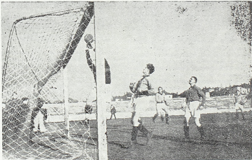
Моменат пред други гол на утакмици „Црвена звезда“—II београдска бригада

„Наш стари спорт“ рекао је друг Жујовић, „тако је био васпитао своје чланове, да се они нису одазвали позиву своје земље да је бране. Насупрот тога, водеће спортске личности биле су верне слуге окупатора, помажући му да спорт употреби као средство да скрене пажњу омладине са народно-ослободилачке борбе, и да је забавом умртви и опије и тако учини безбедном“.