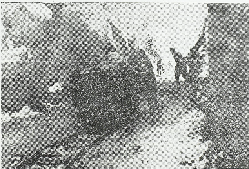
Данас смо оборили норму: 620 м. пруге је постављено